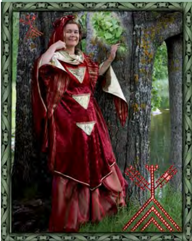
Yksi emohaltiahahmoista on Lemmetär, jonka ohjeen mukaan halaaminen, lämpöinen olemus ja rakkaus parantavat terveyttä ja tuovat kauneuden säteilyä iholle.

si vain työttömäksi istumaan kotona, jatkan mieluummin omaa juttuani, niin kauan kun voin, Keränen toteaa.