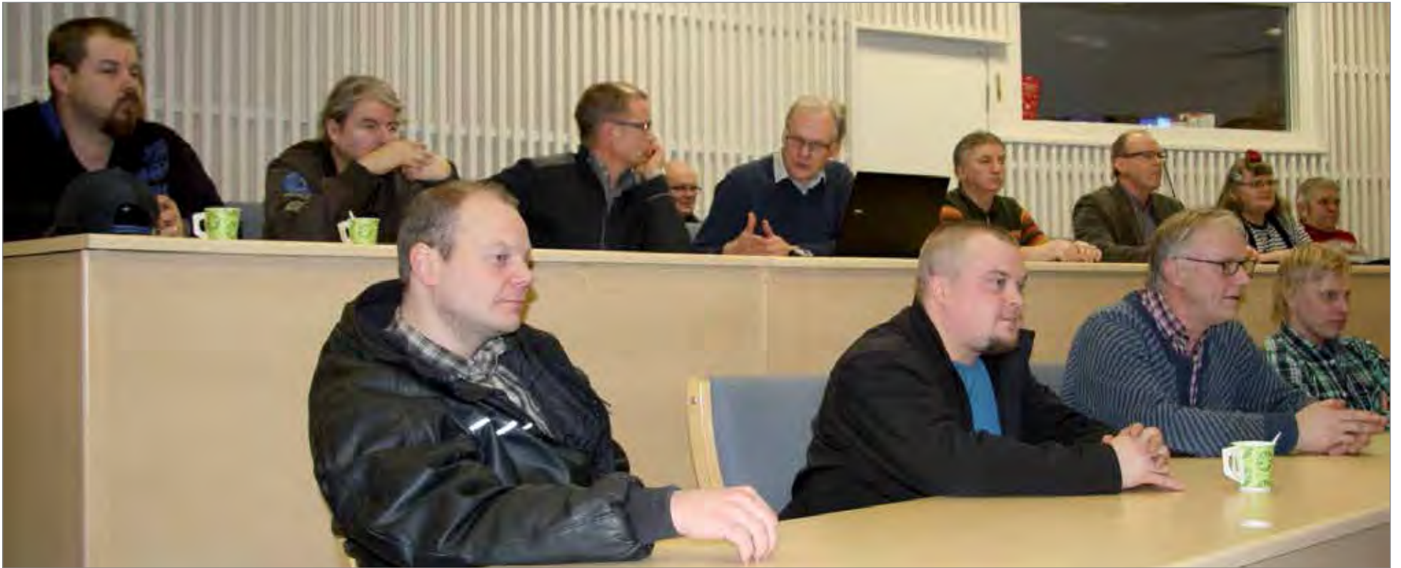
Yrittäjiltään osallistui reilut 20 yrittäjää ja tarjouskilpailun asioista kiinnostunutta henkilöä.