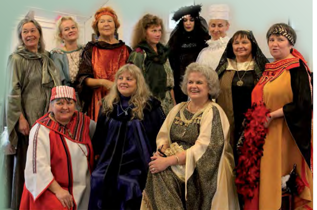
Pohjolan valon ja voiman emohaltioiden mallit kokoontuivat ryhmäkuvaan.