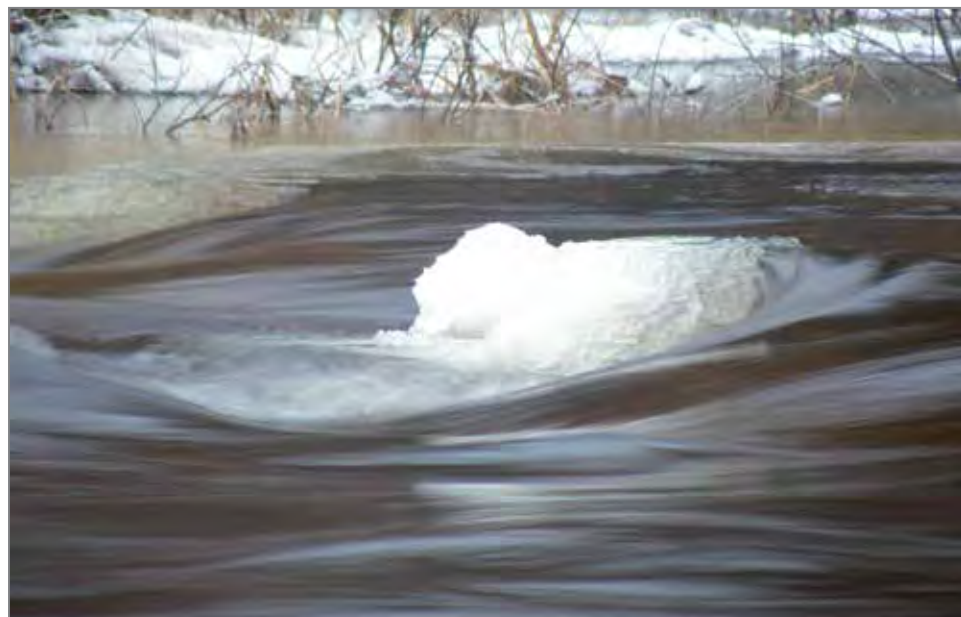
Vedenvirtauksen kuvaaminen pitkällä valotusajalla.