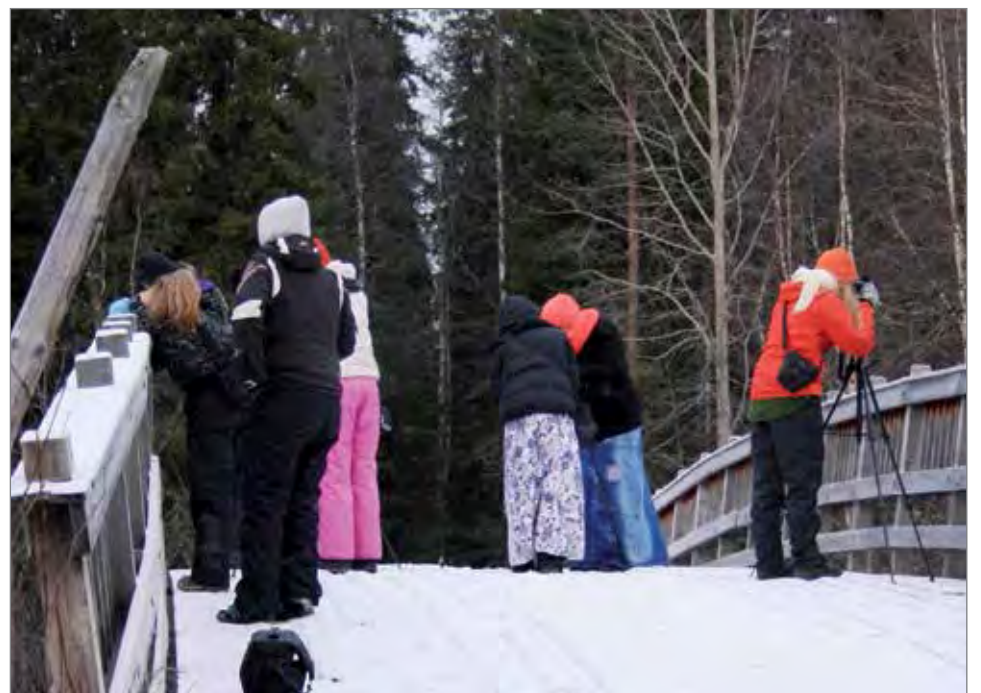
Leiriläisiä kuvaamassa Anninkosken sillalla.