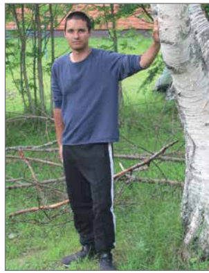
Reissunsa Kristian aikoo selvittää kahdella parilla kenkiä.

Kokonaisuudessaan matkaa kertyy noin 1400 kilo-