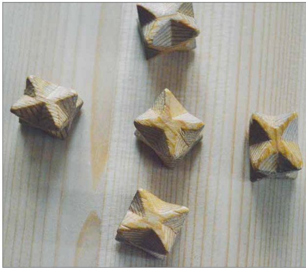
Pissikivet on tehty koivun paloista ja niihin on kaiverrettu joka nurkkaan lovi.