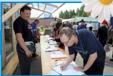
Arpojen myyntiä markkinoilla