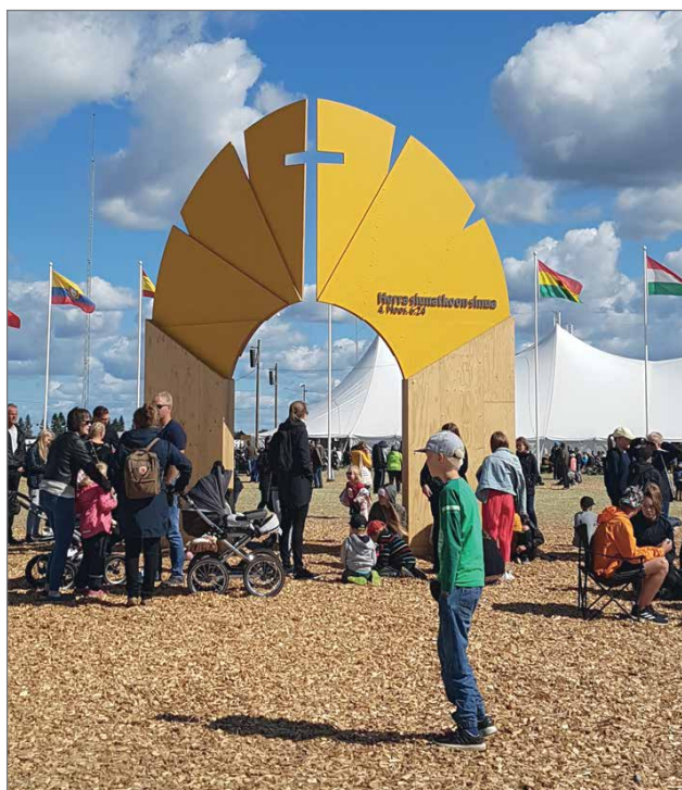
Seurateltha, lippurivit, seuraportti ja seuraväkeä.