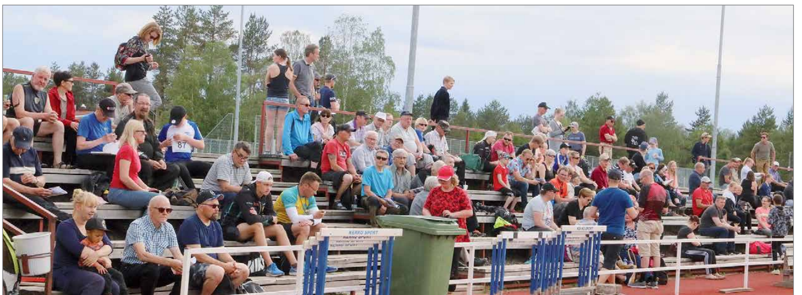
Kauniilla säällä yleisöäkin oli saapunut katsomoon runsaasti.

Kaikki yleisurheilutulokset löytyy osoitteesta: www.tilastopaja.fi