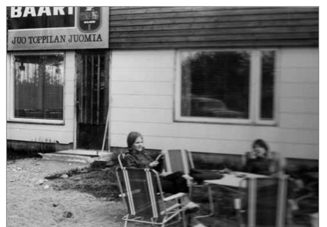
Kokkokylän ensimmäinen baari avattiin myös 60-luvun lopulla.

Isäni työn vuoksi ensimmäinen auto hankittiin 1956. Siihen asti isäni ajeli työreissut Norton-merkkisellä moottoripyörällä. Kylässä oli tuolloin myös yksi taksiauto. 60-luvun lopulla oli ilmestynyt auto moneen taloon. Isäni käytti työssään käsin veivattavaa, sähköistä laskukonetta. Puhelin on tullut kotiin varhain, varmaan jo 50-luvulla. Niitä oli silloin ehkä parissa muussa talossa ja molemmissa kampuissa. 60-luvulla puhelimet alkoivat yleistyä.