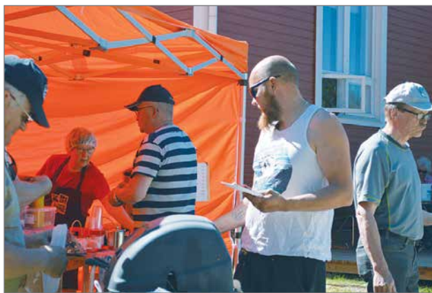
Peräkärkykirppistä vietettiin 15.6. Siuruan Työväentalolla. Ilma suosi leppoisaa tapahtumaa. Paistettiin lätyjä, tarjottiin makkaraa ja kahvia.