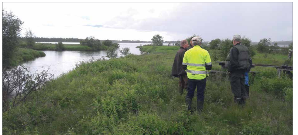
Potentiaalista hoidettavaa alaa on paljon, pelkästään Pöllänjokisuistossa 60 hehtaaria.