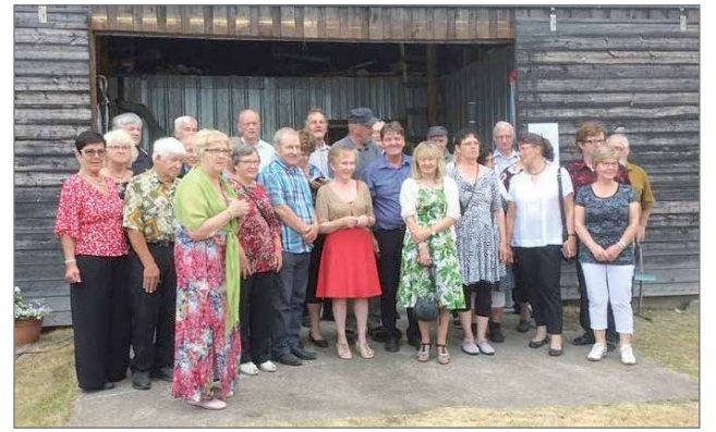
Kuva viime vuoden kesäisestä kokoontumisesta.

Tulevassa tapaamisessa meillä on reippaita "kokkipoikia" keittämässä kylän kuulua lohisoppaa ja naisilla on oikeus vain pyöräyttää kahvipullat. Koko tämä katus maksaa vain 10 euroa henkilö. Arpoja on myytävänä ja niissä tietenkin hyvät voitot. Kylillä vakinaisesti asuvat voivat tuoda halutesaan tuotteita myyntiin. Ohjelmaa on myöskin tarjolla. Suopunki -yhtye soittaa musiikkia ja laulattaa myös yhteislaulua. Eihän tilaisuus