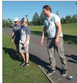
Kansanedustaja Ville Vähämäki ihasteli Rajamaan rannan puiston kauneutta ja monipuolisuutta.

männän kerran Pikkujuhannuksen ja osallistuimme Pudasjärven markkinoille. Vaalityöhön valmistautuminen keväälle 2019 aloitettiin jo vuoden lopulla.