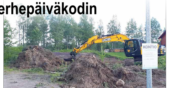
Uuden yksityisen perhepäiväkodin maanrakennustyöt on aloitettu. Arvioitu valmistumisajankohdasta on ensi talvena.

Nykyisen Naperolinnan ryhmänsä tilojen ja toiminnan tarve kartoitetaan, onko sille tarvetta uuden Karhukunnaalle rakennettavan yksikön lisäksi.