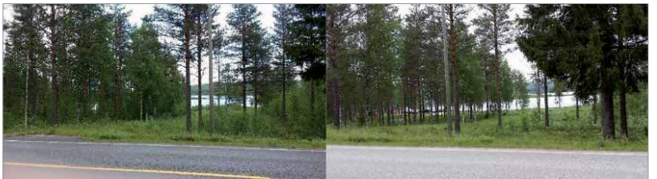
Näkymä Puolangan tieltä avautui komeaksi. Nyt myös P-paikalle näkyy Jaurakkajärvi ja laavu.

Alueella järjestetään tulevina lauantaina vetouistelun PVO-cupin kisa, joten esimerkiksi silloin voi käydä ihastelemaan lopputulosta.