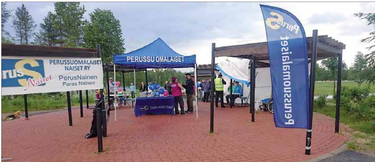
Perussuomalainen miljö, kuva Tuomas Okkonen.