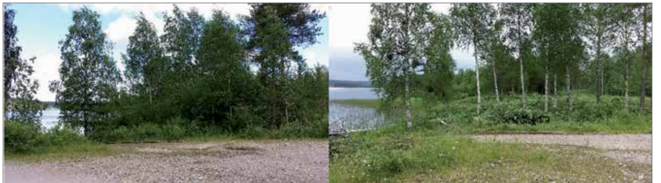
Veneen laskupaikan muutos, tämä puska esti tehokkaasti näkymän Puolangantieltä järvelle.