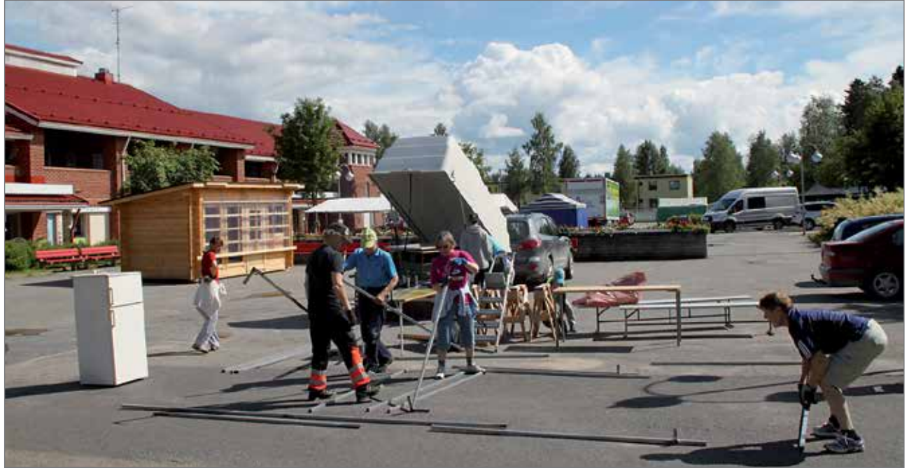
Torstaina torilla pystytettiin markkinakojuja aurinkoisessa kelissä. Huomisellekin ennustetaan päiväksi aurinkoista säätä.

Jatkossa perhehoidossa voisi vastaajien mielestä tehdä vielä enemmän yhteistyötä muiden asukkaiden ja omaisten kanssa. Osa vastaajista koki myös tarvitsevansa lisää tietoa perhehoidosta ja sen mahdollisuuksista.