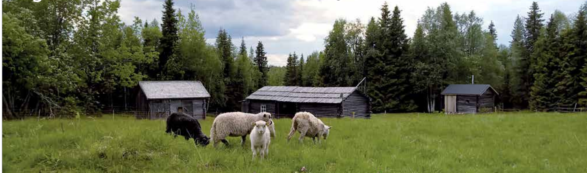
Rytivaaran lampaat.

Luonnonystäville on tiedossa paljon iloisia kesätapahtumia niin Syötteen kansallispuistossa, luontokeskuksella kuin Pudasjärven kotiseutumuseollakin. Retkeilyn ja luonnon tarkkailun lomassa uutta puhtia voi hakea luontokeskuksen kahvilasta, joka palvelee asiakkaita aina luontokeskuksen aukioloaikoina.