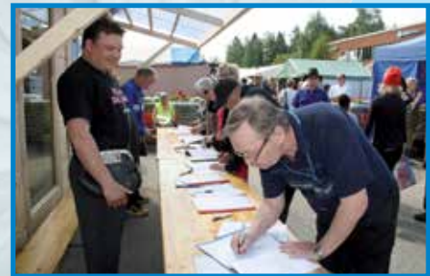
Arpojen myyntiä markkinoilla