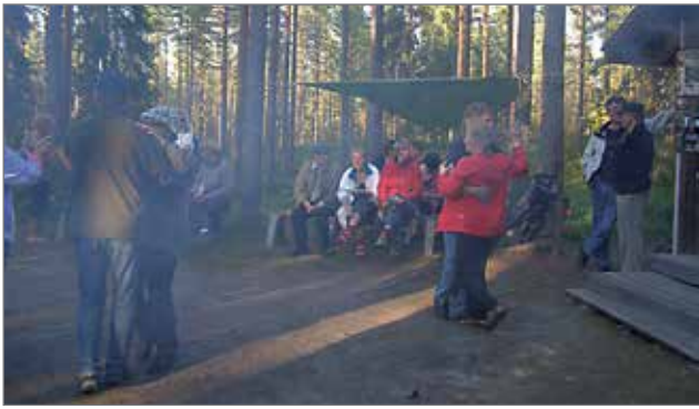
Pimpinkankaalla -90 luvun tunnelmia.