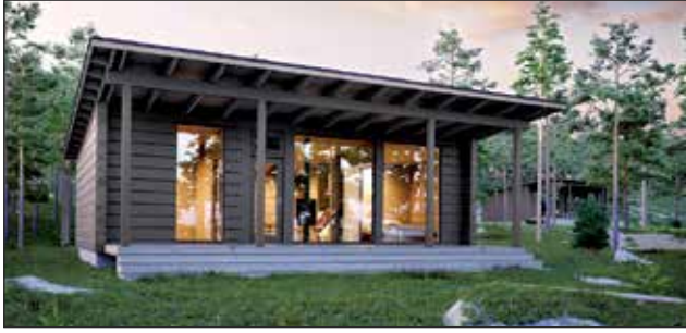
Kontiotuote toimittaa viisi GlassHouse-mallistosta modifioitua huvilaa SantaPark Oy:lle tänä joulukaudeksi.