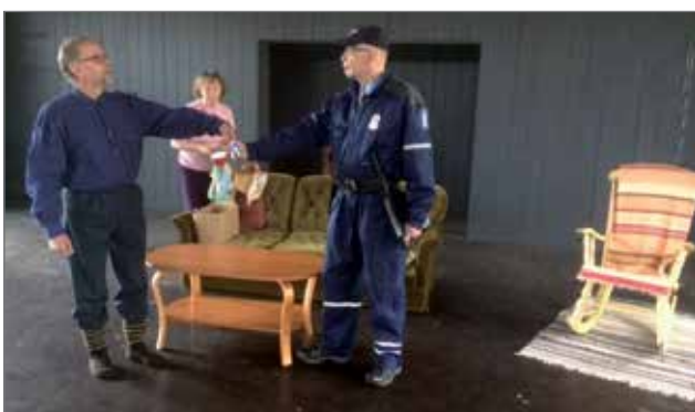
Poliisin ilmestyminen kotiin saa Veinin ja Moonikan hämmilleen.

Sirkku Peltolan haastava teksti on vaatinut näyttelijöiltä tarkkuutta ja kykyä eläytyä. Teksti ei ole ollut itsestään selvää. Dialogit ovat kepeitä ja il- mavia, mikä on antanut myös