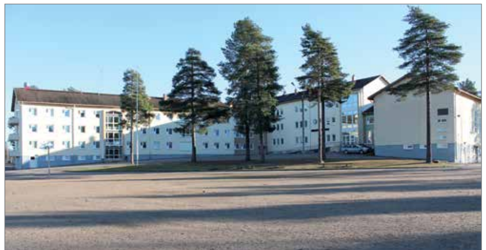
Kurenalan koulun irtaimistoa myydään yleisölle keskiviikkona 12.7.2017 klo 9 - 13.

Koulukiinteistössä pääsee liikkumaan vapaasti.