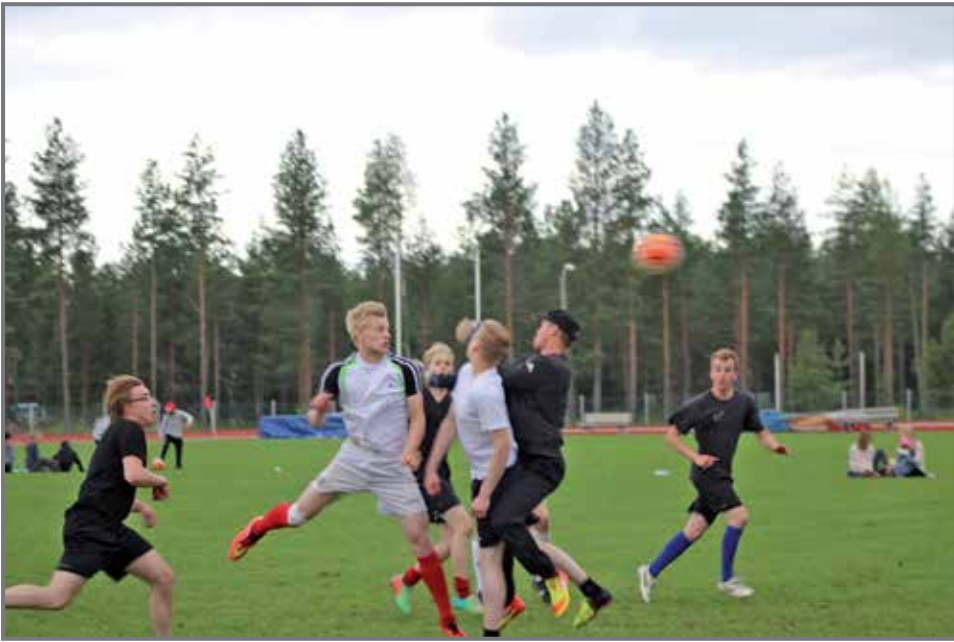
Viime vuoden yllättäjä Tötterö (valkoisissa paidoissa) puolustaa mestaruutta Heinätturnauksessa 7.-8.7.

FC Kurenpoikien toimintakausi on vilkkaimmillaan heinäkuun alussa. Sarjatoiminnassa kevätkausi jatkuu heinäkuun puolelle vielä miesten Nelosessa ja P12 Ykkösessä. Muilla junioreilla on sarjatauko, mutta missään nimessä jalkapallosta ei lomailla.