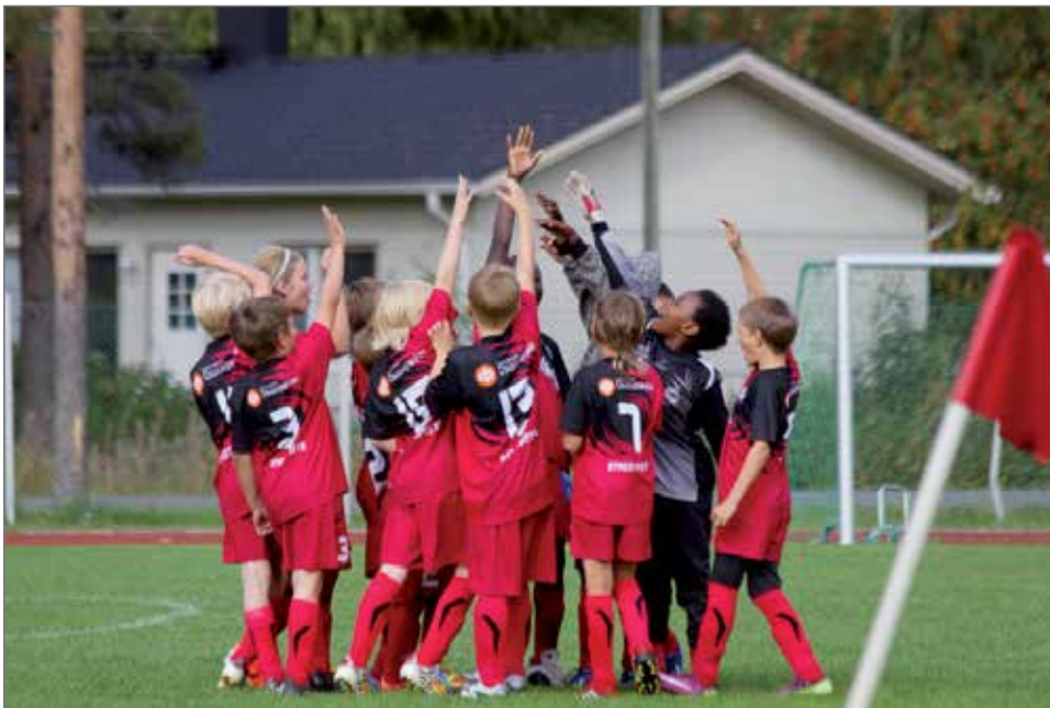
FC Kurenpojat nostaa punaisen kortin rasismille kaikille avoimessa tapahtumassa to 6.7.

Kurenpoikien isommat juniorit ja kesäyöntekijät pitävät koulua lapsille Suojalinnan kentällä päivittäin 11-13.