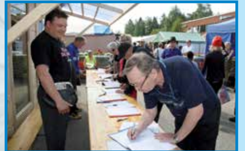
Arjojen myyntiä markkinoilla

Markkinapäivinä pudasjärveläisissä yrityksissä monenlaisia markkinatarjouksia - kannattaa poiketa!