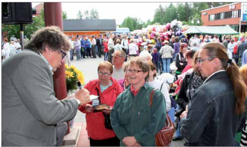
Mikko Alatalo jakamassa nimikirjoituksia esiintyessään edellisen kerran Pudasjärven markkinoilla.