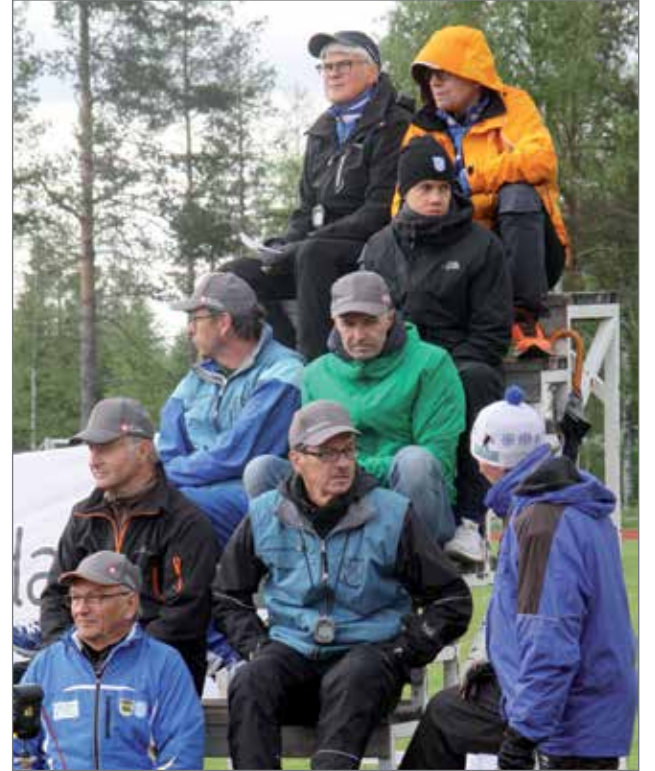
Maalituomarit ja ajanottajat seurasivat tarkasti jokaista maaliintuloa.