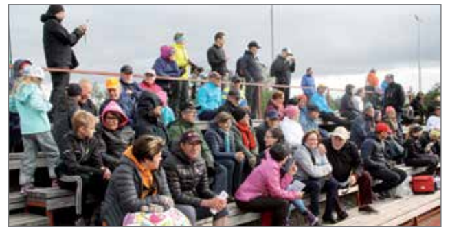
Katsojia oli useita satoja.