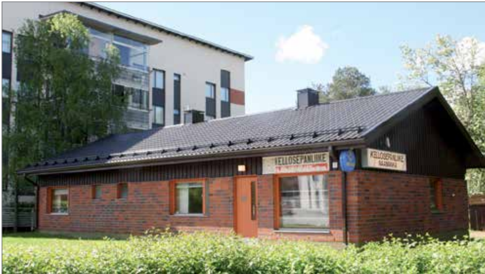
Kellosepänliikkeen toimitalo on rakennettu Jukolantien alkuun vuonna 1982.

koruja ovat Kalevala-korut, joita menee jopa päivittäin. Hyllyillä on myös palkintopokaaleja ja kukkavaaseja, joista pistää silmään Suomi