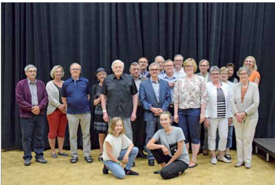
Yhteiskuva tämän kertaisen kokoontumiseen osallistujista.

Talalan sukuseura kokoontui lauantaina 17.6 Pikku-Syötteelle. Syötteellä oli vilskettä ja vipinää, koska samaan aikaan siellä oli mitava pyöräilytapahtuma ja nuorten rippileiri.