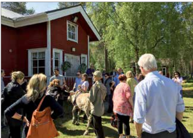
Poro-Panuman tilalla vieraat innostuivat poroista todella ja Mooses-poro teki parhaansa suuren vierasjoukon keskellä.