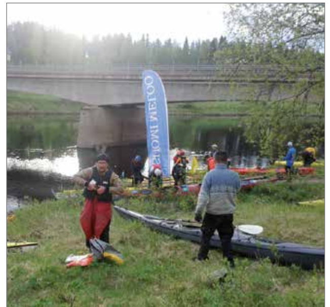
Melajat pysähtyivät Ervastin sillankorvassa, josta oli 25 kilometrin matka seuraavaan pysähdyspaikkaan Rajamaan rantaan.