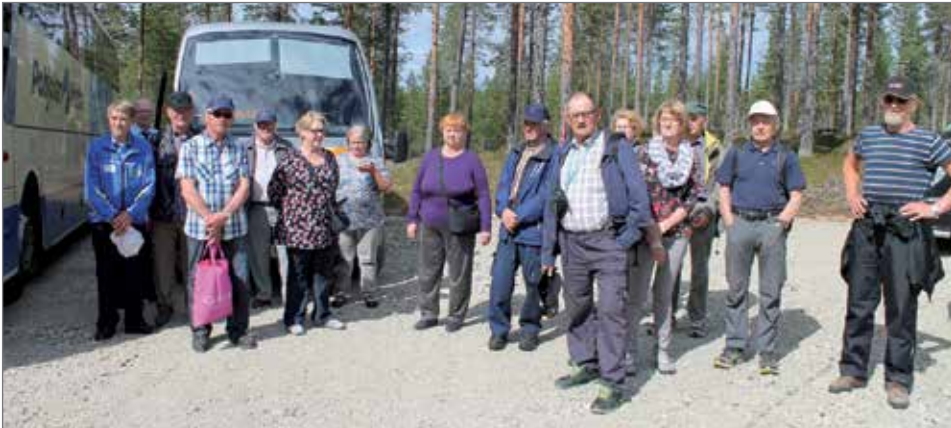
Pudasjärven Närekerholaiset yhteiskuvassa Nevakiven bussin edessä Hossan paikoitusalueella.

ti käyntiin kello 12.30 Mieskuoro Huutajien huudolla kansallispuistolle Huosilammen rannalla. Juhlapuheen piti tasavallan presidentti Sauli Niinistö. Muissakin puheissa korostui erityisesti mm. ainutlaatuinen luonto, alueen merkitys itsensä säilymisessä ja koko maamme historiassa. Muutamia historiallisia, alueen kannalta tärkeitä merkkipaaluja ovat olleet mm. K.J Stålbergin synnyin pitäjä Suomussalmi, Elias Lönnrotin runokerrumatkat sekä Raateentien