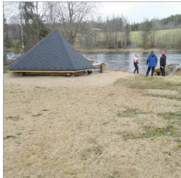
Ervastissa oli aamupalaa tarjolla aikaisin aamulla melojille, joista osa nukkui autoissa.