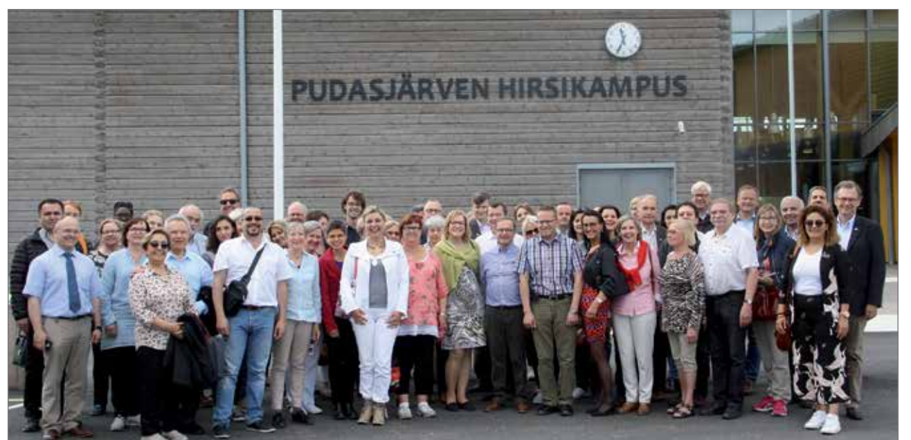
Hirsikampusvierailu teki 12 eri Euroopan maan alue- ja keskushallintoviranomaisiin suuren vaikutuksen.