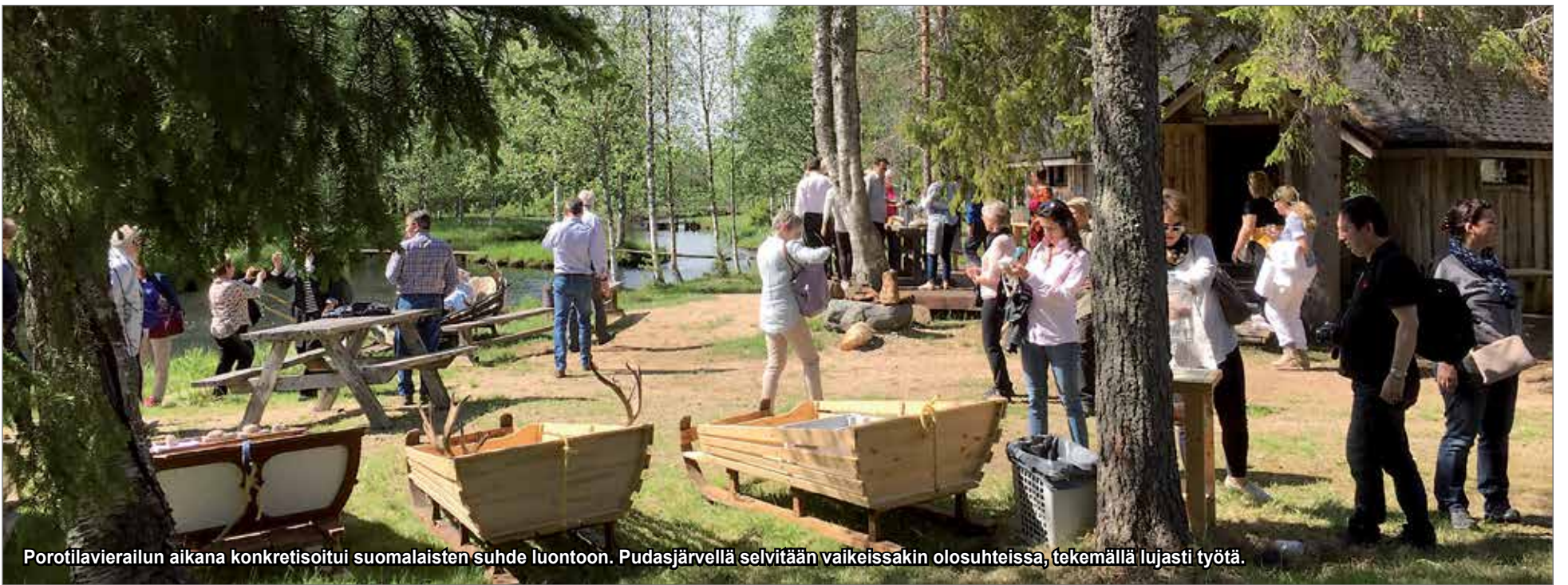
Porotilavierailun aikana konkretisoitui suomalaisten suhde luontoon. Pudasjärvellä selvittää vaikeissakin olosuhteissa, tekemällä lujasti työtä.