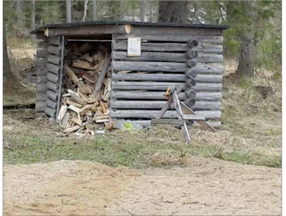
Kyläyhdistyksen miehet ovat huolehtineet, että laavulla riittää polttopuuta.

Kiitän sitä pienä aktiivista talkooporukkaa, joka