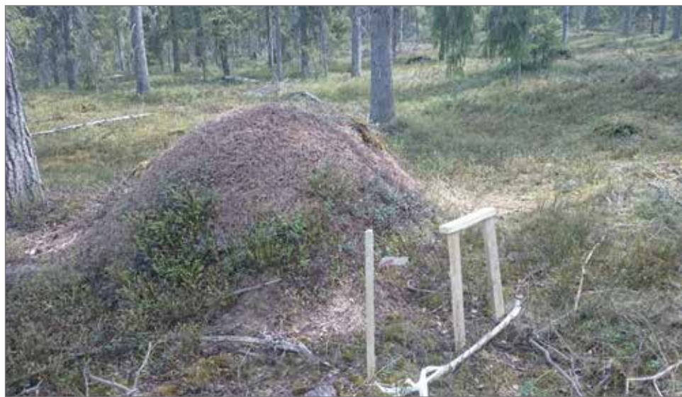
Syöte-Suunnistuksen valmistelut ovat aikataulussaan, vain rastilippu puuttuu.