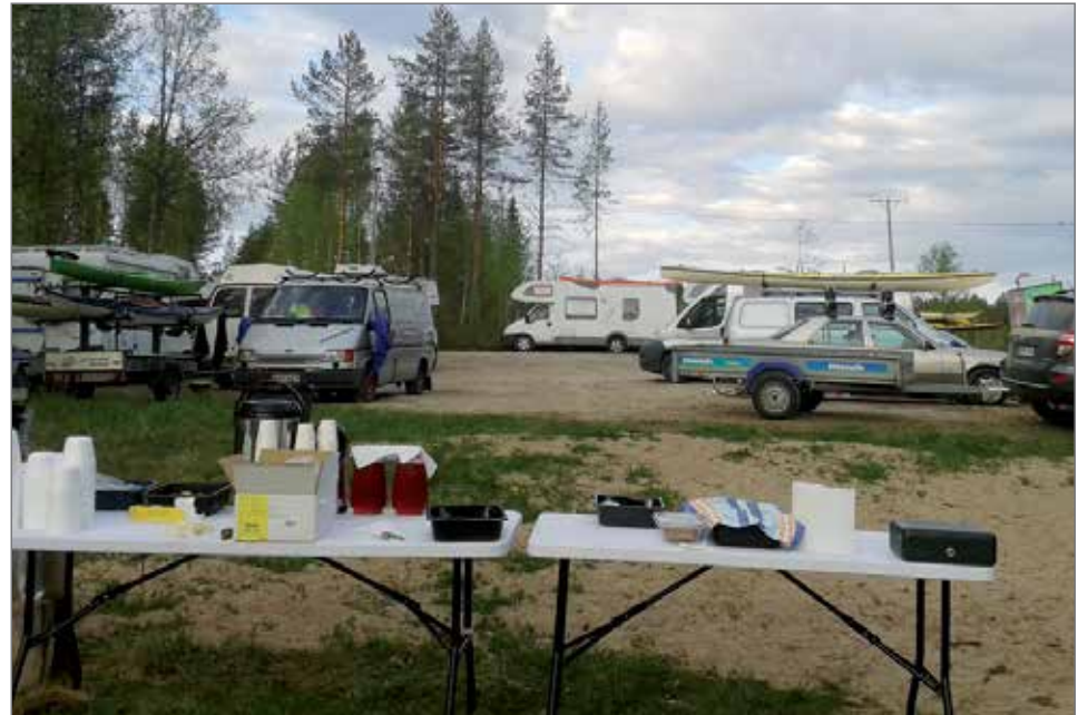
Laavualueen siisteydestä vastaa Ervastin kyläyhdistys.

osallistui molempien tapahtumien läpivientiin ja uusia talkoolaisia otamme mielellään mukaan.