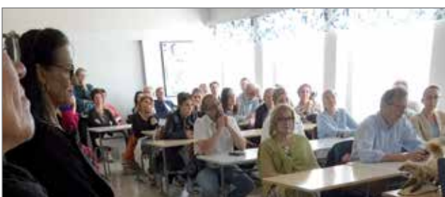
Vastaanottokeskuksessa vierailun yhteydessä todettiin Suomen kuuluvan vahvasti Eurooppaan. Esimerkiksi turvapaikanhakijoiden tilanne on täällä sama kuin muuallakin.