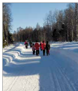
Lasten kerhon kevätretki Kalastuskeskukseen makkaranpaistoon.