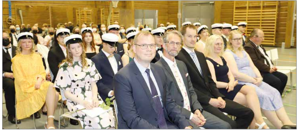
Hirsikampuksen juhlasalissa vietettiin jo neljäntenä keväänä ylioppilasjuhlaa. Olisi jo viides, mutta viime vuonna juhla vietettiin virtuaalisesti. Tänä vuonna yleisönä olivat vain oppilaiden vanhemmat.

poistuivat salista kulkueena ryhmäkuvaan, jonka jälkeen kävivät luovuttamassa ruusun aulassa olevan sankarivainajien muistolaatalle.