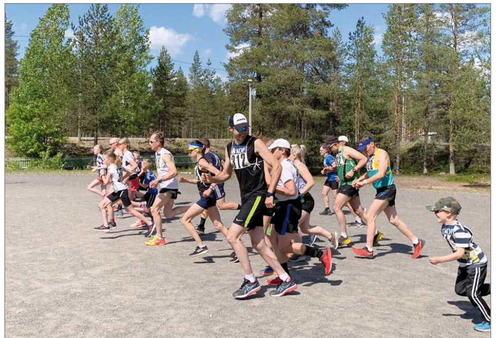
Korentokankaalla Hirvaskoskella juostiin lauantaina 12.6. jo kymmenettä kertaa puolimaraton ja lyhyempiä matkoja.

Korentokankaalla Hirvaskoskella juostiin lauantaina 12.6. jo kymmenettä kertaa puolimaraton ja lyhyempiä matkoja. Sää oli poutainen, mutta tuulinen. Tuuli nappasi telttakatoksen mukaansa, mutta onneksi il-mankin pärjättiin. Lieneekö se vaikuttanut myös puolimaratoonareiden määrään, heitä oli tällä kertaa normaalia vähemmän.