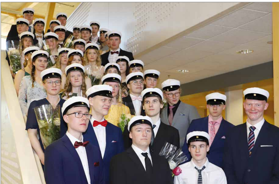
Vuoden 2021 ylioppilaat yhteisessä kuvassa Hirsikampuksen yläkerran portailla. Yhteiskuvan jälkeen ylioppilaat luovuttivat yhden ruusun aulassa olevan sankarivainajien muistolaatan yhteyteen.

Kun Pudasjärvi Ruotsiin lähti -teoksen ohjausryhmä lahjoitti ylioppilaille kirjan. Todistuskansiot oli lahjoittanut Pudasjärven Osuuspankki. HT