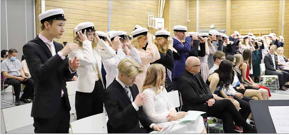
Ylioppilaksi julistaminen ja valkolakki paikoilleen todistuksien jakamisen jälkeen.

Pudasjärven lukion ylioppilasjuhla oli lauantaina 1.6. neljättä kertaa (olisi viides, viime vuonna yo-juhla vietettiin virtuaalisesti) Hirsikampuksen juhlasalissa. Pudasjärven lukiosta sai valkolakin 36 uutta ylioppilasta. Juhlaan oli kutsuttu ylioppilaiden vanhemmat. Lukion ensimmäisen ja toisen vuosikurssin oppilaita ja opettajia seurasi juhlaa Hirsikampuksen aulassa ja juhla välitettiin koteihin netin kautta.