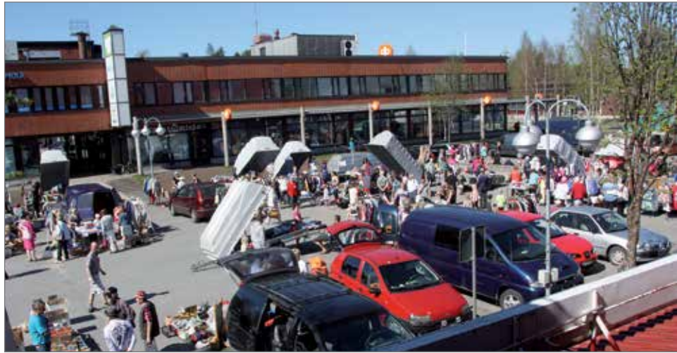
Torin kesänavaus veti paikalle lukuisia kirpparimyyjiä ja ostajia.