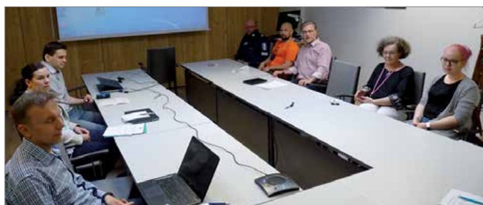
Pudasjärven kaupungin liikenneturvallisuusryhmä kokoontui tiistaina 13.6. pohtimaan turvallista pyöräilyä ja samalla muitakin liikenneturvallisuusasioita.

2016 kuoli poliisin tietoon tullessa liikenneonnettomuuksissa 240 henkilöä, joista pyöräilijöiden osuus oli yli 10 prosenttia. Tutkimusten mukaan kypärän käyttö olisi pelastanut kuo-