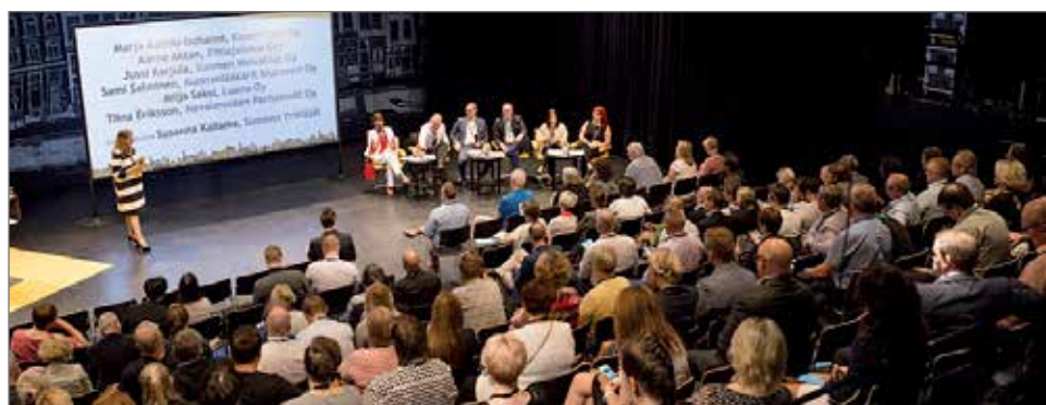
Ouluun kokoontui lähes 1000 kuntapäätäjää ja yrittäjiä Suomen Yrittäjien järjestämään vuosittaiseen kunnallisjohdon seminaariin.