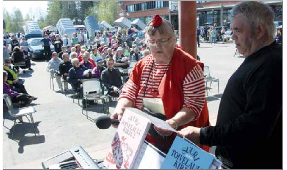
Suvivirsi kaikui torikauden avauksessa kauniissa kesäsäässä.

Myös Paavalipuistossa tapahtuu kesällä. Siellä jatkuu viime kesänä alkanut kaupungin viljelyprojekti. Sillä halutaan kannustaa erikäisiä ihmisiä yhteisen harrastuksen kautta tekemään