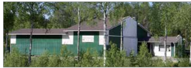
Kaupungin ostama Pistotie 4:ssä sijaitseva Kellokulma kiinteistö näkyy hyvin valtatie 20 kulkijoille.

Kaupungilla on Nevakiven kanssa kaikille avoimet palveluliikesopimukset Kipinän ja Asmuntin reiteillä,