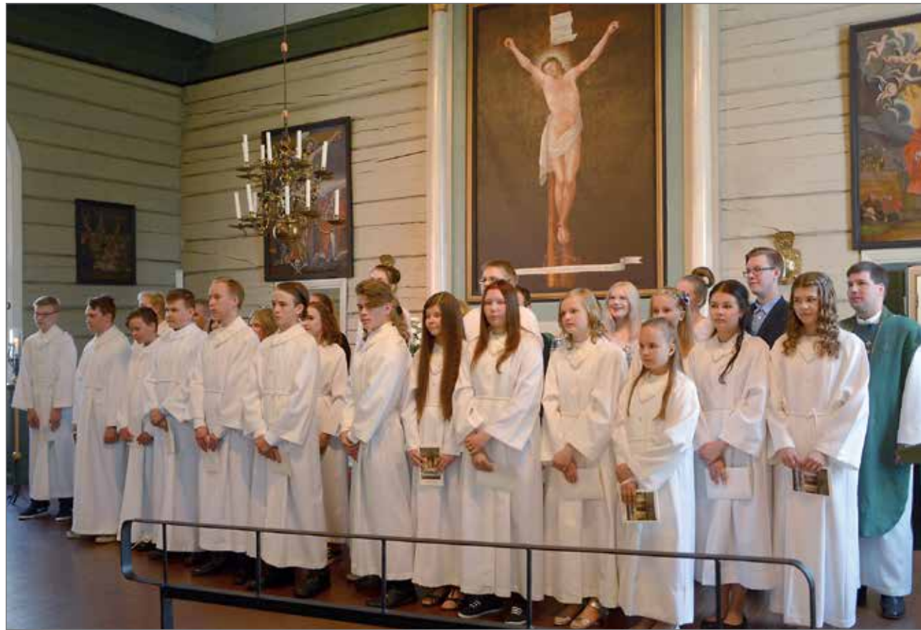
Sunnuntain 12.6. konfirmoitiin 23 rippikoululaista.

lulainen kysyttäessä konfirmatiopäivänä leiriviikon tunnelmia. Toinen rippikoululainen sanoi: "Leirillä oli mukavia isosia ja paljon syömistä." MV