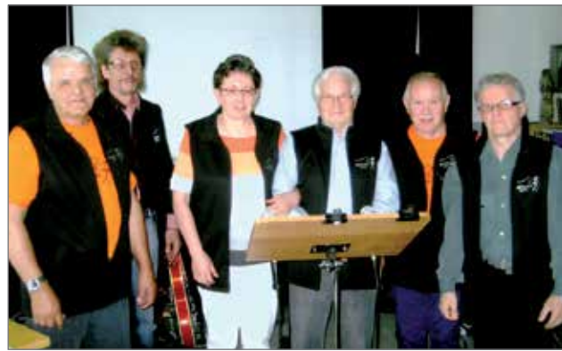
Suopunki-yhtye soitti reipasta ja viihdyttävää musiikkia.

Syöpäkerho toivoo lisää aktiivisia jäseniä nykyisten 210 jäsenen lisäksi sekä kiittää kaikkia tukijoita ja tilaisuuteen osallistujia toivottaen lämmintä kesää kaikille!