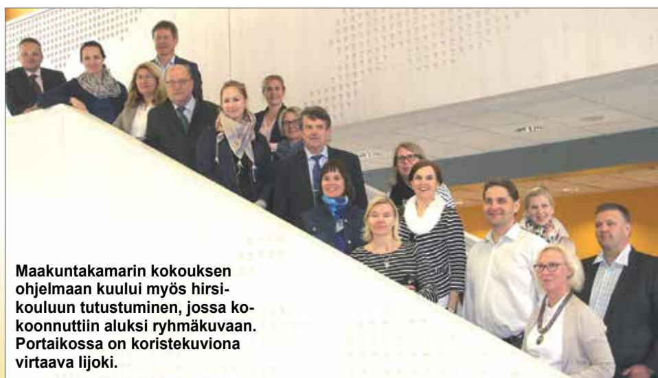
Maakuntakamarin kokouksen ohjelmaan kuului myös hirsikouluun tutustuminen, jossa koettiin aluksi ryhmäkuvaan. Portaikossa on koristekuviona virtaava liijoki.

-Maakuntakamarin kautta viesti vaihtuu päättäjien ja aluekehittäjien välillä erinomaisesti. Hirsikoulu teki kaikkiin upean vaikutuksen ja se kertoo myös siitä, miten Pudasjärveltä löytyy rohkeutta uusiin toimintamalleihin ja miten ne vaikuttavat kuntalaisten hyvinvointiin.