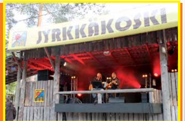
M & M Duo lämmittelemässä lauteita.