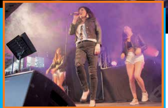
Millennium Party Show.

Lisäksi jokaisena huvi-iltana asiakkaita palvelee tunnelmallinen karaokepubi ja maan mahtavin kelodisco.