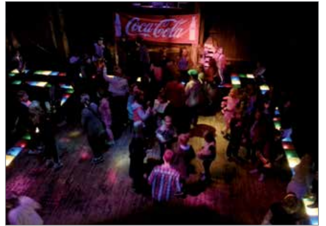
Jyrkkäkoscin diskossa valot välkyivät ja musiikki soi lapsille, jotka juhlistivat näin kesäloman alkamista.

Diskoiltana oli myös kioski auki ja kauppa kävi kiivaana. Karkit, limsat ja