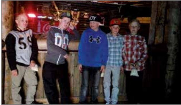
Pojatkin olivat diskoilemassa mielellään.

vin, sillä paikalle saapui 69 iloista lasta. Moni kertoi, että on odottanut tätä iltaa innolla ja valmistautuminen illan diskoon on aloitettu jo monta tuntia ennen h-hetkeä.