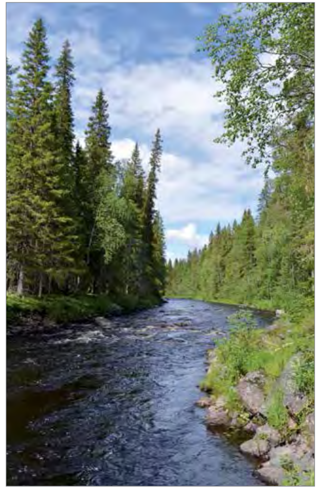
Korvua- Näljänkäjoen yhteislupa-alueella on kymmenittäin erilaisia koskiosuusia 110 km matkalla, joten kalastettavaa aluetta on runsaasti.