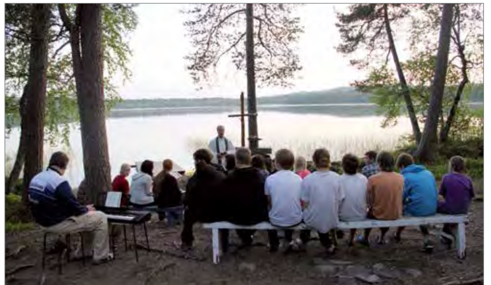
Keskiviikkona hiljentyttiin leirikirkossa.