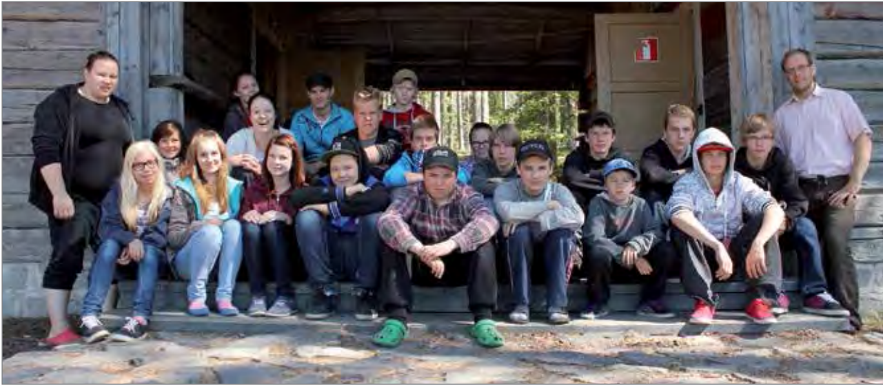
Koko leirin väki ryhmäkuvassa.