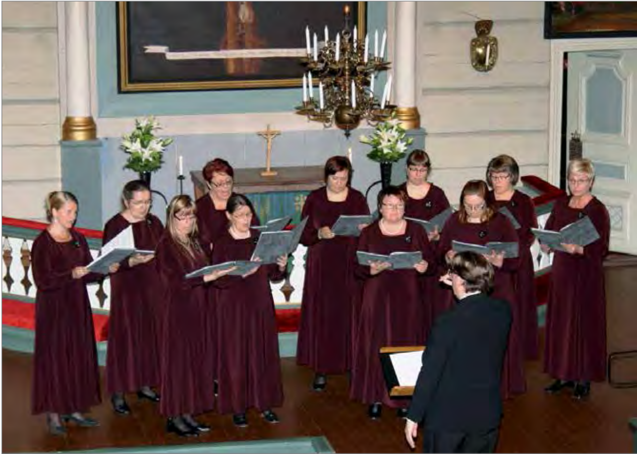
Vox Margarita kuoro on toiminut vuodesta 2003 ja esiintynyt usein Pudasjärvellä, viimeksi Pudasjärven kirkossa maanantaina 10.6.