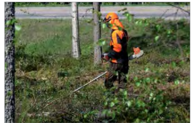
Raivaussahamies työssään Oulu-Kuusamontien varressa.

-Raivaussahoin tehtävällä taajamametsien hoidolla avarretaan ympäristön maisemia ja parannetaan ympäristön viihtyisyyttä. Lisäksi osassa isompaa puustoa kasvissa kohteissa tehdään niin sano-