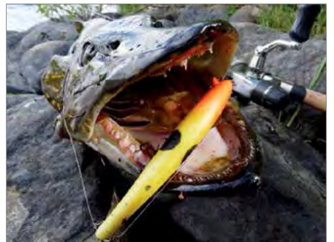
Tämän lijoesta saadun hauen pyytäjällä kalastusluvat ovat kunnossa ja Ahtikin oli suosittu.

Viehekalastusta harjoittava 18-64-vuotias tarvitsee kalastuksenhoitomaksun (valtion kalastuskortin) lisäksi joko vesialueen kalastus-oikeuden haltijan luvan tai hänen on suoritettava läänikohtainen viehekalastusmaksu. Se on maksullinen