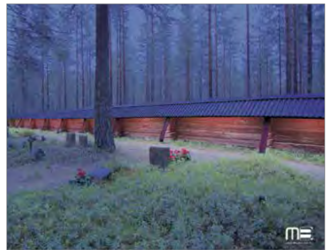
Pehmeä valaistus asennetaan aidan sisäpuolelle koko hautausmaan ympäri ja myös kävelyväylille laitetaan uudet valaisimet.