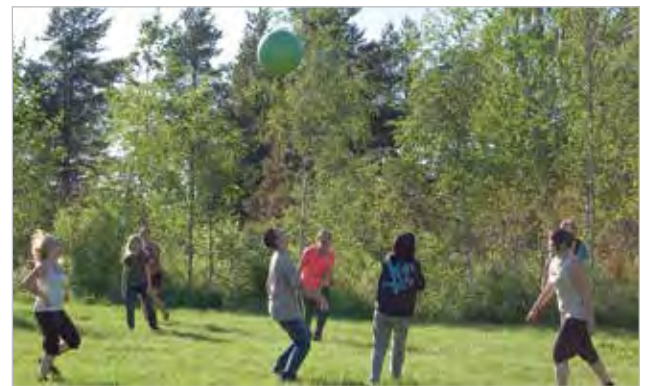
Norsupallon pelaaminen oli mukavaa opiskelujen välillä.