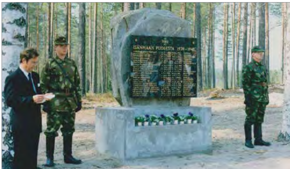
Jaurakkajärvellä on näyttävä muistomerkki.

Lisätietoja on kotisivuilla www.tammenlehva.fi