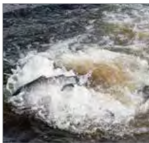
Istutettujen kirjolohien keskipaino oli noin 1,3 kiloa.

-Koskialueilla viihtyvät harjukset ja taimenet, nivoilla kirjolohet ja hitaammin virtaavilla alueilla hauet, ahvenet ja säyneet. Kesäkuun alussa istutettujen kirjolohien keskipaino oli noin 1,3 kg. -Jokialueella istutetaan