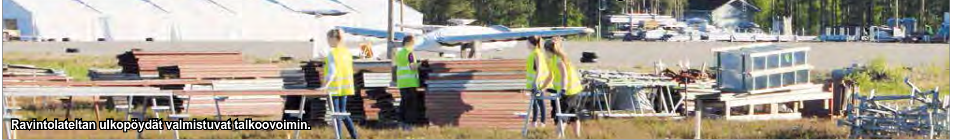
Ravintolateltan ulkopöydät valmistuvat talkoovoimin.