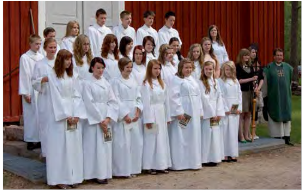
Kesärippikoulu päättyi konfirmaatioon Pudasjärven kirkossa sunnuntaina 9.6.