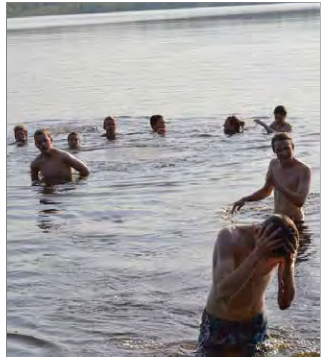
Uinti Kangasjärvessä kuului joka päivän ohjelmaan.