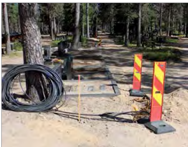
Sähköurakointi on aloitettu jo 6.5. hautausmaan valaistusta varten.

Liikennejärjestelyjen ja valaistuksen uusimistyöt Pudasjärven kirkonmäellä on aloitettu. Rakentamisesta vastaa Destia Oy, rakennesuunnittelusta FCG Suunnittelu ja Tekniikka Oy, sähkösuunnittelusta Sähkösuunnittelu ja -asennus, sekä sähkötoista Koillissäkö. Eri osapuolet kokoustuivat kirkonmäelle torstaina 6.6. työmaakokoukseen, jossa käytiin läpi valaistuksen rakentamisvaihe sekä