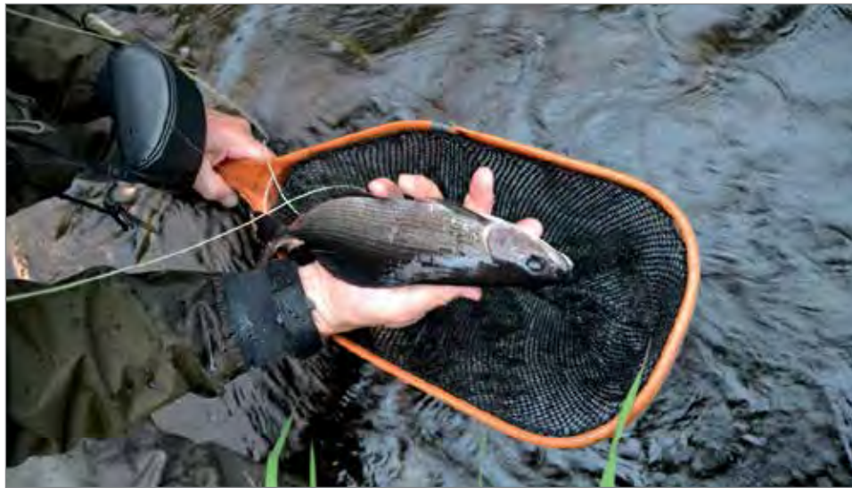
Keskeisin saaliskala alueella on harjus.

Joet on aikanaan perattu uitoon vuoksi, mutta ne on myöhemmin kunnostettu lohikalaille suotuisammiksi. Pääkohdekalana alueella on harjus, mutta paikoittain on mahdollisuudet myös taimeneen. Saaliskaloihin kuuluu myös hauki, ahven ja paikoin siika. Kalasto on pääosin peräisin luonnonkierrosta, sillä jokiin ei ole tehty istutuksia vuosin. Kalakannan elinvoimaisuuden turvaamiseksi säädettiin tiukemmat lupaehdot kuin istutuksilla hoidetuilla