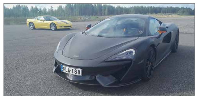
Viimekesän nopein, McLaren 4-veto. Kaikki lähdöt yli 300 km/tunnissa, nopein 306 km!

Näillä "No Speed Limit"-ajotapahtumilla halutaan testaajat valvottuihin olosuhteisiin kokeilemaan, eikä tarvitse normaali liikenteessä vaarantaa itseään ja muita liikenteessä liikkuja. Erittäin suosittua on tulla testaamaan moottoripyöriä, jos on lähdössä esimerkiksi kiertämään Eurooppaa lomalla, niin täällä voi kokeilla miten pyörä käyttäytyy sivulaukkujen kanssa, miten on pakattu, kuinka painavat laukut jne, eli sitä "optimaali" ajotuntuman hakua. Toiset sitten haluaa vaan kokeilla kulkeeko se oma auto kahta- vai kolmea sataa. Viime kesänä eräs kuski tuli paikalle vuoden -84 diisseli Mersulla. Naapuri oli kehunut "että tuo ruostekasa ei kule satastakaan". Hän ajeli kymmenkunta kertaa ja nopein veto taisi olla mai-