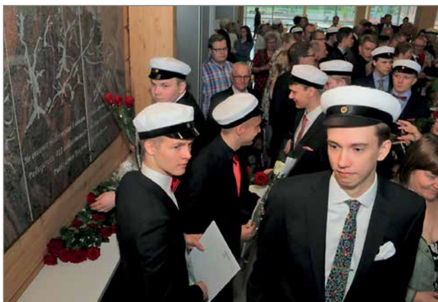
Yhteiskuvan jälkeen ylioppilaat luovuttivat yhden ruusun aulassa olevan sankarivainajien muistolaatan yhteyteen. Suuri osa ylioppilaista kävi myös vieraillessaan sankarivainajien muistomerkillä.