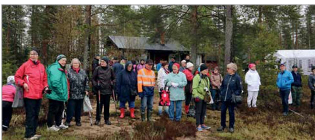
Väki kokoontui rannalle seuraamaan yli 100 metrin pituisen lahnaverkon nostamista.