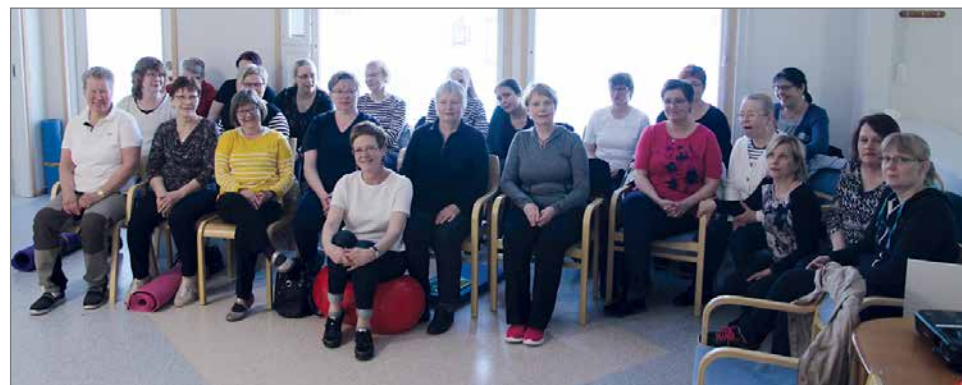
Iloiset kurssilaiset maltoivat pysähtyä ryhmäkuvaan.