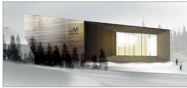
Rakenteilla olevasta Lumiareenasta Arkkitehtitoimisto Lukkaraisen toimittama havainnekuva.