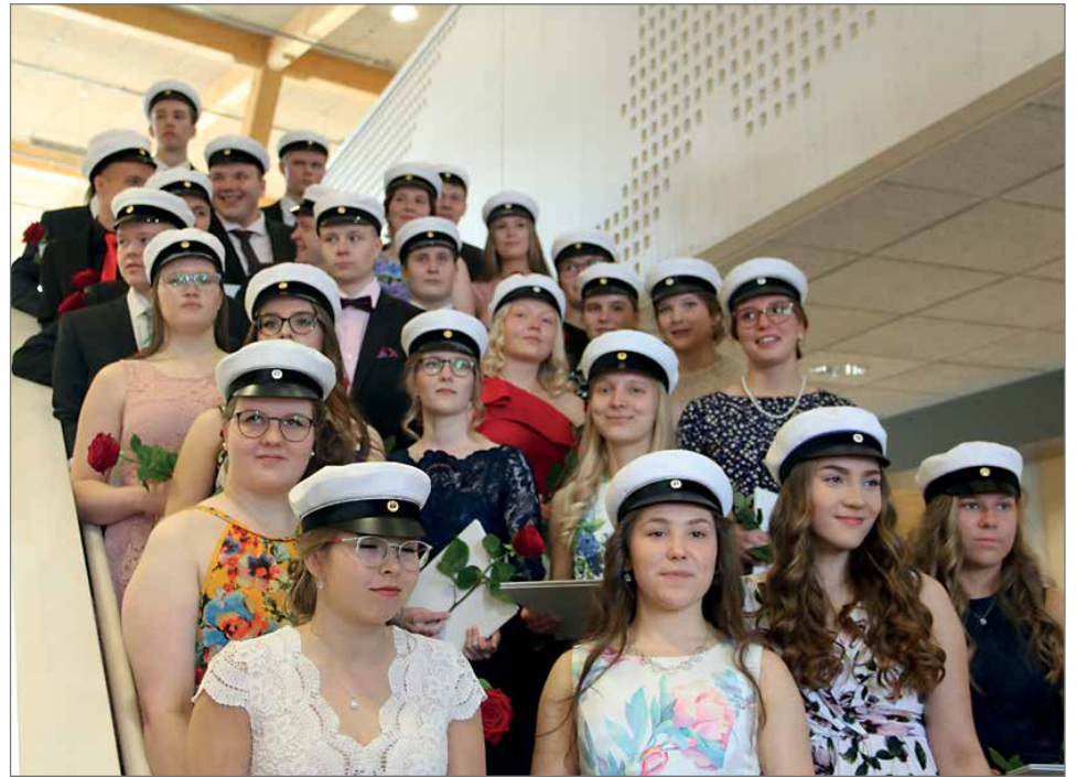
Vuoden 2019 ylioppilaat yhteisessä kuvassa Hirsikampuksen yläkerran portailla.

Pudasjärven lukion ylioppilajuhla oli lauantaina 1.6. kolmatta kertaa Hirsikampuksen juhlasalissa. Pudasjärven lukiosta sai valkolakin 27 uutta ylioppilasta.