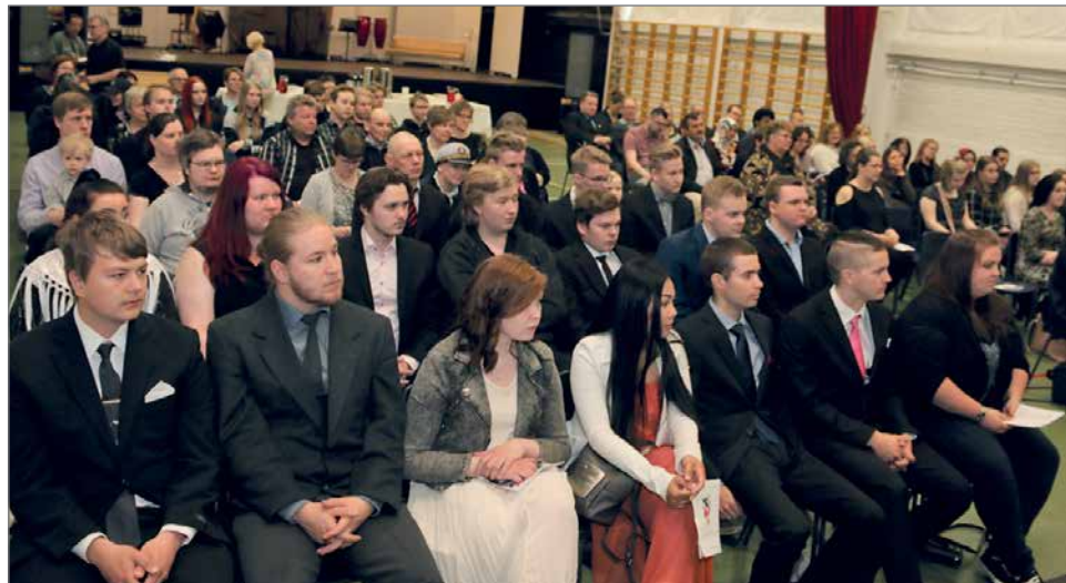
Pudasjärven yksiköstä todistukseen saajia oli 41. Kaikkiaan opiskelijoita on tällä hetkellä 155.