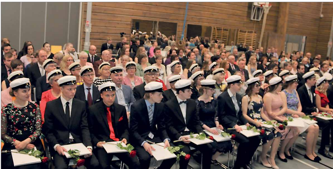
Hirsikampuksen juhlasali täyttyi jo kolmantena keväänä ylioppilaita ja juhlayleisöitä.