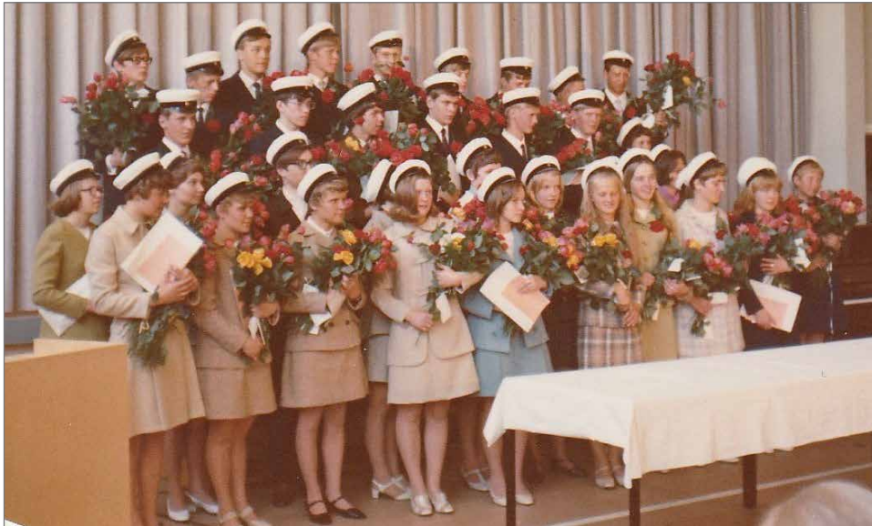
50 vuotta sitten ylioppilaiksi kirjoittaneet Pudasjärven yhteiskoulun juhlasalissa otetussa kuvassa.

pilaiden abimuisteloita on luvassa seuraavissa Pudasjärvi-lehdessä.