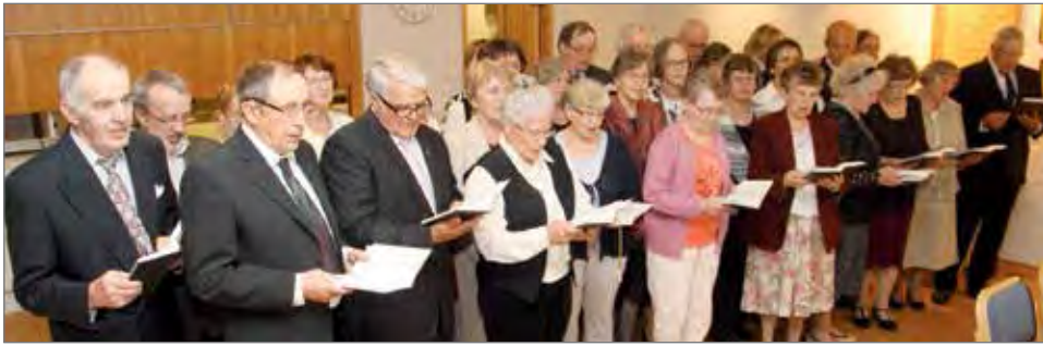
Virsikirjan merkkipäivälahjaksi saaneet saivat heti harjoitella, mitä on laulaa Suvivirttä uusista kirjoista.