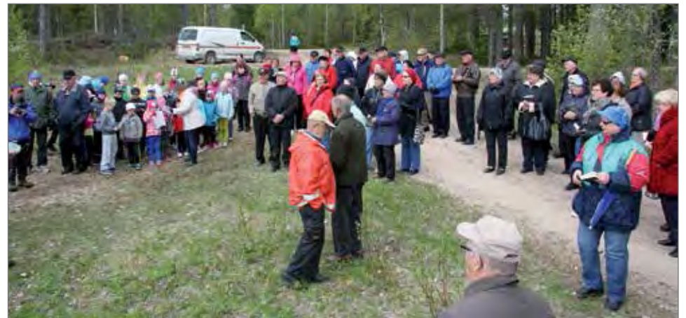
Kylvösiunauksen osallistui varsin runsaslukuinen yleisö. Mukana oli myös Eläkeläisten Pudasjärven yhdistyksen väkeä.

-Peukalo muistuttaa meitä rukoilemaan niiden puolesta jotka ovat lähinä; vanhemmat, sisarukset, puoliso, ystävät. Etusormi niiden puolesta, jotka opastavat, ohjaavat ja näyttävät meille tien; lähisukulaiset, enot, tädit, koulu, opettajat. Keskisormi viisautta johtajillemme; presidentille ja hallitusvaltaa pitävälle. Nimetön on sormi, jossa