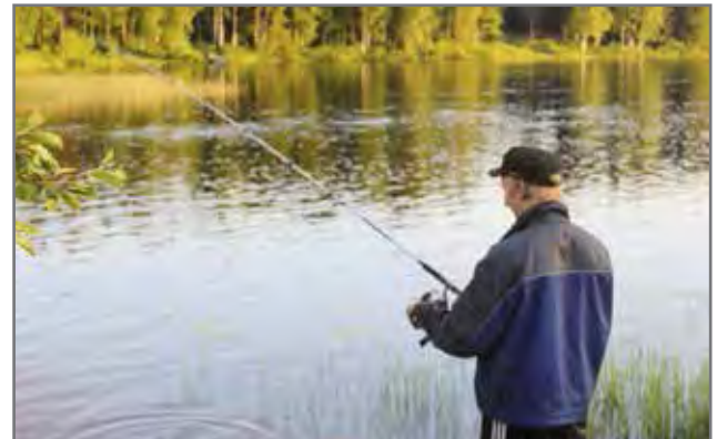
Korpjoen Hautapahtaalalla testataan lauantaina vapaka- lastajien hauen pyyntitaitoja.

Paukkerinharjulla Korpjoen Hautapahtaalalla järjestetään tulevana lauantai-iltana 7.6. perinteeksi muodostuneet hauen vapakalastuskisat. Tapahtumaan osallistujat kokoontuvat Hautapahtaan taukopaikalle, joka sijaitsee Korpjoen ylittävän maan- tiesillä alapuolella. Kalas- tuksen ohella tarjolla on li- säksi ruokaa. Kalastaa saa mielensä mukaan vapavä- linein rannalta tai veneestä. Olosuhteet hauen narrauk- seen Korpjoella ovat hyvät, koska pahin tulva on jo las- kenut ja haukia on jo saatu uistimella. Vielä viime vii- kolla vedenkorkeus oli noin parikymmentä senttiä nor- maalia kesävedenkorkeut- ta ylempänä. Isojakin haukia