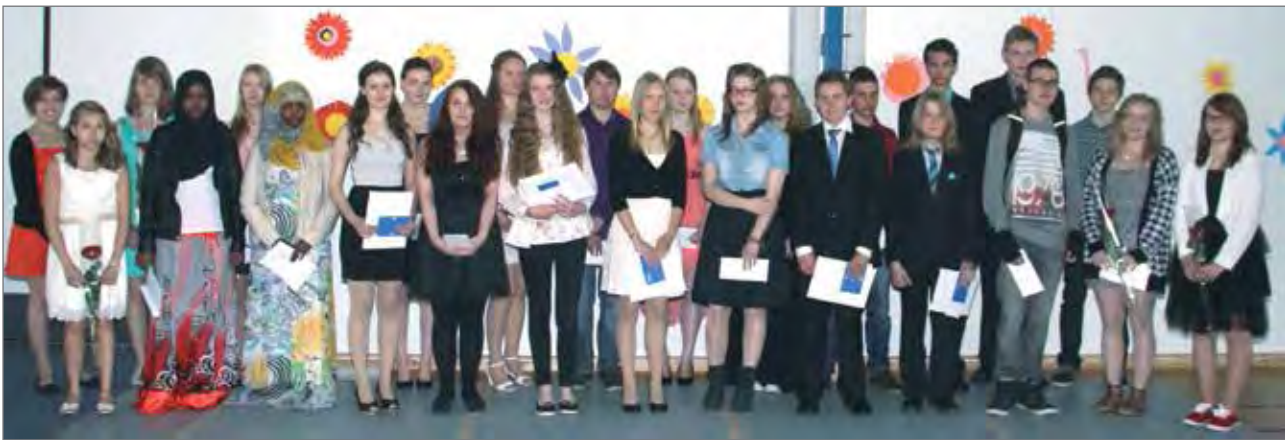
Stipendien saajat yhteisessä kuvassa