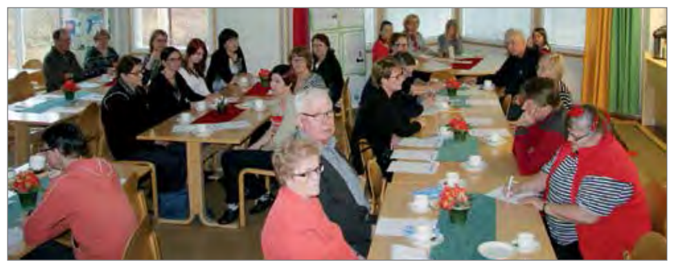
Palvelukeskuksen keskusteluiltaan keliakiasta oli saapunut lukuisa joukko asiasta kiinnostuneita.

Kun ihmiset ovat yhdessä, usein syödään jotain. Keliakikolle tämä merkitsee jatkuvaa näkyvyyttä ja esilläoloa. Jo pienempi määrä gluteenia on keliakikolle vahingollinen, minkä vuoksi hän tarkastelee ja varmistelelee yksityiskohtia ruokailutilanteissa. Samalla hän saattaa hämmästyttää, tai jopa ärsyttää, muita. On henkisesti haastavaa, että syödäkseen turvallisesti keliakikko joutuu käyttäytymään tavoilla, joka voidaan tulkita epäkohteliaisuudeksi. Keliakik-