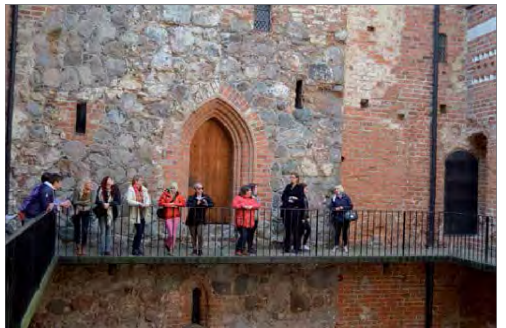
Hämeen linnassa kuultiin muun muassa linnassa asuneiden elintavoista.