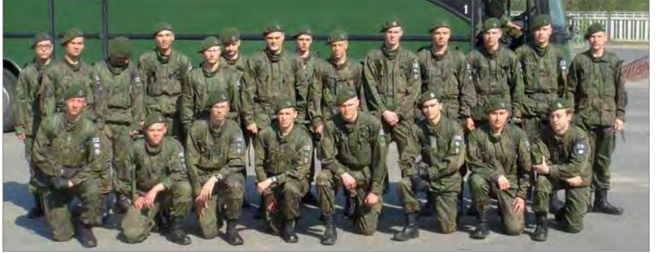
Kerääjinä toimivat Sodankylän jääkäriprikaatin sissikomppanian varusmiehet.

likoita, mutta olihan siellä myös setelirahaa mukana. Tuotto käytetään kokonaisuudessaan veteraanien, so- tainvalidien ja heidän puo-