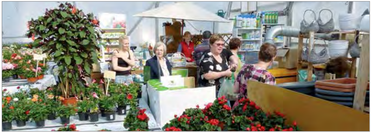
Pudasjärven Puutarha Kukkahuoneella vietettiin perjantaista sunnuntaihin perinteisiä alkukesän puutarhapäiviä.

-Hyötykasvien suosio näkyy myös siinä, että Pu-