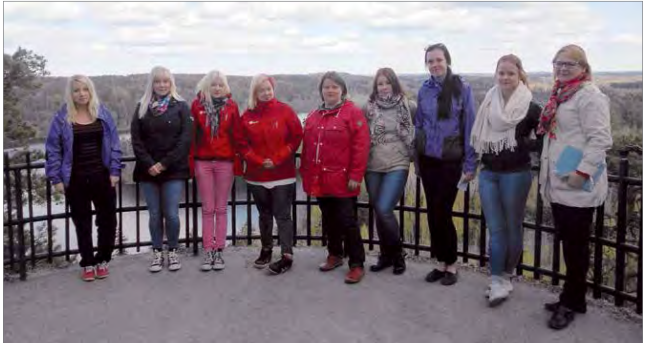
Matkailulinjan opiskelijat Aulangon näköalatasanteella.

Joka päivä Tavastian opiskelijat olivat kehittäneet meille paljon mukavaa tekemistä. Tutustuimme muun muassa paikalliseen historiaan, ympäristöön, kaupunkiin ja nähtävyyksiin. Esimerkiksi pääsimme opastetulle kierrokselle Hämeenlinnaan, jossa opas kertoi meille linnan historiasta sekä historiallisista sen ajan elintavoista. Saimme myös käydä linnan vanhassa tykkitorissa. Pääsimme myös kokeilemaan mm. golfausta ja keilausta. Ruokailut oli-