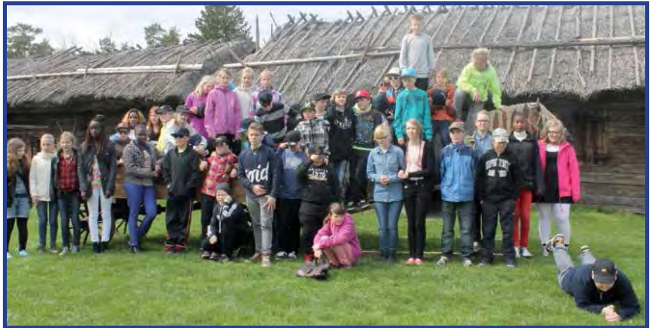
Ryhmäkuva Kastelholman linnan museoalueen pihalta.

Iltapäivällä lähdimme linja-autolla kohti Maxinge-kauppakeskusta. Huo-