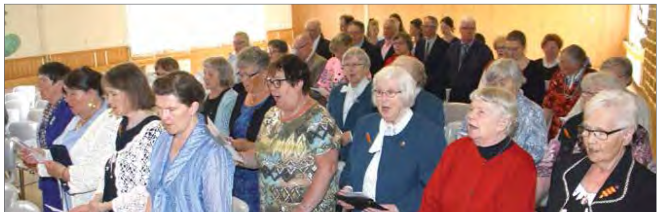
Juhlaan osallistui reilut 50 henkeä. Päätöslauluna laulettiin Kymmenen virran maa.