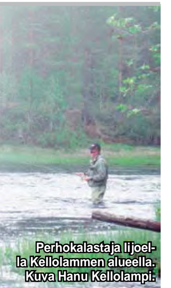
Perhokalastaja Ijoella Kellolammen alueella.

Esimerkkeinä alueen kalastussäännöistä kalastajien kannattaa muistaa, että taimenen alamitta on 60 senttimetriä ja harjuksen 35 cm. Vieheeseen tarttunut merilohi on vapautettava! Saaliskiintiöiden osalta vuorokaudessa kalastaja saa ottaa saaliiksi kaksi taimenta ja viisi harjusta. Lupa-alueella kalastuskausi on 1.6. - 31.10. siltä, että taimenen kalastus on kielletty 11.9 - 31.10. PK