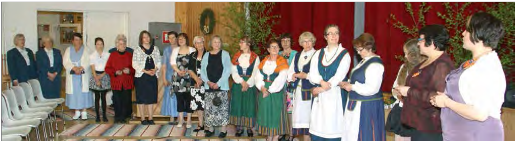
Jäseniä muistettiin jalkahoitolahjakortilla.