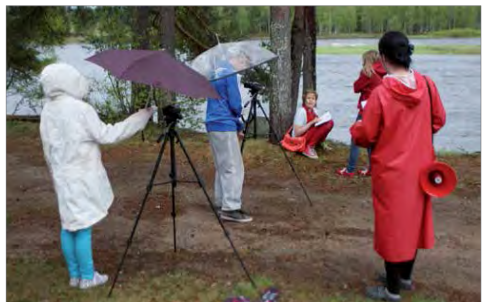
Leirillä oli nuorista koostuva kuvausporukka, jossa oli useampi kameramies, ääni- miehet ja kuvaussihteeri sekä apulaisohjaaja.