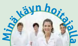
Juttusarjassa esitellään Pudasjärven vastaanoton hoitajia.