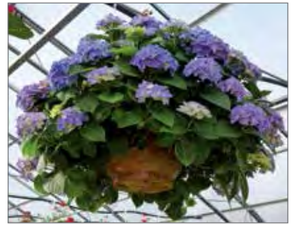
Isokokoinen hortensia-amppele on näyttävä ja kaunis.