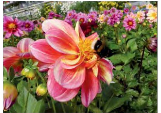
Kimalainen puutarhassa, hänkin ahkeroi.

Sitruuna-ajuruoho eli sitruunatimjami sopii mausteena erityiset vihannes-, liha ja kala-ruokiin, sitä voi käyttää myös salaateissa. Se sopii myös pitkään kypsytettäviin ruokiin.