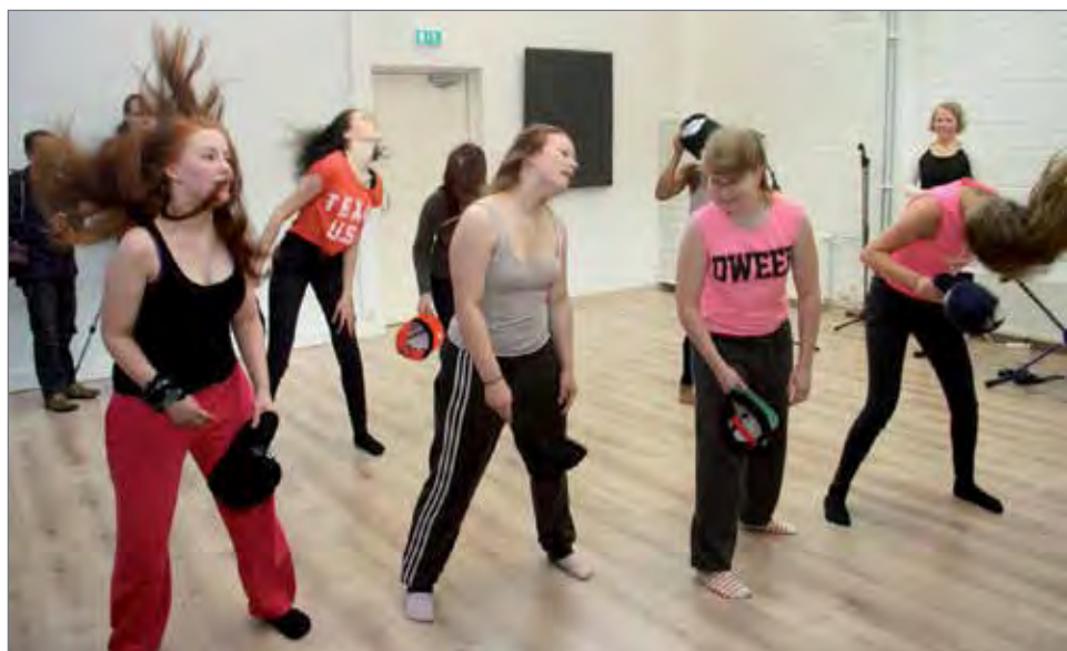
Nuorten katutanssiryhmällä oli näyttävä tanssiesitys.