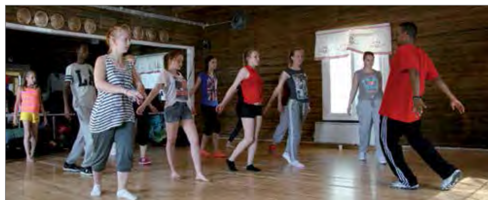
Leirillä tanssittiin katutanssia ja tehtiin siihen myös koreografia.

kisoista poiketen tänä vuon- na palkintoina ovat mitalit. Tapahtuman järjestävät yh- teistyössä Jongun osakas- kunta ja kyläyhdistys. PK