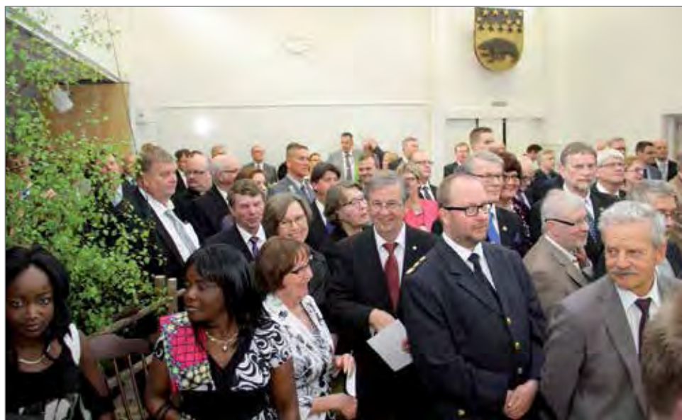
Valtuustosalin täytti kutsuvieraita niin läheltä kuin kauempaakin.