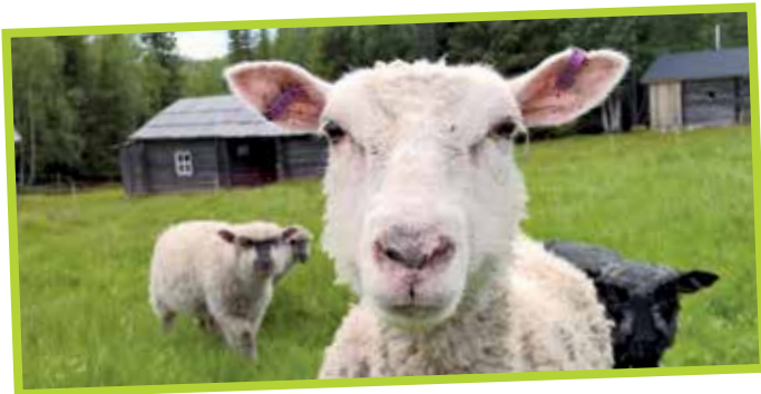
Rytituvalla on kesällä lampaita ja lammaspaimen, joita voi käydä katsomassa/tervehtimässä.