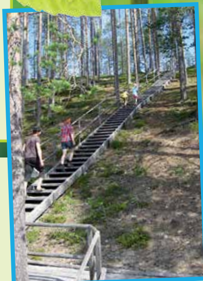
Soiperoinen on harjumaisemissa oleva lepposa pistäytymiskohde

Syötteen luontokeskus, Erätie 1, 93280 SYÖTE, syote@metsa.fi , puh. 0206 39 6550