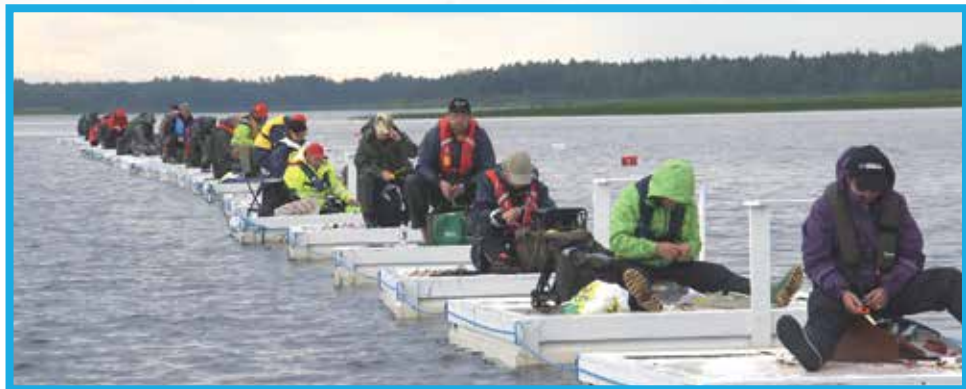
Pudasjärven Urheilijoiden perinteinen kesäponnistus, Kesäpilkin MM-kilpailut Havulan rannassa keräsi noin 200 kilpailijaa.