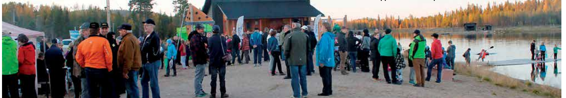
Luppuveden rannalle kokoontuu jälleen satoja ihmisiä Luppuvesi Palaa -tapahtumaan.

jota saa ihastella suuren kokon loimutessa. Tapahtuma on näyttävä lopetus Huippuviikonloppulle!