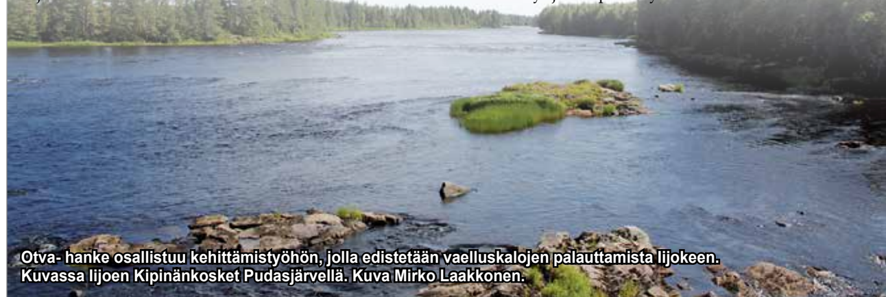
Otva-hanke osallistuu kehittämistyöhön, jolla edistetään vaelluskalojen palauttamista Ijokeen. Kuvassa Ijoen Kipinänkosket Pudasjärvellä.