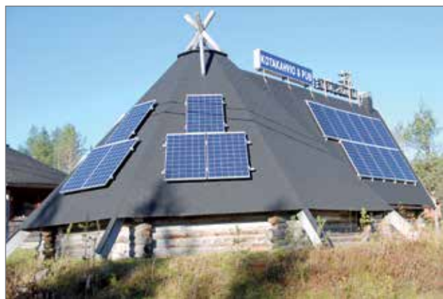
Kotakahvion katolla sijaitsevat aurinkopaneelit ovat tuottaneet sähköä hyvin.

Lomalaisilla on käytössänsäntuveneet, nuotiopaikat, ulkosaunat ja uimaranat. Eräilystä ja vaelluksista pitävät voivat hyödyntää lähitöillä olevaa Kupson Kutsun luontopolkua ja UKK-reittiä. Juhannuksen aikana kaikki mökit ovat varattuja, mutta muulloin saattaa löytyä vapaita aikoja. Varaus tilanteen näkee nettimokki.com -sivustolla. Lisätietoja löytyy netistä Eskolan Lomamajat Rent a Cottage.