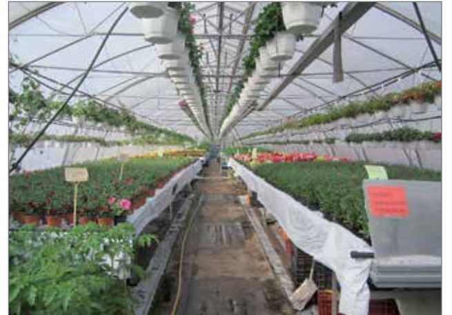
Kasvihuoneissa on aloitettu puutarhatyöt maaliskuulla siementen kylvämisellä ja taimien istuttamisella. Sen jälkeen tarhalla on riittänyt työtä ja touhua.