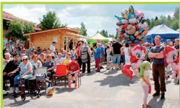
Vuoden 2016 markkinatunnelmaa. Vasemmalla yrittäjien arpajaisien päävoitto Timpan Kurkihirren kesäkeittiö.

Markkinapaikka Pudasjärven tori on käynyt viime vuosina ahtaaksi ja kaikille halukkaille markkinamyymälle ei ole enää loppuvaiheessa riittänyt myyntipaikkoja. Nyt siihen tulee huomattava parannus, sillä markkina-alue laajenee torin viereiselle ns. Hartsun tontille, josta viime syksynä purettiin entinen liikekiinteistö. Alueiden keskelle jäävä Puistotie suljetaan osittain liikenteeltä.