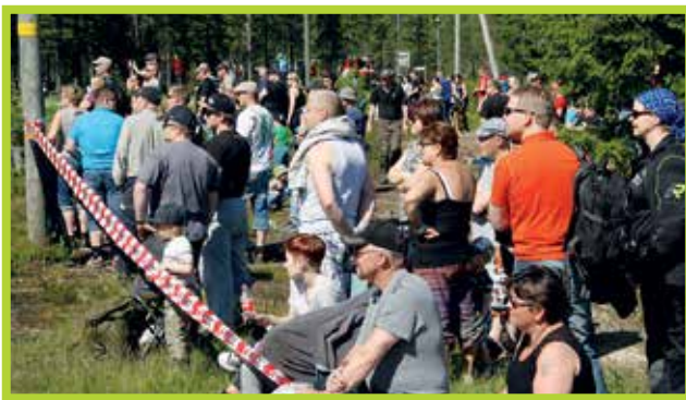
Kisajärjestäjät toivovat kaunista juhannussäästä, joka myös vaikuttaa yleisön määrään.

Rata on haastava, sillä 2,3 kilometrin matkalla ylämä-