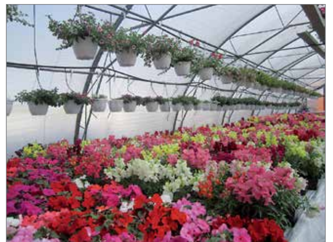
Puutarhan kuusi laajaa kasvihuonetta suorastaan pursuu kesäkukkien kukkaloistoa eriväreissään ja malleissaan.