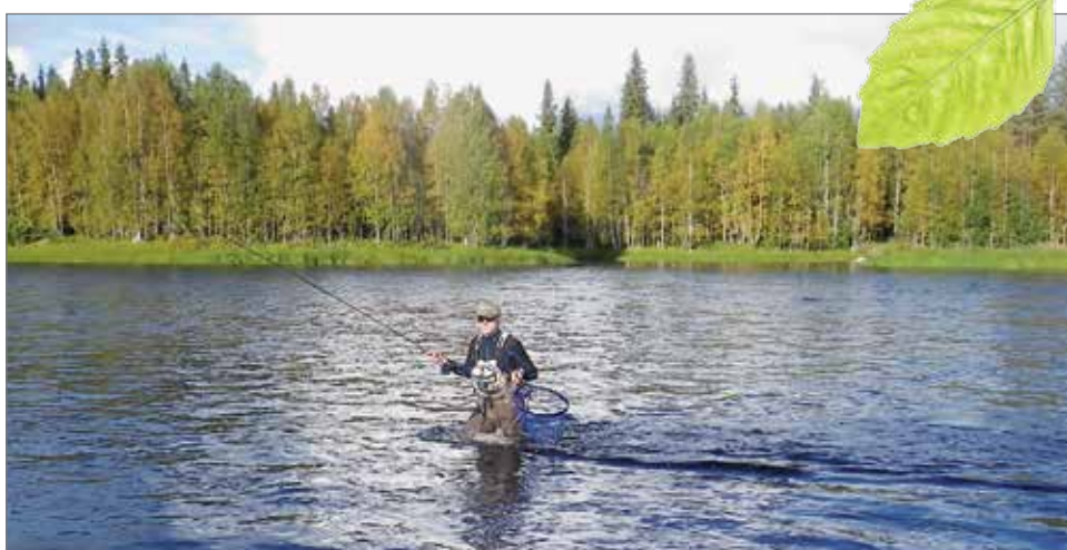
Ijoen keskijuoksulla joen leveys vaihtelee 50-100 metriin. Kuva Koivukarilta (Kellolammen alue) Ijoen perhokalastuksen Sm-kisoista elokuussa 2015. Kuva Mika Niskasaari

Joen kalakantaa hoidetaan taimenen ja harjuksen poikasistutuksin. Yhteislupa-alueella on kolme rauhoitusalueita. Jo useana kesänä Ijokeen on ylisiirretty joen alajuoksulta jokeen merestä nousevia oikeita kookkaita lohia ja toimintaa jatketaan edelleen. Mikäli lohi nappaa vahingossa kalastajan vieheeseen, se on kalastussäännön mukaisesti vapautettava elävänä takaisin jokeen. Lupa-alueella harjuksen ala-