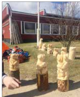
Veistokurssilaisen hienoja tuotoksia

Liokas on korjannut seurojentaloa, Ruostehoviä, ja remppa jatkuu vielä tänäkin kesänä Kotiseutuliitolta saadun avustuksen turvin. Heinäkuun puolivälissä siellä pidetään Illikaisen suvun sukujuhlan kunniaksi kesätanssit, jonne ovat kaik-