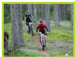
Myös yleisö on tervetullut seuraamaan maastopyörätapahtumaa.

Syötteen kansallispuiston upeissa maisemissa lauantaina 5.8. ajettava Syöte MTB on monien mielestä Suomen paras maastopyöräily-tapahtuma. Tapahtuma to-