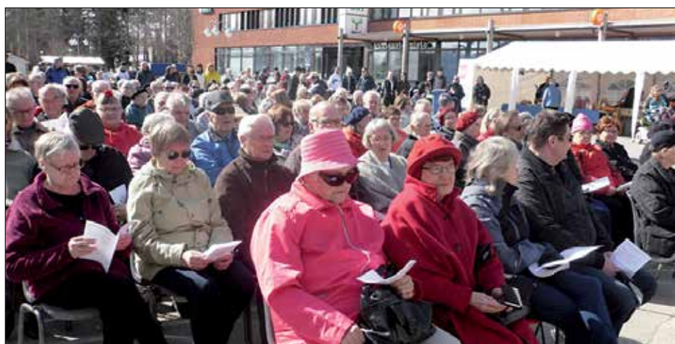
Helatorstaina järjestetty kaiken kansan torimessu toteutettiin seurakuntatyön kehittämisen hengessä ja koettiin yhdessä tekemisen ja onnistumisen iloa.

KirTEKO 2017 –kilpailun kunniamaininta on osoitettu koko Pudasjärven seura-