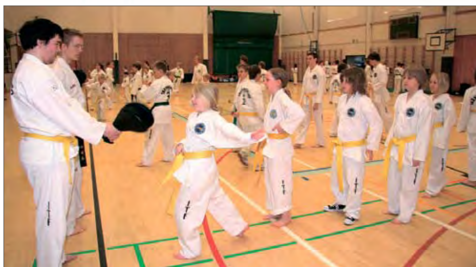
Lyöntiharjoituksia tehtiin kukin vuorollaan