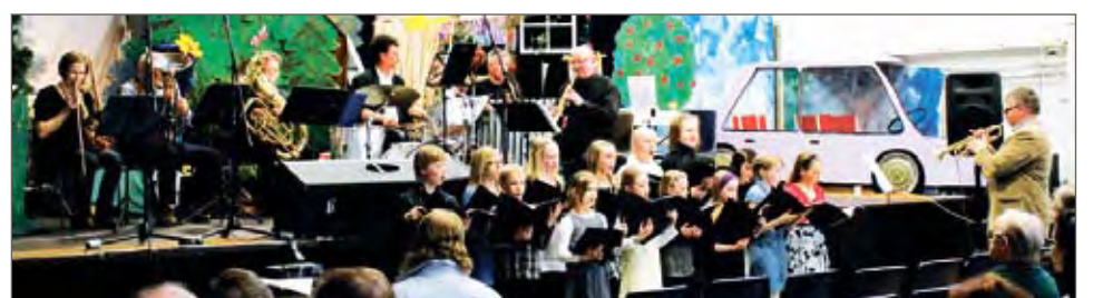
Puhallinorkesteri esitti Veteraanin iltahuudon yhdessä Lakarin koulun lapsikuoron kanssa.