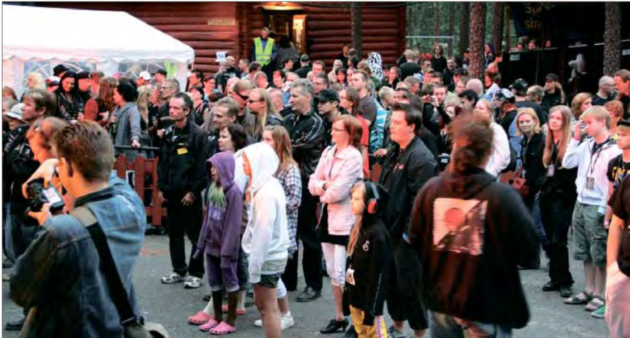
Jyrkkä Rock 2012 on jo kolmas kerta, kun rock musiikista pitävä väki saapuu Jyrkkäkioskelle. Osallistujamäärä on noussut joka vuosi ja nousua odotetaan myös tänä vuonna.

Perinteistä kaavaa ei ole lähdetty rikkomaan, vaan musiikkilaji tulee olemaan rankempaan suuntaan kallellaan tänäkin vuonna. Ja näin