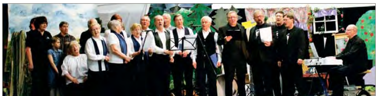
Lopuksi kaikki paikalle jääneet esiintyjät esiintyivät vielä yhdessä.