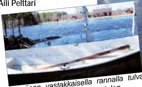
Korpjoen vastakkaisella rannalla tulva lähestyi uhkaavasti Savikon taloa.