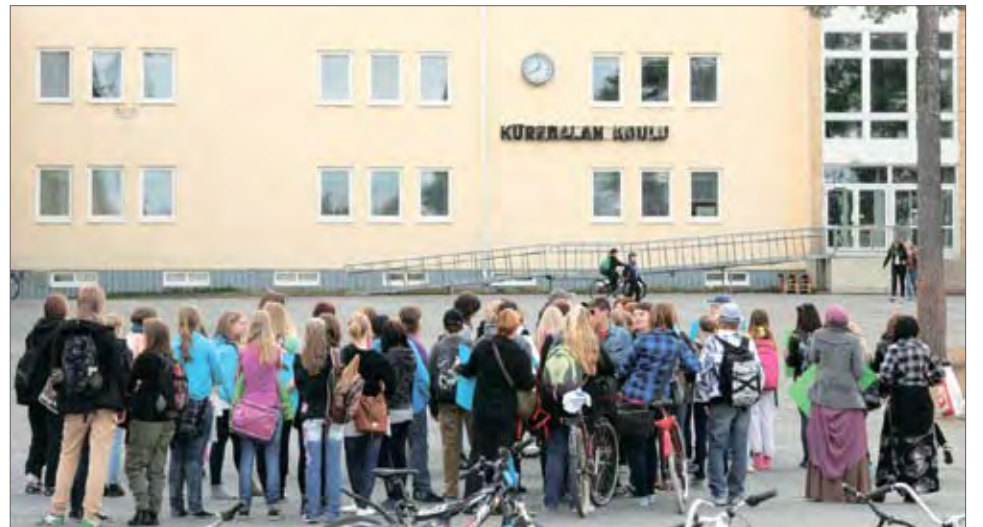
Kurenalan koulun kohdalla pysähdyttiin ja heräteltiin huomiota.

Mielenosoituksen yhtenä tarkoituksena oli saada tiedotusvälineiden kautta huomiota Rimminkankaan kou-