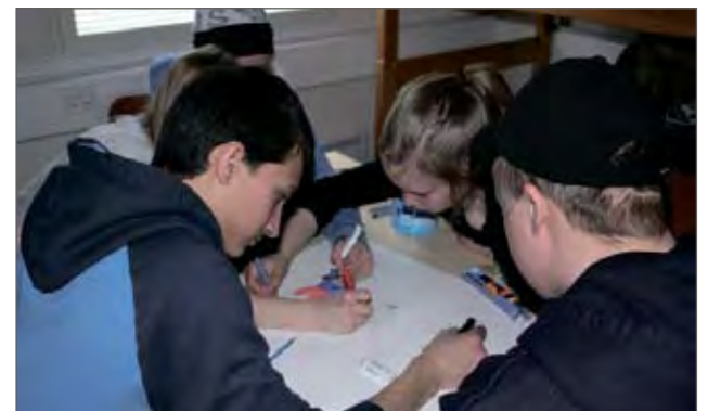
Juliste päihteettömyyden puolesta hahmottumassa.