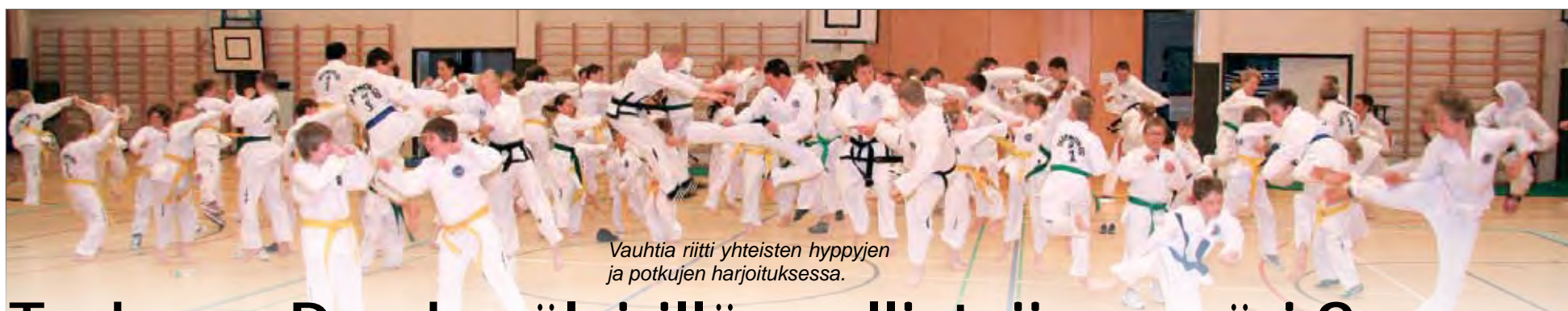
Vauhtia riitti yhteisten hyppyjen ja potkujen harjoituksessa.