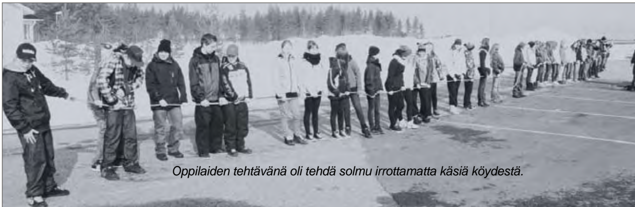
Oppilaiden tehtävänä oli tehdä solmu irrottamatta käsiä köydestä.