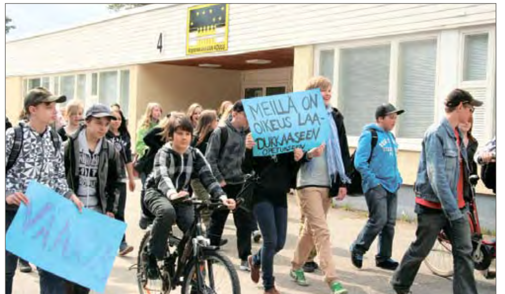
Rimmin pihalta lähdettiin marssimaan suurella joukolla kohti Pudasjärven keskustaa, jossa toivottiin päättäjien tapaamista.