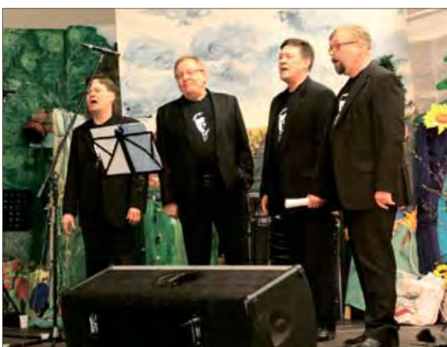
Laulukvartetti HJAM konsertoi Sota-ajan lauluja -tapahtuman yhteydessä.