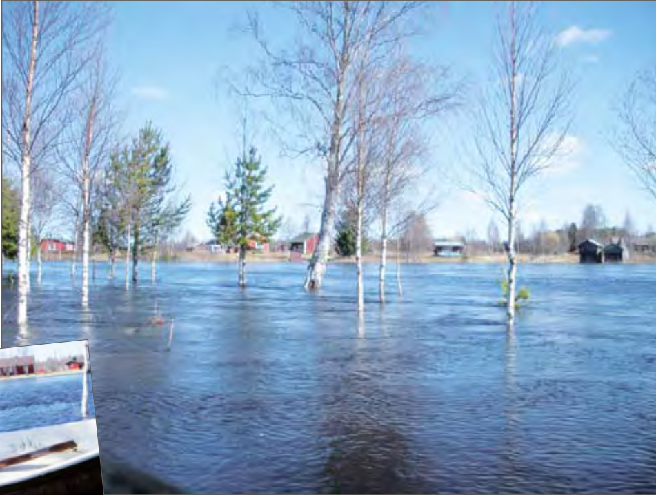
Pelttarinkylä on tulvan saartamana, joten vene oli ainoa kelvollinen kulkuväline.

Tulva oli tänä keväänä korkeimmillaan sitten vuoden 1989 suurtulvan. Pelttarin harjun talot jäivät Jongun kylällä Korpjoen tulvaveden saartamaksi usean päivän ajaksi. Kauppa- ja postiautolta sekä tietyistä asukkaista katkesi kulkuyhteys kylälle. Mutta vesi- ja rantalintujen touhuja oli mukava seurata. Kiikari ja lintukirja olivat tarpeen outojen siivekkäiden tunnistamiseksi: onkohan tuo jääkuikka vai isokoskelo?