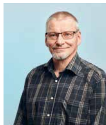
Pudasjärvi (etelä ja Sarakylä)