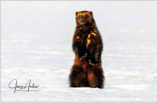
Ahman kuva on otettu itärajan tuntumassa.

Tässä toukokuun tuoreilla hangilla hiihtelee onnellinen mies! Lintu- ja luontokuvauksinnostuksen myötä on luonto alkanut kiinnostaa taas uudella tavalla. Loppumatomat hiihtovaellukset, puoduttavat merimelontaretket, hikiset vuoristovaellukset ja näännyttävät patikointiretket ovat saaneet uutta sisältöä lintuharrastuksesta ja luontokuvauksesta. Kun aiemmin sisältöä retkelle toivat vuoren takana odottava uusi terävämpi huippu, niemen takana odottava saari hiekkarantoinen tai metsän takana siintävä autiotupa ja siellä lämmin ateria, nyt matkaa sulostuttavat tunturin päällä lentävä pulmusparvi, sammalikossa ryömivä kovakuoriainen, suden ulvonta tai erämaalamassa sukkelteleva kaakkuri. Riistotalouden myötä katoavasta luonnosta löytyy edelleen pieniä ja suuria elämyksiä!