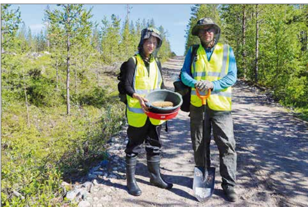
Näytteen keruu tehdään päiväsaikaan. Yhtiön geologit liikkuvat alueella aina merkityillä ajoneuvoilla ja heidät tunnistaa huomioliiveistä, joissa on yhtiön tunnus.