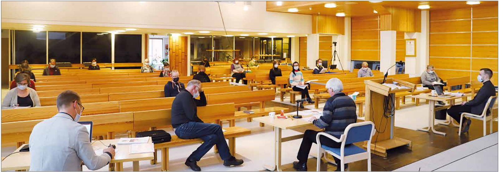
Kirkkovaltuuston kokous pidettiin seurakuntasalissa turvavälit huomioiden.