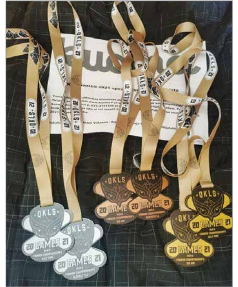
Iiläisen Aallon poikien Ronin, Roomeon ja Reneen SM-mitalit.