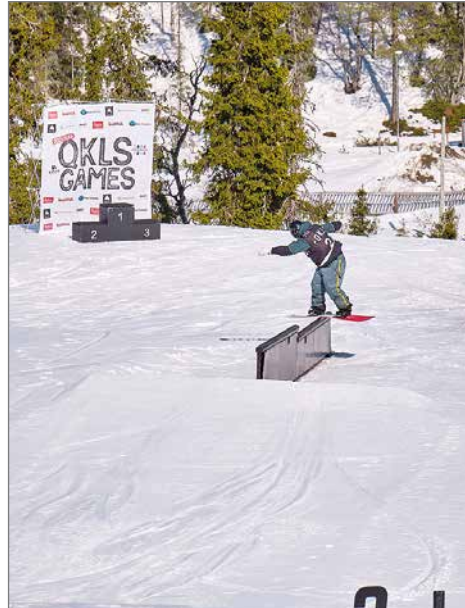
Roomeo Aalto Slopestyle.