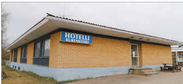
Hotelli Kurenkosken 13 huonetta ovat saamassa uutta ilmettä nuorten voimin.

Hotelli-Ravintola Kurenkosken hotellihuoneissa on tapahtumassa uudistusta. Pohjois-Pohjanmaan InnovaatioELY:n ja Tamora Oy:n 18 nuorta Oulusta muotoilee kuusi huonetta elokuvateemaan. Luvassa on mm. Tarantino-huone ja Leningrad Cowboys-huone. Ne muotoillaan ja tulevat käyttöön jo kevään aikana. Heinäkuun ajan jatketaan sitten täysillä kokeilujen kesässä.