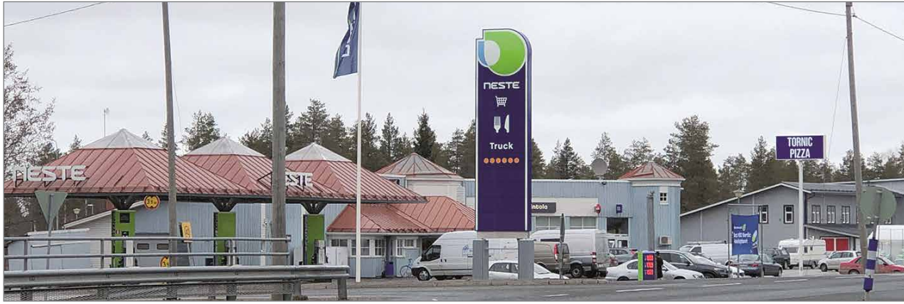
Lähiaikoina Kotipizzan tilalle avataan Tornic Pizza.