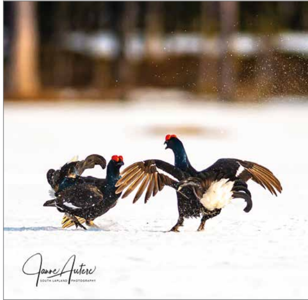
Teeret soitimella kuvattu Posiolla.

vauskojussa istuessani olen oppinut kamera- ja kuvaustekniikkaa. Kukaan ei koskaan suoraan neuvonut, miten saat hyvän luontokuvan. Minua kehoitettiin kokeilemaan kameran asetuksia, kuvaamaan erilaisissa valoissa eri vuorokaudenaikoihin ja uskomaan siihen mikä loppujen lopuksi omaan silmäni näyttää hyvältä. Myös muiden kuvia katsellessa oppii ja saattaa löytää oman tyylin. Kuusamo Opiston kursseilla olen tutustunut aloitteleviin luontokuvaajiin, pitkän linjan harrastajiin ja arvostettuihin ammattikuvaaajiin, joiden näkemys luonnosta ja sen moniulotteisesta kosketuspinnasta meihin ihmisiin on alkanut pikkuhiljaa avautua. Yksinäinen luontokuvauskin on tiimityötä.