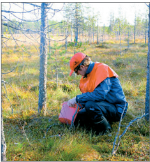
Syksyisin marjastus vie Paloniemet muun muassa hilla-soille.