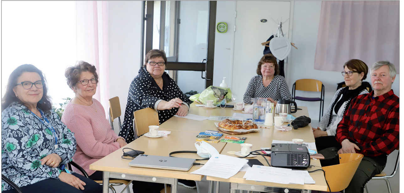
Kokoomuksen vuosikokouksessa oli esillä kuntavaaliasiat sekä saatiin hallitukseen uusia jäseniä.

myös Kokoomuksen kuntavaaliohjelma, jossa päätököt ovat