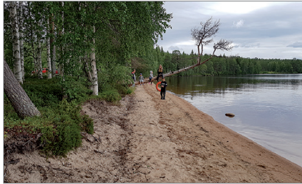
Puhoksen Kyläseuran väki kutsuu vieraita tutustumaan pitkään Marjonhiedan hiekkarantaan.