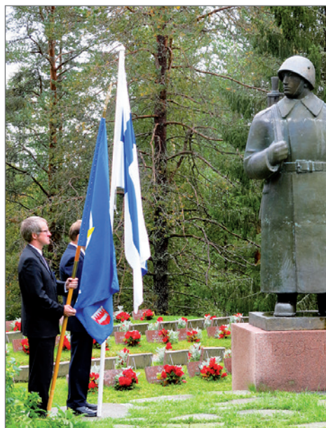
Reserviläisissä käydään sankarimuistomerkillä useamman kerran vuodessa.