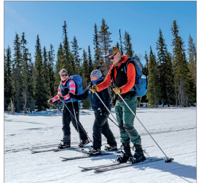
Syötteen luonnossa voi liikkua muun muassa liukulumikengillä.

Minun itse on nyt vaikea päästää irti talvesta. Sain nauttia kunnan talvesta täällä pohjoisemmassa ja nautin siitä täysin siemauksen. Uskon kyllä, että tässä säiden lämmitessä minun-