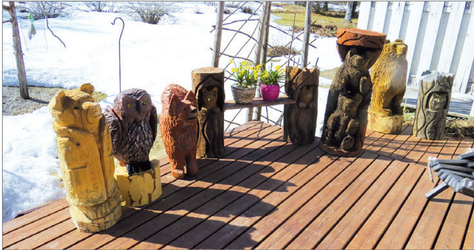
Puunveistotöihin Tuovila sai kipinän vuonna 2013 Livolla järjestetyllä karhunveistoviikolla.