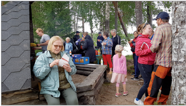
Marjonhiedan avajaisia vietettiin viime vuoden heinäkuussa. Avajaispäivän kävijämäärä yllätti myönteisesti kyläseuran.