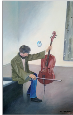
Monipuoliseen taiteen harrastamiseen kuuluu myös taulujen maalaus.