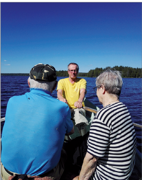
Kuusamon Haatajan Pitkäsaassa on ollut noin 50 vuotta kesähuvi, jonne kuvassa menomatalla.