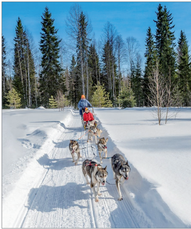
Syötteen Eräpalvelujen koiravaljakkoajelu on kokeilun arvoinen elämys.