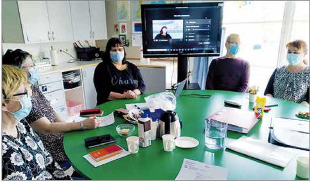
JHL:n ensimmäinen ns. hybridikokous, jossa osa jäsenistä osallistui kokoukseen etänä ja osa kokouspaikalla.