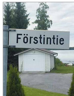
Ohikulkevan tien viitta.