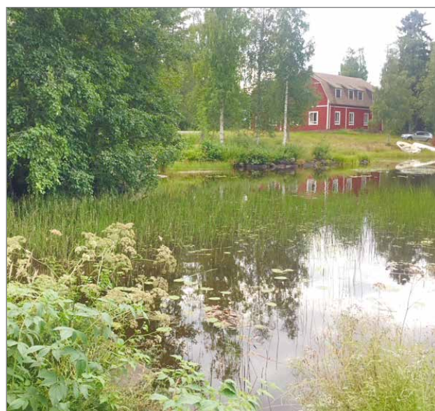
Purmojärven nuorisoseuran talo, rakennettu noin 100 v. sitten. Yläkerrassa on näytelmäteatterin tilat, alakerrassa ravintola ja tanssisali. Uusi nuorisoseuran talo sijaitsee noin viiden kilometrin päässä saman järven rannalla.