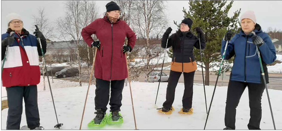
Kukkula on valloitettu. Ryhmäläiset kokeilemassa lumikenkäilyä.

Ryhmän ohjaajana on fysioterapeutti Katri Virtanen FysioKV:sta. Hän on tehnyt kaikille yksilöllisen alkukartoituksen ja antaa ryhmäläisille ohjausta siihen, mikä olisi hyvä seuraava askel ryhmän päätyttyä ja mitkä toimet jatkossakin tuke-