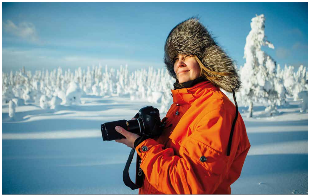
Järjen äänellä kampanjaan liittyvä valokuva.

Järjen äärellä -kampanja toteutettiin kolmiosaisena kahden vuoden aikana ja sen kokonaisbudjetti oli 58 800 euroa. Kampanja tehtiin yhteistyössä kaupunki, Pudasjärven Kehitys Oy ja Syötteen matkailuyhdistys ry., joiden kesken myös kustannukset jaettiin. Kampanjaa luotsasi Viestintätoimisto NTRNZ Oy, joka valittiin tehtävään Pudasjärven Kehitys Oy:n kanssa solmitun kilpailutetun puitesopimuksen kautta. Kam-