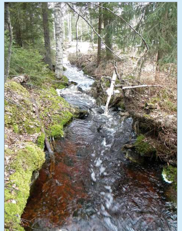
Saukko viihtyy pienissäkin vesistöissä, mikäli niistä vain löytyy tarpeeksi kalaa.

Saukon poikasiin saattaa törmätä mihin aikaan vuodesta vain, sillä se voi lisääntyä talvellakin. Useimmiten kuitenkin suvunjatkaminen tapahtuu kesäaikaan. Saukko tekee uuden poikueen vain joka toinen tai kolmas vuosi. Emolta menee vuosi opettaessa poikasia