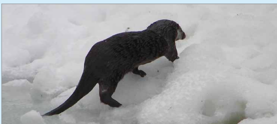
Saukko on taitava uija ja se on yleensä sukelluksissa noin 1-2 minuuttia. Harvoin sukellukset kestävät kuitenkaan yli viisi minuuttia.

Ruotsissa saukkoja arveltiin olevan joitakin vuosikymmeniä sitten vain reilusti alle tuhat yksilöä. Ruotsalaisista saukoista löytyy runsaasti muun muassa PCB-yhdisteitä. Ravintoon kuuluu muun muassa rapuja ja simpukoita, jotka suodattavat vedestä myrkyt itseensä. Saukko on ravintoketjun huipulla, joten myrkyt päätyvät lopulta eläin-