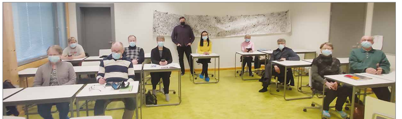
Älypuhelin-kursseilla olivat aktiivisesti läsnä jokaisessa kokouksessa.