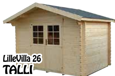
LilleVilla 26 TALLI 2800x4600 mm, hirsi 28 mm