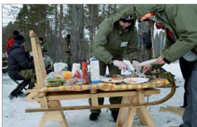
OSAOn matkailualan opiskelijat tarjoilivat halstrattua lohta komeasti kelkan päältä.