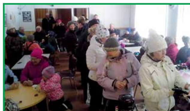
Sisätiloissa pelattiin bingoa.