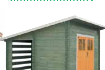
LilleVilla 207 VARASTOLIITERI 3900x3000 mm hariakorkeus 2530 mm