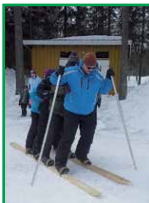
Tandemhiihtoa pääsi kokeilemaan.

keskinäistä tapaamista järjestetään tulevaisuudessakin ja ehkä jo kesän alussa seuraavan kerran.