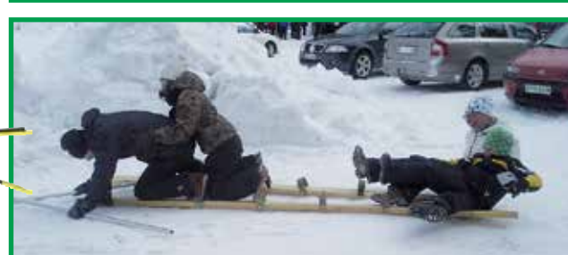
Aina ei onnistunut tandemhiihto.