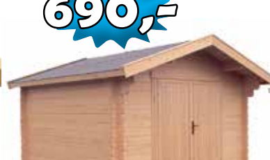
LilleVilla Mikkeli VARASTO 3000x3000 mm hariakorkeus 2450 mm