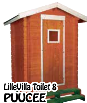
LilleVilla Toilet 8 PUUCEE 1200x1400 mm hariakorkeus 2580 mm