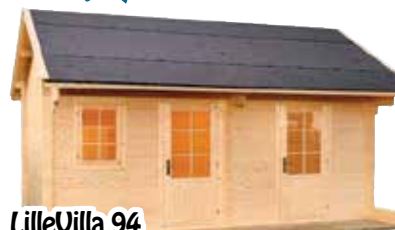
LilleVilla 94 PARIAITTA/ VARASTO 5100x3000 mm +850 mm hariakorkeus 3250 mm