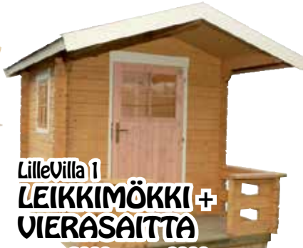
LilleVilla 1 LEIKKIMÖKKI + VIERASAITTA 2000x2000 mm + 1000 mm hariakorkeus 2390 mm