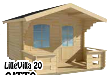
LilleVilla 20 AITTA 3000x3000 mm + 1500 mm hariakorkeus 2670 mm