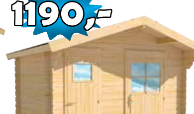
LilleVilla 312 PUUCEE-VARASTO 3000x2000 mm + 280 mm hariakorkeus 2550 mm