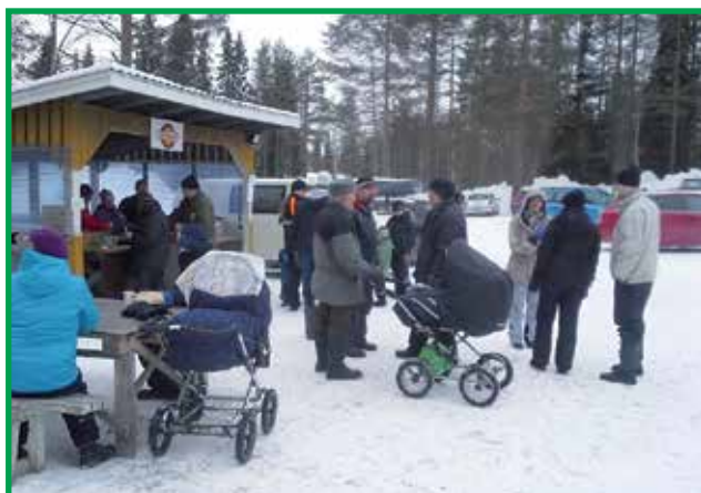
Lätyt teki kauppansa.

Järviset liikkeet olivat lahjoittaneet kilpailupalkintoja, joista lämpimät kiitokset lahjoittaneille. Tilaisuudessa pelattiin myös pari lehteä bingoa sekä järjestettiin arpajaiset.