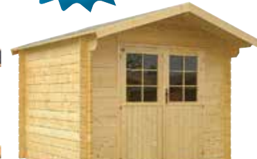
LilleVilla Vaasa VARASTO 2400x2450 mm hariakorkeus 2400 mm