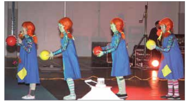
Huvikummussa. Peppi Pitkätossu hurmaa ja vie sydämet.

Perinteisesti näytös on avoin kaikille Pudasjärvelä toimiville voimistelu- ja liikunnaryhmille. Pudasjärveltä voimistelijaoston omien ryhmien lisäksi oli mukana kaupungin kerhotoiminnan telinevoimisteluryhmä ja Pudasjärven Nuorisoseuran tanssitoimikunnan kokoama lavatanssiryhmä. Tämän vuoden näytökseen kutsuimme mukaan Oulusta Team Rouge-tankotanssiryhmän, jos-