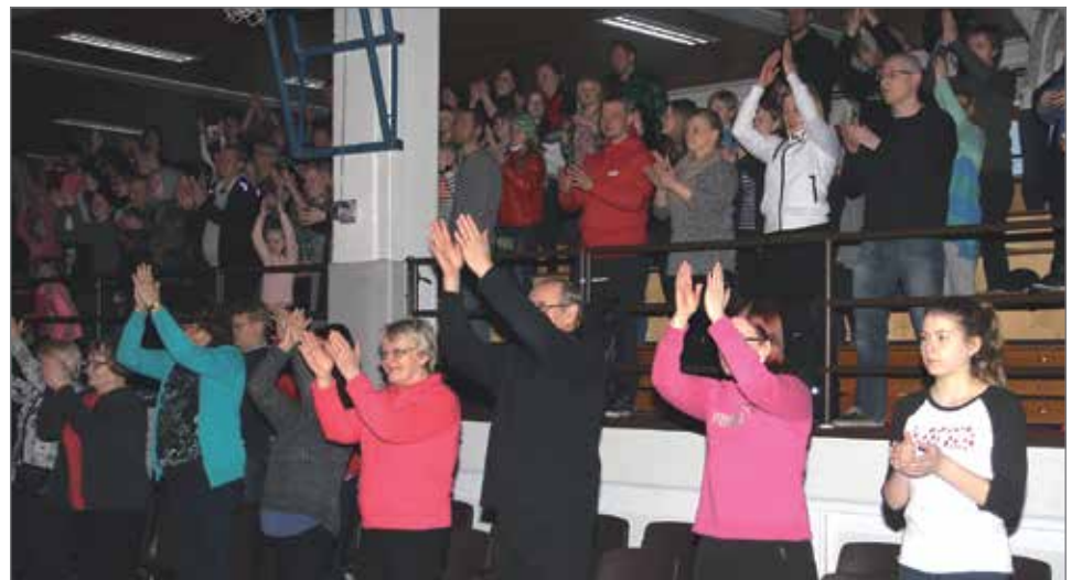
Koko yleisö osallistui yhteistanssiesitykseen.

Kirsi Kipinä