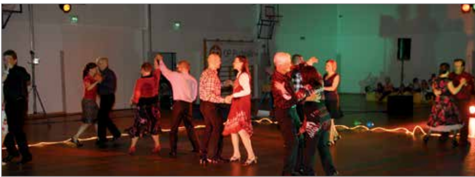
Kansalaisopiston lavatanssikurssilaiset esittivät Kurentanssin ohjelmasikermän.