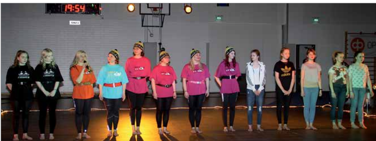
Esityksen lopuksi voimistelijaoston vastuunkantajat yhteiskuvassa.

Pudasjärven Urheilijoiden Voimistelijaoston toiminta on monipuolista ja aktiivista. Toiminnassa liikutetaan noin 100 aktiivista voimistelijaa neljä vuotiaasta aina yli 70 vuotiaaseen. Ryhmät kokoontuvat harjoituksiin kerran viikossa. Toiminnassa on seitsemän koulutettua ohjaajaa ja neljä apuohjaajaa, jotka lähtevät kouluttautumaan Suomen Voimisteluliiton voimistelukouluohjaajiksi ensi syksynä. Ohjaajat pitävät osamistään yllä käymällä jatkokoulutuksissa.