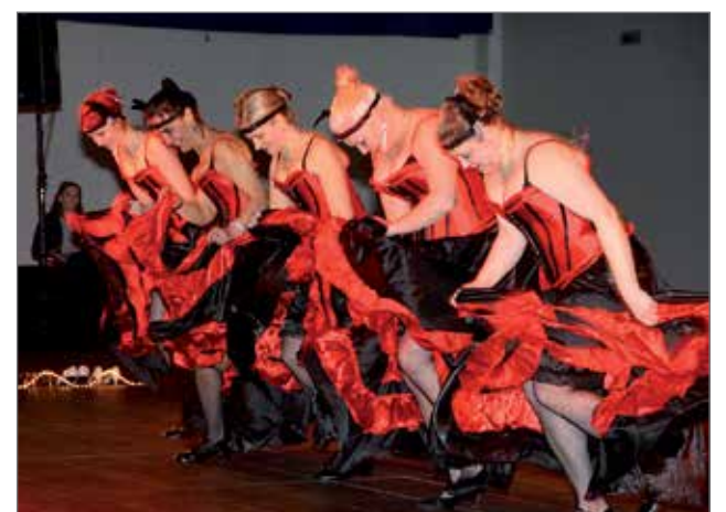
CanCan pudasjärveläisittäin oli värikäs ja vauhdikas esitys.