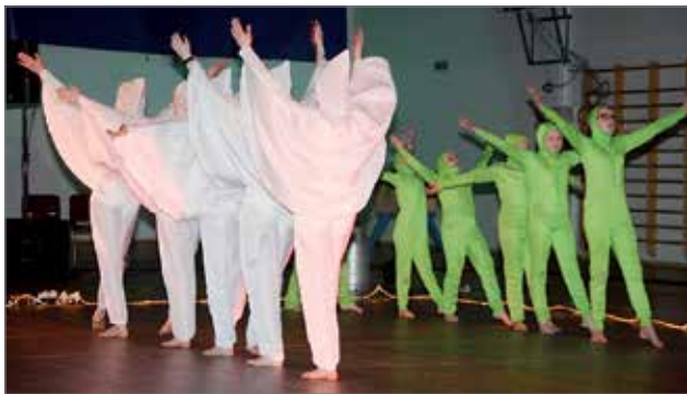
Lahden ja Helsingin voimistelun suur tapahtuman kenttä-ohjelma 3-2-1-Go.