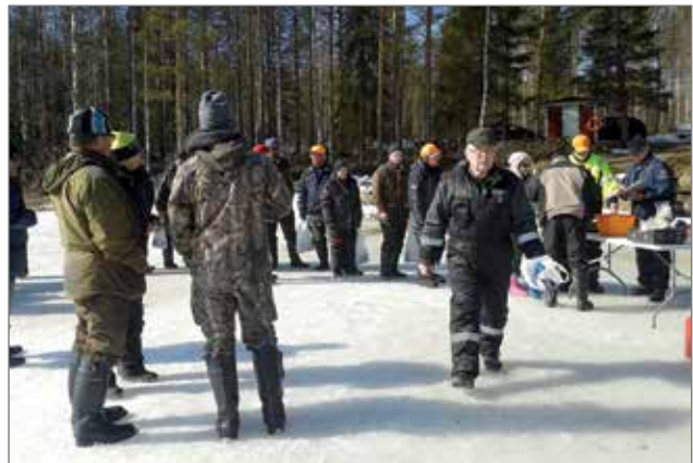
Pilkkikilpailun voittajat selvisivät kalojen punnitsemisessa. Suurin saalis oli reilusti yli neljä kiloa kalaa.