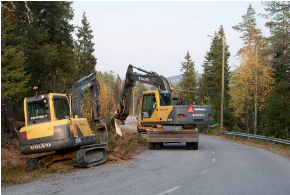
Pudasjärven keskustan lisäksi Kairan Kuidun rakentamistyöt jatkuvat useilla kylillä.

Taivalkosken osalta suurin osa verkosta on jo rakennettu. Tänä kesänä Taivalkoskella rakennetaan vielä keskustan alueella Iijoen, Oulu-Kuusamon-tien ja Taivalvaaran väliin jäävällä alueella sekä Museon ym-