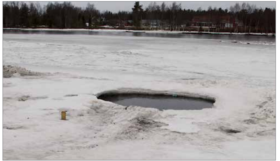
Rajamaanranta on osoittautunut oivalliseksi talviuimapaikaksi, jossa uintikausi on saatu lähes ympärivuotiseksi. Avantoa pidettiin kunnossa viime viikonvaihteeseen saakka ja loppuun saakka on ollut kävijöitä. Uintia voidaan jatkaa, kunhan jäät pian lähtevät lijoessa.