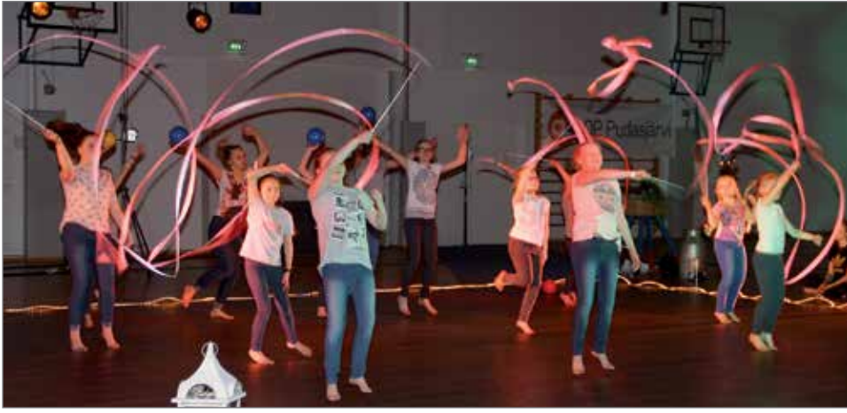
Somesta irti - ainakin hetkeksi!