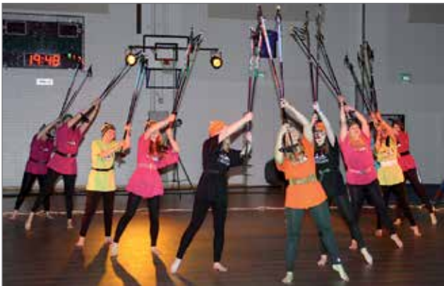
Täydellinen elämä kuntonaisten esittämänä.