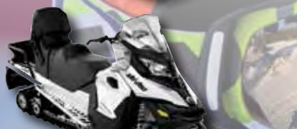
Ski-doo Expedition Sport 900 ACE