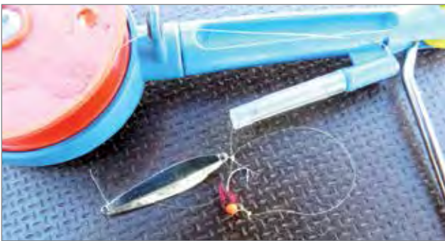
Reilu 11 kilon pilkkisaalis yhdestä avannosta, pieni hopea-messinki-värinen pystypilkki ja lyhyessä siimatapissa kevyt puna-oranssi-sävyinen mormuska.

Pudasjärven Virkistyskalastajat järjestivät Pudasjärven Havulan rannassa viimeisenä pääsiäispyhänä, maanantaina 01.04. perinteisen pilkkikalastustapahtuman. Kisaan osallistui 89 pilkkijää ja kirkas aurinkoinen sää sekä viime päivien tavallista heikommalla pilkkisaaliilla eivät ennakoineet huippusaaliita. Kuitenkin punnitukseen tuotiin kaloja kaikkiaan 774,6 kg. Miesten kisan voitto 23,8 kg, naisten sarjan 20,8 kg, miesveteraanien 21 kg ja nuorten sarja 10 kg olivat kaikki kisaennätyksiä.