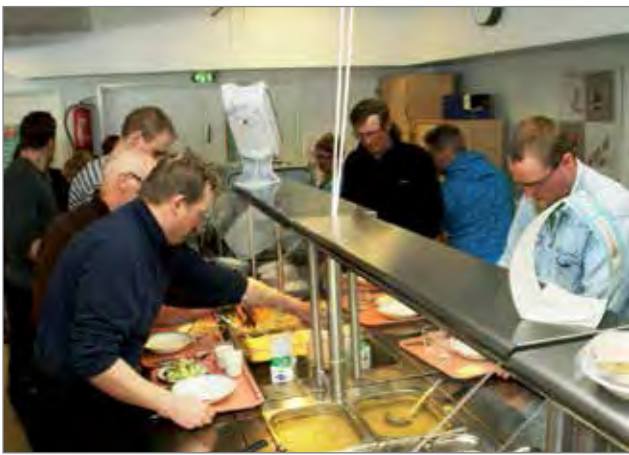
Harjannostajaisiin kuuluu perinteisesti hernekeitto, jota ottamassa rakennustyömiehet. He saivat kiitosta rakennustyön edistymisestä aikataulussa ajoittaisista lumisateista ja pakkasista huolimatta.

Pudasjärvellä hirsisen, toistaiseksi Suomen suurimman, ilmeisesti jopa maailman suurimman, hirsirakenteisen päiväkodin peruskiven muurauksesta ja harjannostajaisjuhlaa vietettiin perjantaina 5.4. Uudisrakennus valmistuu elokuussa ja mahdollistaa samalla myös koko päivähoitoimen uudelleen organisoimisen. Hoitopaikkoja uudessa päiväkodis-