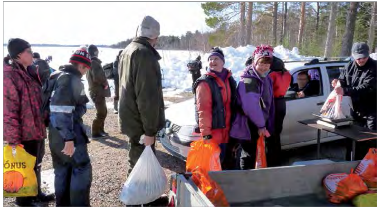
Pääsiäispilkin punnitusjonossa nähtiin iloisia kasvoja ja isoja saalispusseja.

pilkkipöntössä on saalista tavallista enemmän ja piti alkaa miettimään homman lopetusta. Kala olisi vielä syönyt, mutta rantaan lähtö oli ainut vaihtoehto. "Pantiin pillit pussiin" ja vieressä istuvan pilkkijän avustamana saatiin Saimille pilkkipönttö selkään ja matka punnituspaikalle oli edessä.