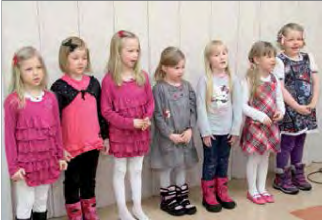
Kauppatien päiväkodin lapset esittivät lauluja ja leikkejä.