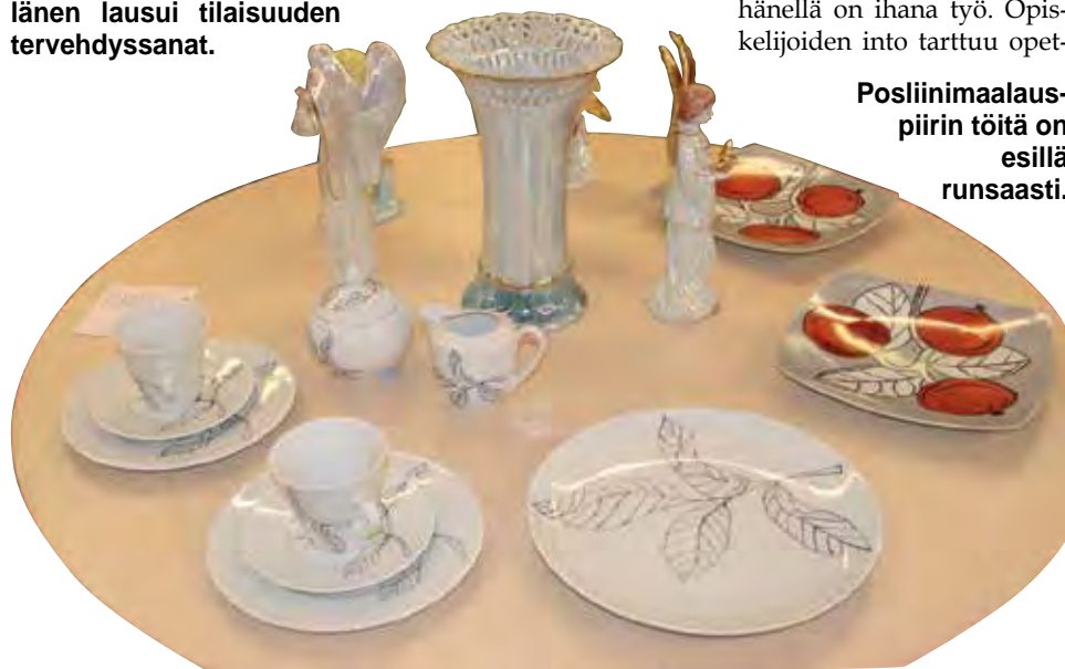
Posliinimaalauspiiriin töitä on esillä runsaasti.