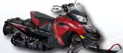
Lynx Rave RE 600 E-TEC