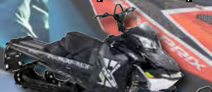
Lynx BoonDocker 800 E-TEC