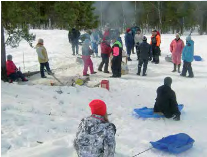
Juttu luisti tuttujen kesken.