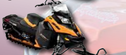
Ski-doo Summit 600 E-TEC