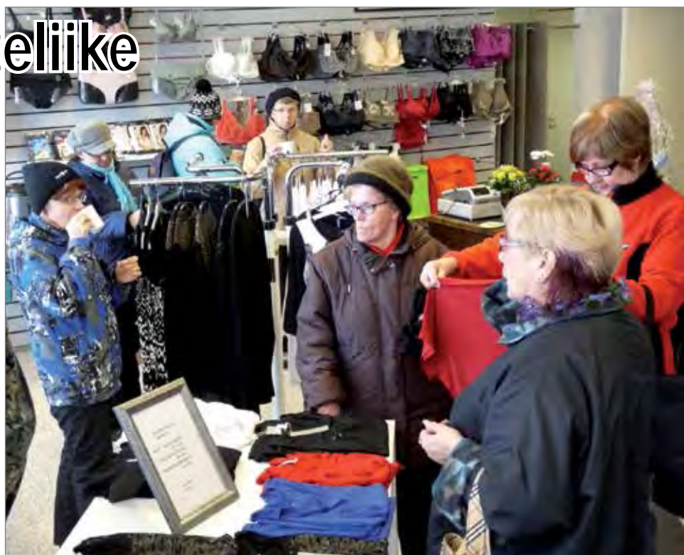
Avajaispäivänä Vaatepuoti Herttassa vieraili noin 200 asiakasta.

Nykyisen liiketilan valintaan vaikutti osaltaan se, että sinne pystyi järjestämään hyvät vaatteiden sovitustilat. Järvenpäällä on halua kehittää Herttan vaate- ja tuotevalikoimaa ja toi-