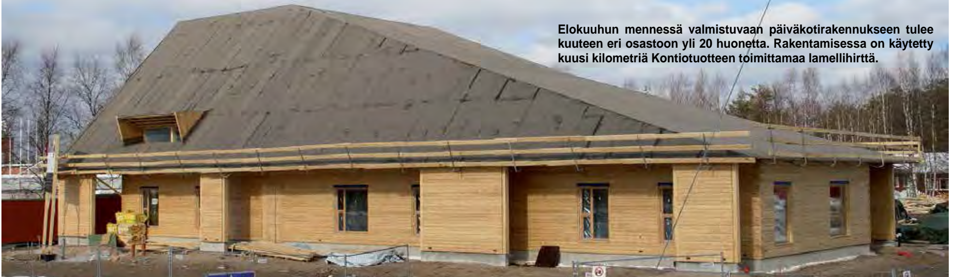
Elokuuhun mennessä valmistuvaan päiväkotirakennukseen tulee kuuteen eri osastoon yli 20 huonetta. Rakentamisessa on käytetty kuusi kilometriä Kontiotuotteen toimittamaa lamellihirttä.