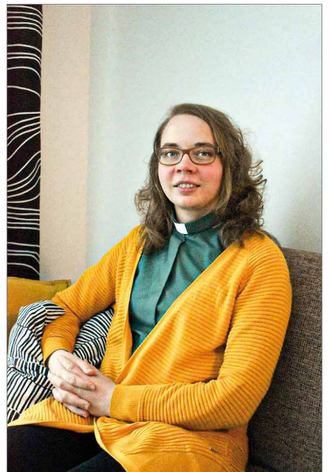
Eeva Leinosen lähettämä tuore valokuva, kuvaajana Linnea Leinonen.