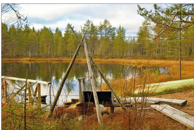
Syksyinen näkymä savusaunalta järvelle.