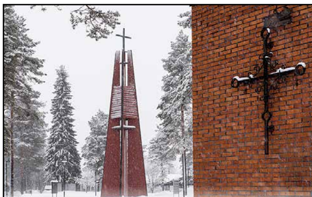
Seurakunnan tilaisuudet toteutetaan 25.4. saakka pääosin YouTuben välityksellä vallitsevan koronatilanteen vuoksi.

Jumalanpalvelus su 11.4. kello 10 toimittaa Timo Liikainen, avustaa Eva-Maria Mustonen, kanttorina Keijo Piirainen.