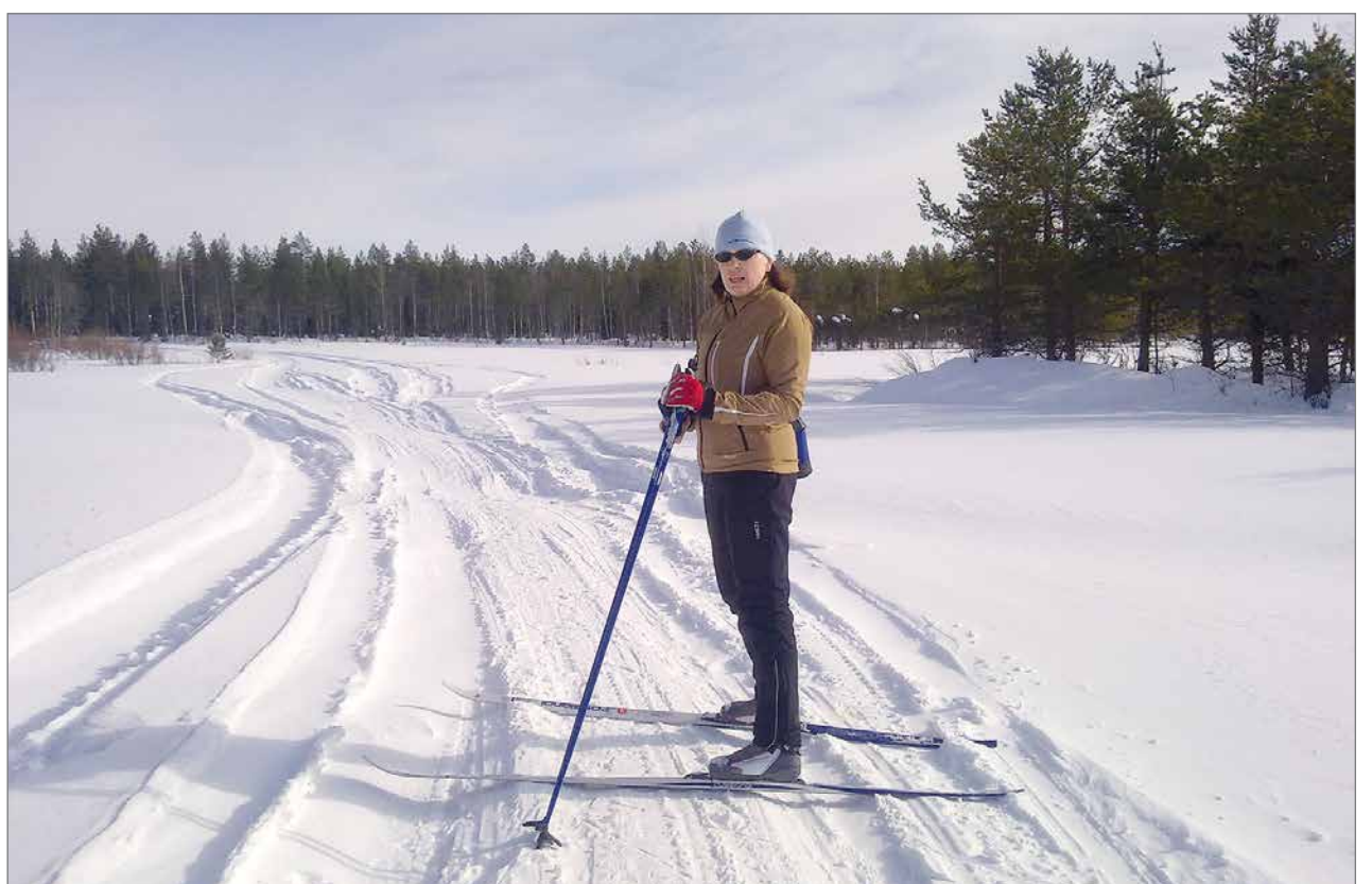
Koillismaalla on hienot murtomaahiihtomahdollisuudet.