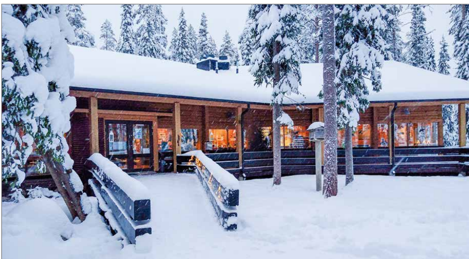
Taigavireen Syötteen Luontokeskuksella toimiva Kahvila Korppi -yritykselle on myönnetty Green Key -ympäristösertifikaatti.