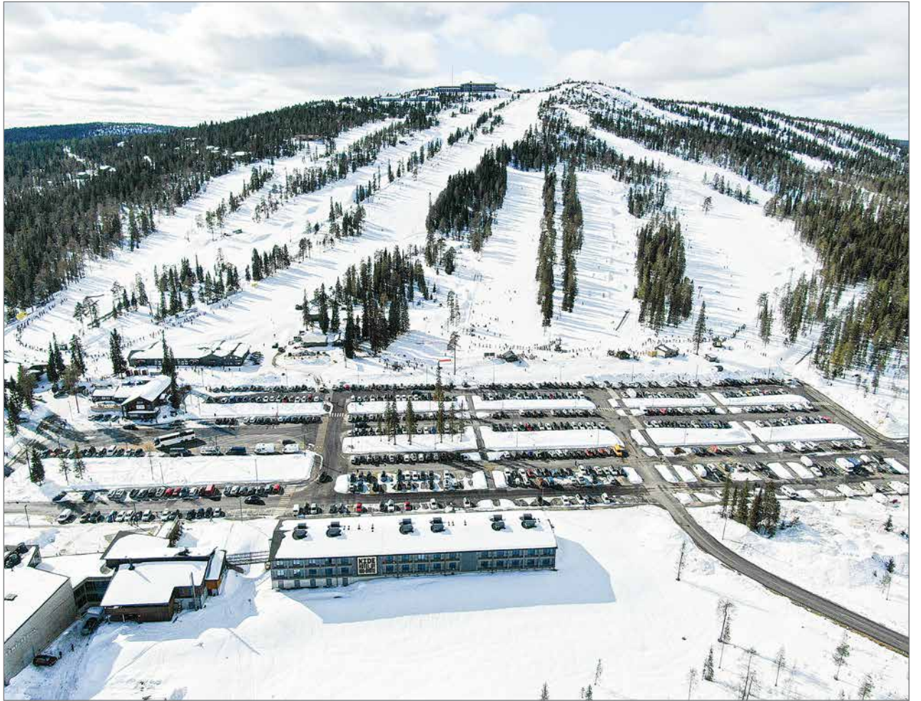
Näkymä Iso-Syötteeltä pääsiäislauantaina 3.4. iltapäivällä. Hissijonoissa on noudatettu koronan edellyttämiä turvavälejä ja uudistetulla parkkialueella on mukavasti asiakkaiden autoja.