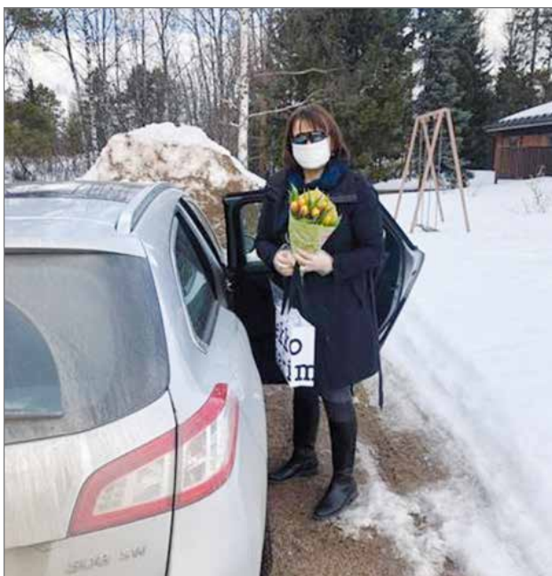
Äitienpäiväkäynniltä Kurenalla 2020.