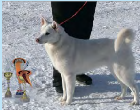
Kokkokylän kaunein Mäkipellon Blondi Kriise.