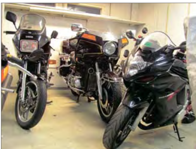
Rantatien kerhotiloissa on kerholaisten pyöriä säilytyspaikka