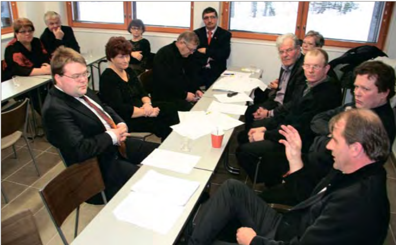
Yrittäjien kevätkokoukseen ravintola Revontulussa Syötteellä osallistui 14 henkeä.