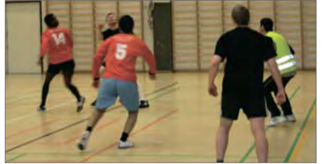
Futsal-turnaus kokosi Pudasjärven liikuntahallille viime lauantaina kymmenen joukkuetta pelaamaan jalkapalloa. Pelivuorossa pudasjärveläiset Ovon Nuoret ja Sähälääjät.

Kaikenlaista lumenpudottelua Pudasjärven alueella. p. 045 124 3100