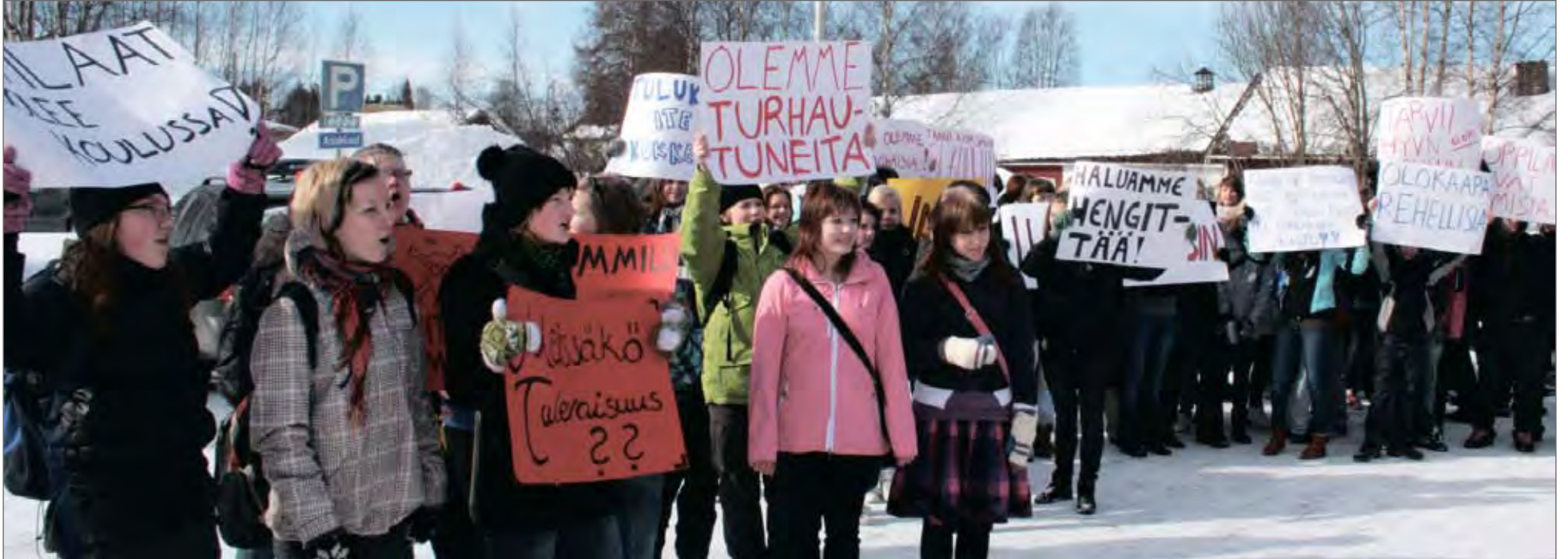
Rimminkankaan oppilaat kyllästyivät asioiden etenemiseen ja järjestivät ulosmarssin. Ulosmarssi päättyi kaupungintalolle.

Rimminkankaan koulun sisäilmaongelma on ollut esillä pitemmän aikaa. Koululta on tullut kunnan päättäjille tietoa huonosta sisäilmasta. Viime kesänä tehtiin kolmosrakennuksessa korjausremontti ja osalle yläasteen ja lukion oppilaista opetusta on annettu väliaikaisissa tiloissa Hilturannan leirikeskuksessa ja Fortumin talosta vuokratuissa tiloissa. Kaupungin päättävissä elimissä nähtiin vielä syksyllä, että mahdollisten homeongelmien vuoksi koululla on edessä suuri ja perusteellinen remontti tai toisena vaihtoehtona on nykyisen koulun purkamisen ja uuden koulun rakentaminen tilalle. Todellisen tilanteen selville saamiseksi pyydettiin ISS Proko Oy:ltä perusteellinen tutkimus rakennuksesta esiintyvistä home- ja sisäilmaongelmista. Kaupungin puolelta haluttiin antaa tutkimuksen valmistumiselle riittävästi aikaa, koska haluttiin saa-