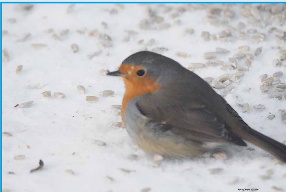
Punarinnan runsastuminen on jatkunut jo pitkään ja laji pesii entistä useammin myös pihapiirissä.