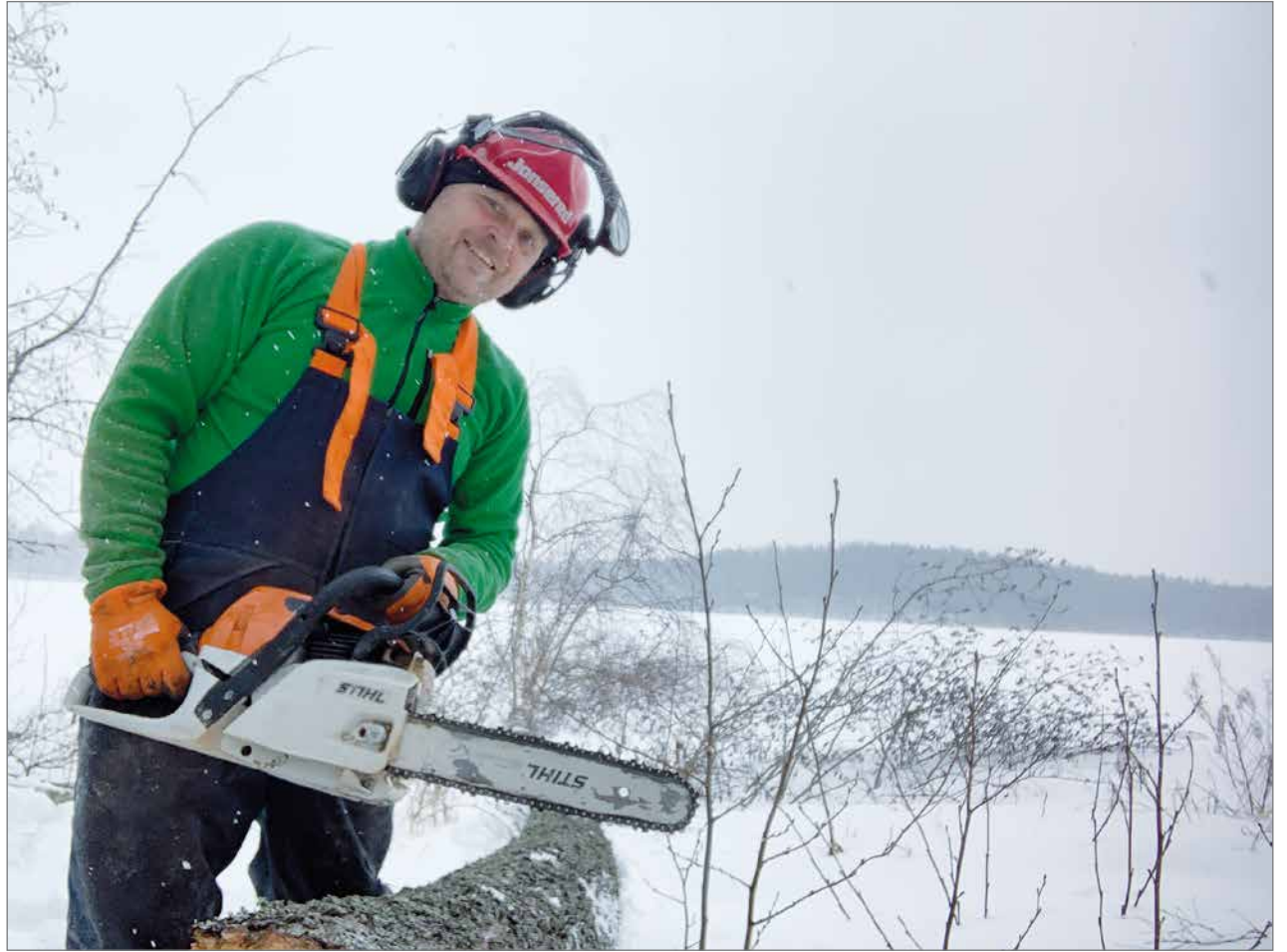
Pudas-Koneelta hankittu Stihl moottorisaha on ollut viimeisen vuoden aikana ahkerasti käytössä.

Kulunut vuosi on merkinnyt itselleni paljon. Luo-