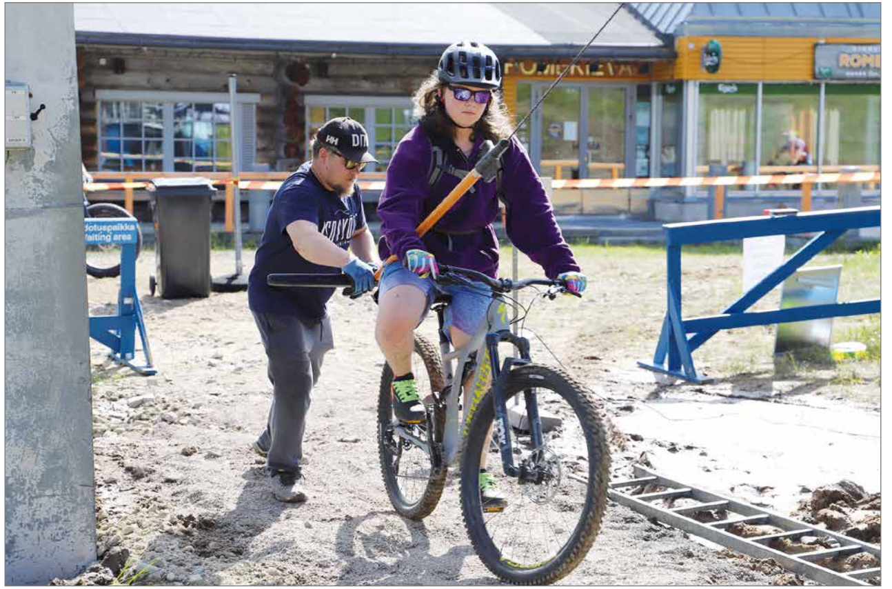
Iso-Syöte Pike Park avattiin viime juhannuksena kauniin sään vallitessa. Heti ensimmäisestä päivästä lähtien hissipyöräily on ollut hyvässä suosiossa.

Ylläksen ja Iso-Syötteen yhteinen Bike Park-kausikortti on myynnissä 15.3.-30.4.2021 molempien yhtiöiden verkkokaupoissa. Hissilipun hinta on 188 euroa. Molemmissa keskuksissa on käytössä Skidata-hissilippujärjestelmä. Sama ladattu etälukukortti toimii molemmissa.