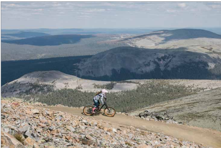
Ylläs Bike Park on hyvin tunnettu harrastajien keskuudessa.