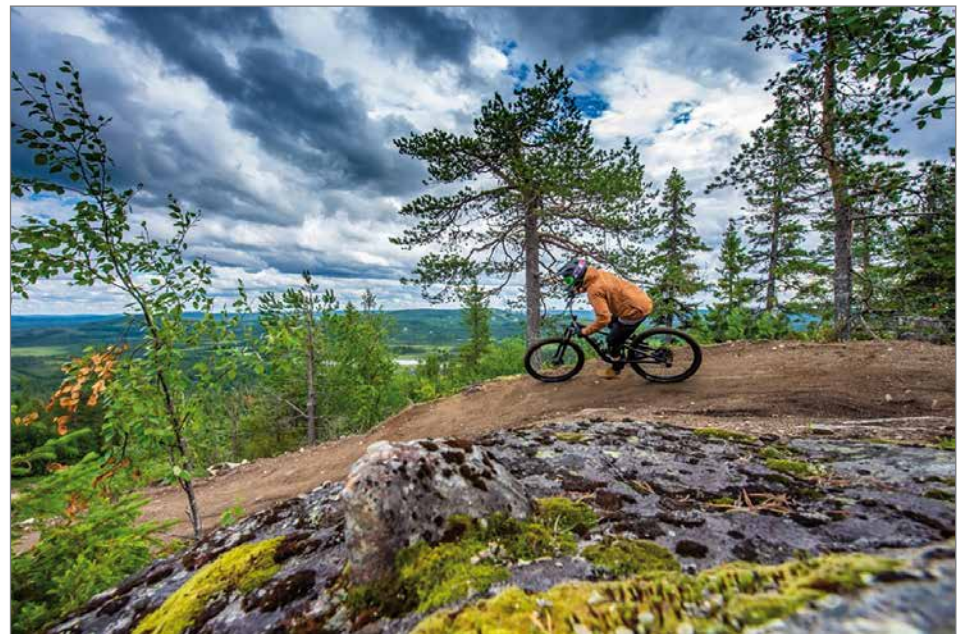
Iso-Syöte Bike Parkin reittitarjonta kasvaa kesälle 2021.