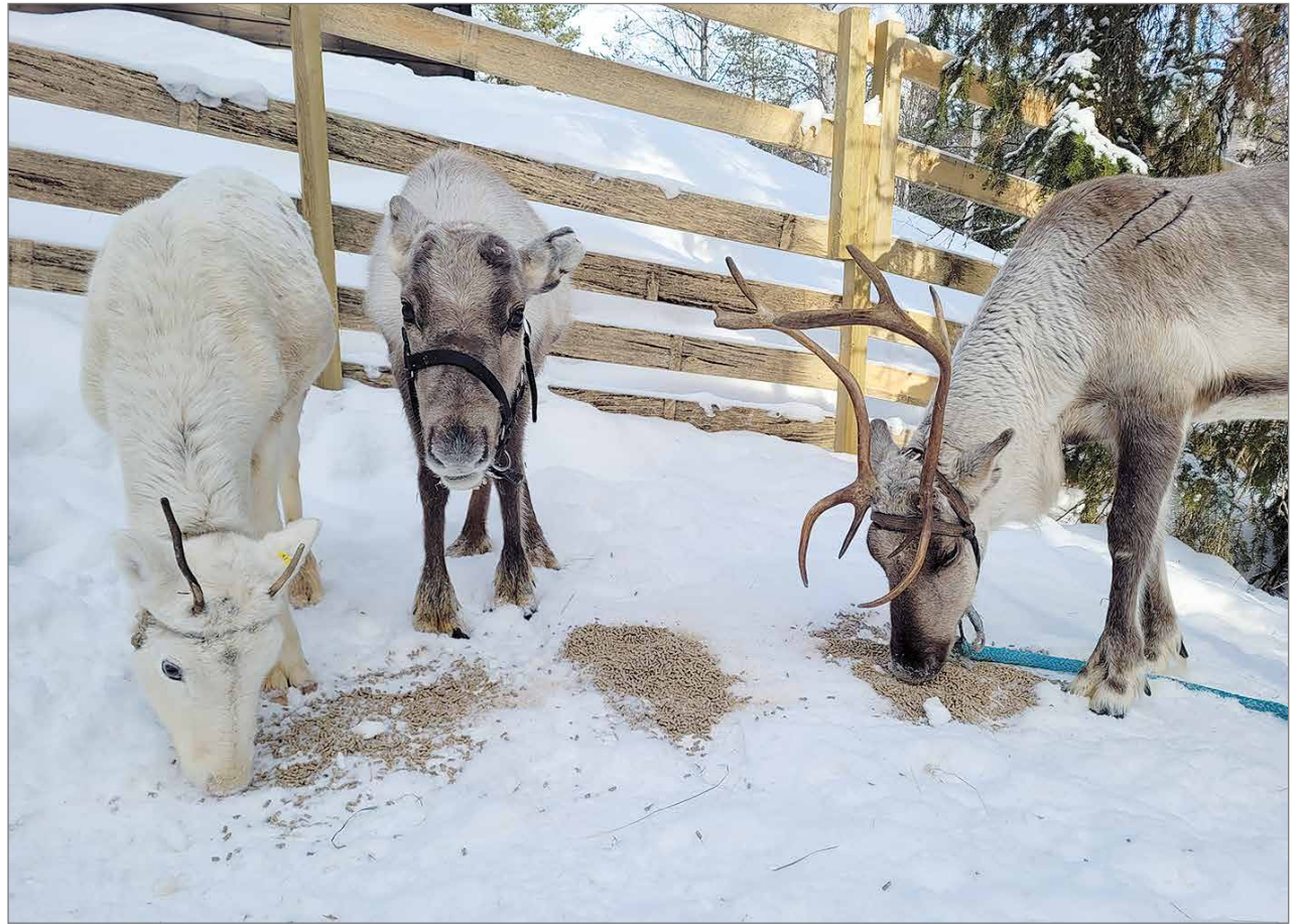
Porot Nihkke, Lumikukka ja Urho ovat ihasteltavina Pytky Oy:n aitauksessa.