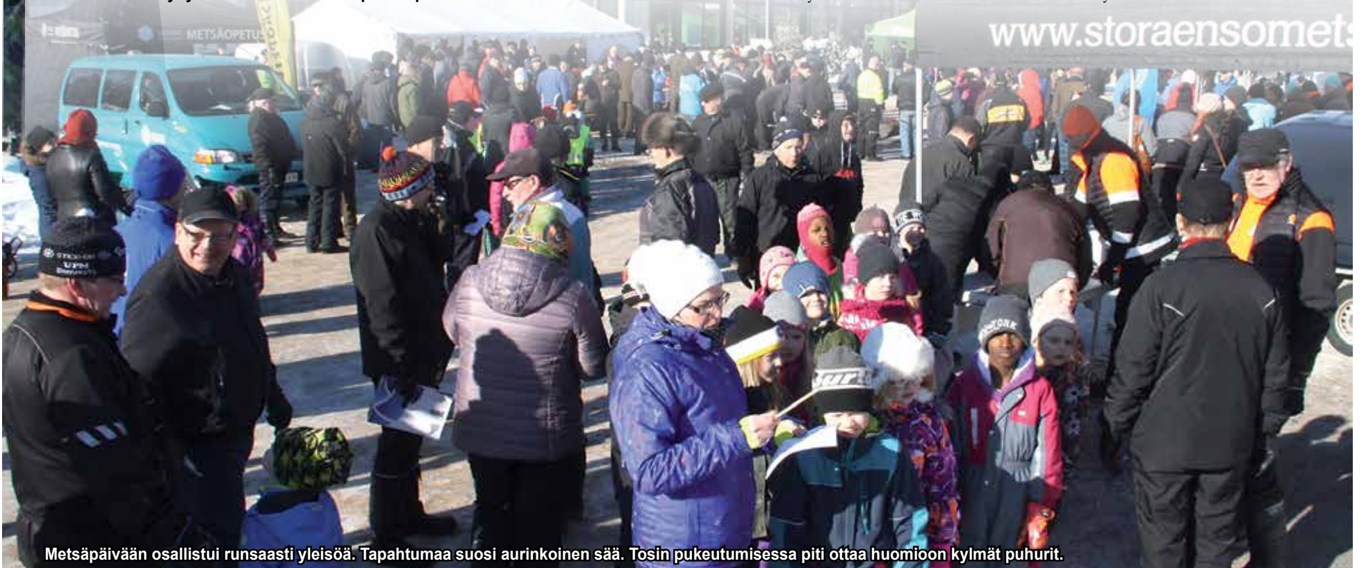
Metsäpäivään osallistui runsaasti yleisöä. Tapahtumaa suosi aurinkoinen sää. Tosin pukeutumisessa piti ottaa huomioon kylmät puhurit.