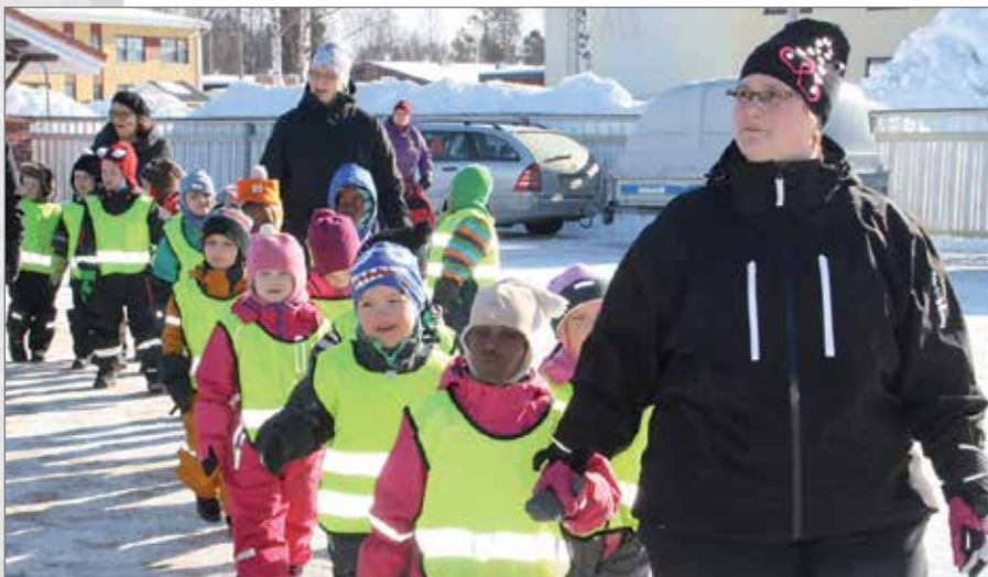
Päiväkodilta oli lyhyt matka vierailulla Metsäpäiväpaikalla.