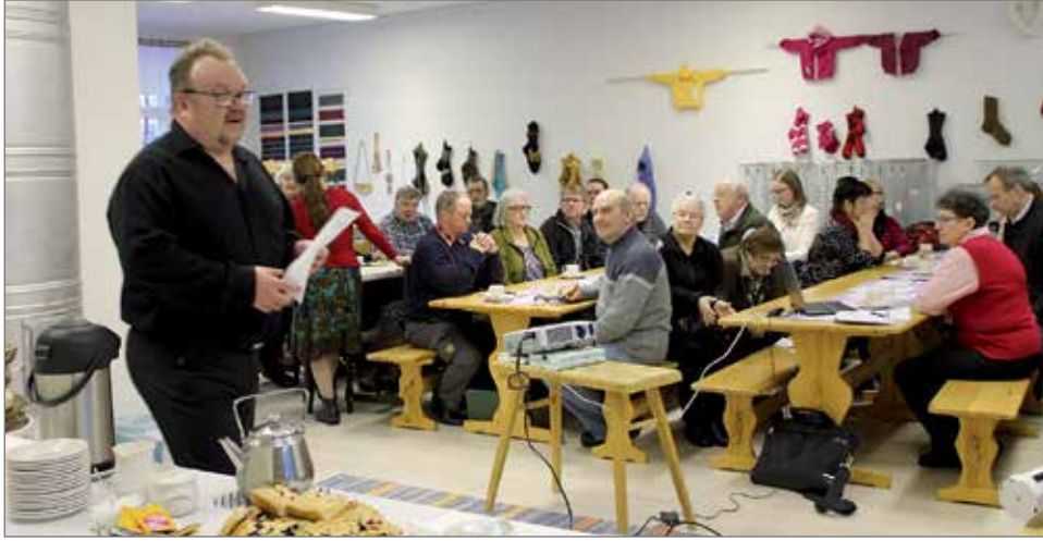
Kyläneuvoston kokouksessa Korpisella vaihdettiin kuulumisia ja jaettiin tietoa eri kylien toiminnasta.

Pudasjärven kyläneuvosto piti kokoustaan Korpisella viime viikon tiistaina. Kokouksessa kuultiin kylien, kunnan ja hankkeiden edustajien puheenvuoroja ajankohtaisista asioista. Tapahtumassa oli mukana nelisenkymmentä henkilöä.