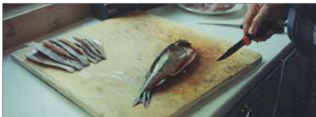
Maitopurkin kokoisia ahvenia.