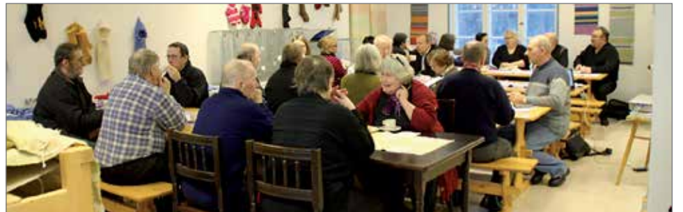
Puheensorinaa kahvittelun lomassa.