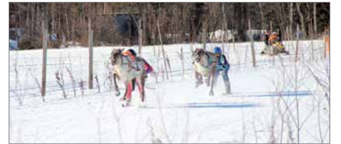
Panumalla mittaa toisistaan otti 16 kilpaporoa.

Panuman talvitapahtumaa vietettiin kauniissa