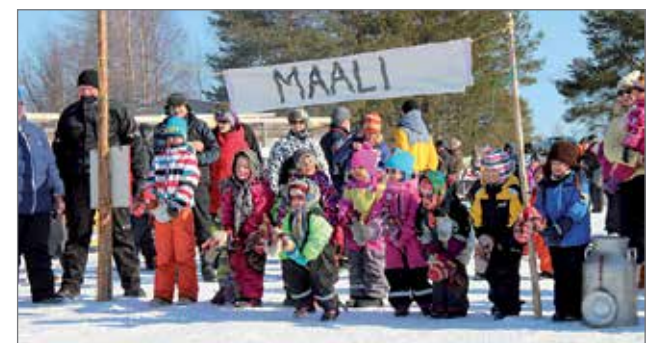
Panuman talvitapahtumassa lapset ovat aina kunniavieraita ja viihtyvät talvisen toiminnan merkeissä.

Perinteikkäiden kisojen järjestelystä vastasivat talukoovimmin Panumajärvi ry ja Kiiminki-Kollajan paliskunta.