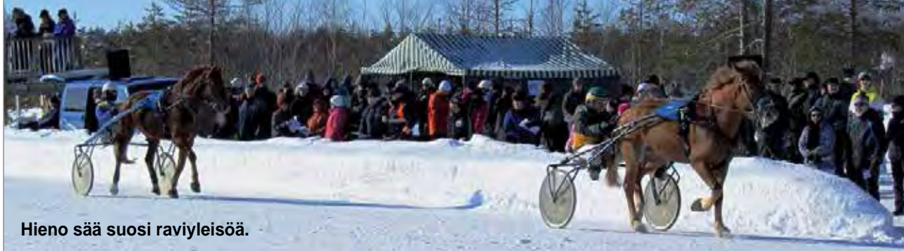
Hieno sää suosi raviyleisöä.

Kaunis kevätää suosi OSAO Pudasjärven yksikön hevos-taloustalouden ja Koillismaan hevosystävät ry:n Jyrkkäkosken raviradalla järjestämissä raveissa lauantaina 16.3. Paikallisraveissa ajettiin kaikkiaan kuusi lähtöä sekä koelähtö ja ponilähtö. Kilpailupaikka oli kunnostettu hyvään kuntoon ja olosuhteet sekä radalla että varikolla olivat erinomaiset ja mahdollistivat siten hienon ravitapahtuman. Yleisöä oli paikalla arviolta parisataa henkeä ja kaikki näyttivät viihtyvän leppoisessa ravitunnelmassa.