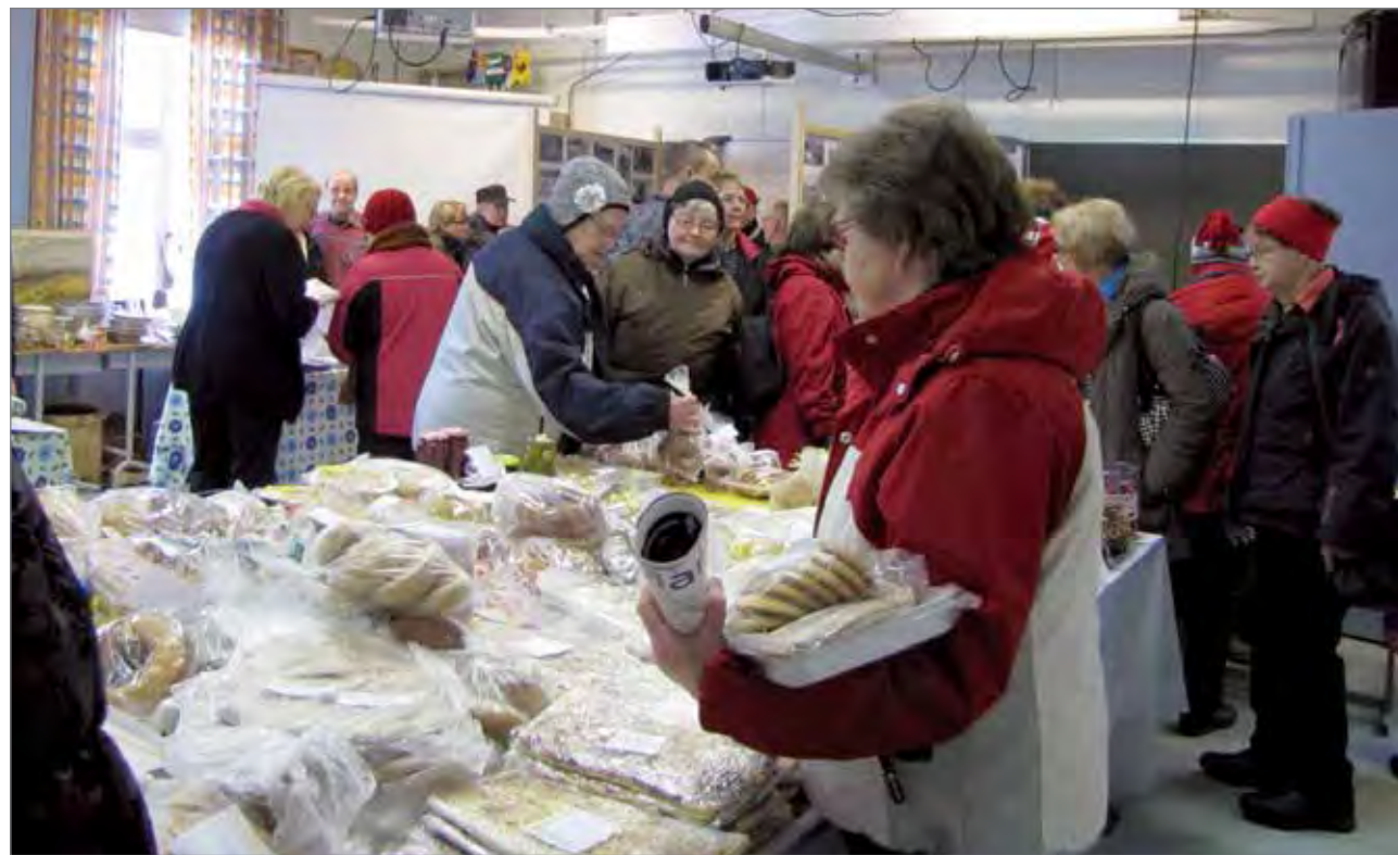
Vuoden 2011 markkinoilla teemana oli lähiruoka. Yläluokassa oli runsas myyjäispöytä, lähiruokapiste Ranuan Marttojen esittelypöytä sekä vanhoja esineitä ja valokuvia.

Kuukasjärven koulu on ollut jo pitkään Kelan, Kuukasjärven ja Petäjän kylien yhteinen koulu. Koulutoimintaa on yritetty lopettaa jo useiden vuosien ajan. Kylän oppilasmäärä on ollut kasvussa myös useiden vuosien ajan. Olemme saaneet kylillemme uusia asukkaita ja nuoriakin perheitä useita. Tämä koulun lopettamisen uhka on saanut kylillemme asukkaat ponnistelemaan lopettamista vastaan todella vah-