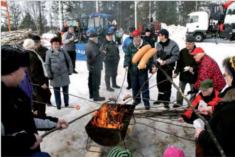
Makkaranpaisto kuuluu perinteisesti Metsäpäivän ohjelmaan.