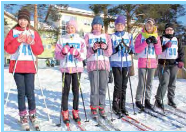
Viidennen luokan tytöt odottelevat oman kilpailun alkamista