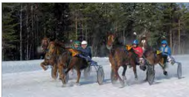
Lähtö 5. loppusuoralla. Kylmäveristen tasoitusajo 2060 m.