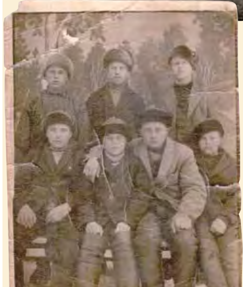
Kuva 3. Rippikoululaisia vuodelta 1931.