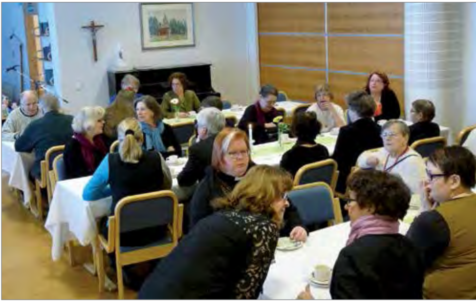
Sunnuntaina messun jälkeen kirkkokahveille osallistui yli 60 henkilöä.