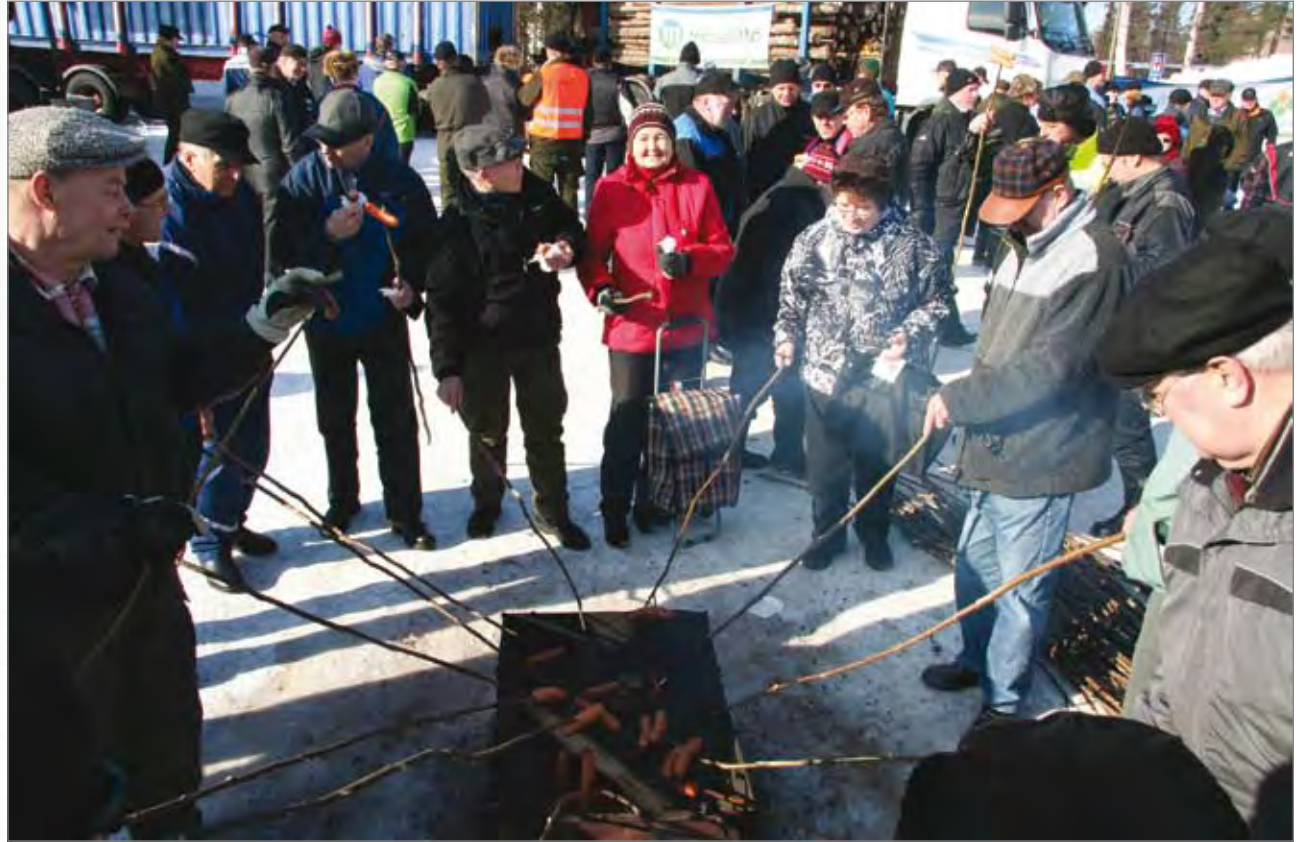
Metsäpäivien yleisölle maistuivat grillimakkarat, sillä niitä paistettiin päivän aikana 1300 kpl.