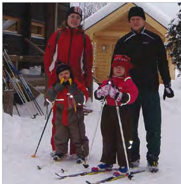
Äiti ja isä pienten lapsiensa kanssa ovat tuttu näky Syötteen hiihtoladuilla.

Kun perheet tulevat lomalle Syötteelle, retket suunnitellaan ottaen huomioon lasten ikä. Pienimmät ovat mukana ahkiassa. Jo kahden vuoden iästä lähtien lapset hiihtävät. Matka on tietenkin silloin melko lyhyt. Tänä vuonna 4-vuotias lapsi hiihti reilun kolmenkilometrin matkan Eteläisestä Pytkynharjusta Pytkynpirtille. Siinä välillä on iso mäki, Pytkynharjun ylitys. Oli kuulemma pitänyt pyllymäkenä tulla alas. Hyvin paljon on 5-6 vuotiaita, jotka hiihtävät 4-7 kilometriä. Hyvin yleinen ja suosittu reitti on hiihtää Iso-Syötteeltä Pytkynharjuun. Matkaa on noin 7 kilometriä, ja siinä on paljon alamäkeä. Takaisin on yleensä kyyditys autolla.