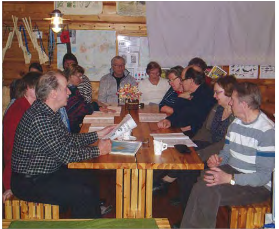
Yhteislaulu kajahti reippaasti