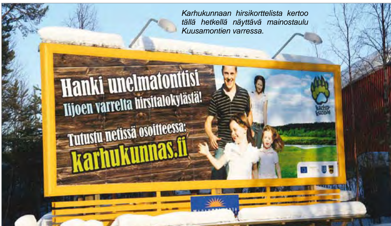
Karhukunnaan hirsikorttelista kertoo tällä hetkellä näyttävä mainostaulu Kuusamontien varressa.