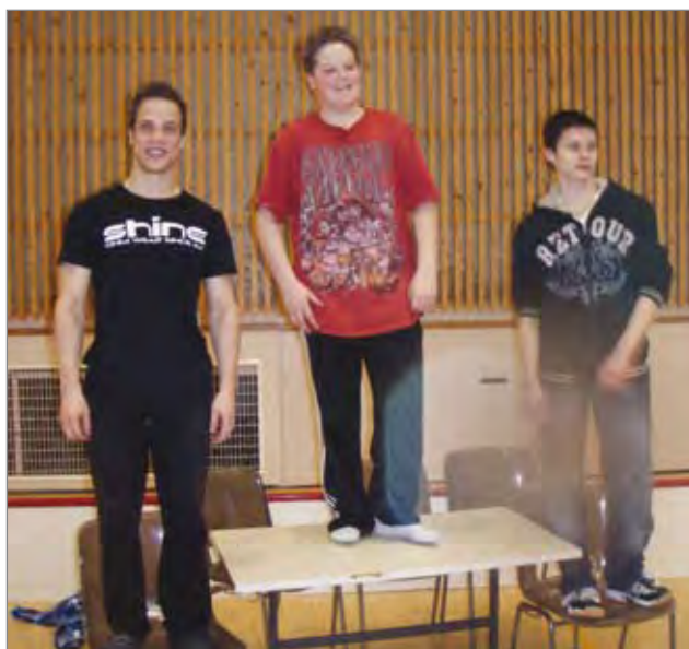
Turnauksen parhaat podiumilla. Nyt on aika tuulettaa.