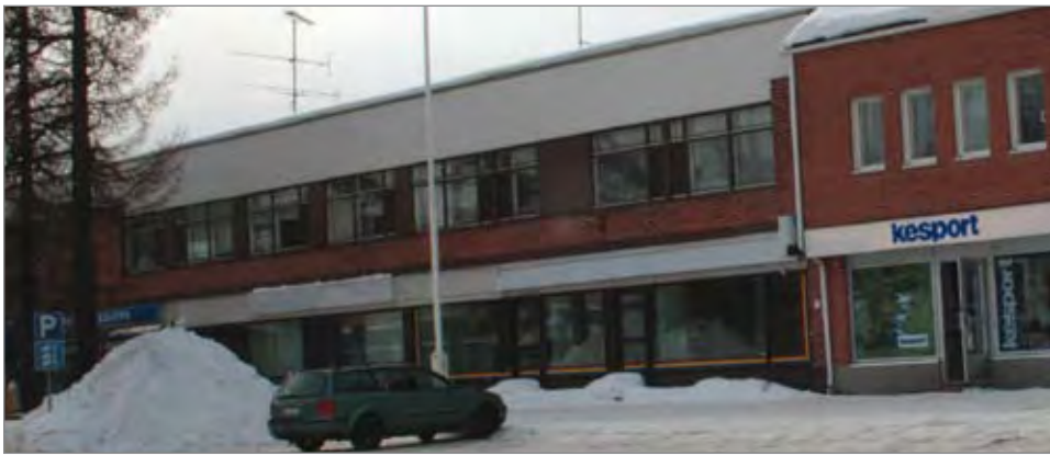
Pudasjärven 4H-yhdistys muuttaa entisen Vinkkelin tiloihin, Pudasjärven Kirjakaupan ja Kesportin väliin.

- Tulevaisuudessa pyritään myös siihen, että uusiin tiloihin on yhtä helppo tulla kuin vanhoihin, jatkaa Takkinen. (MT)