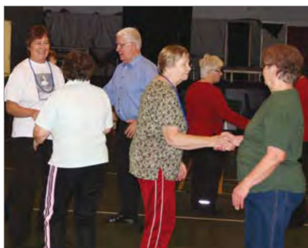
Senioritanssi on erinomainen tapa hoitaa niin sosiaalisia kontakteja kuin pitää huoli liikuntakyvyn säilymisestä. Kuvassa Pudasjärven Senioritanssijoita viikoittaisessa harjoituksessaan kansalaisopistolla.