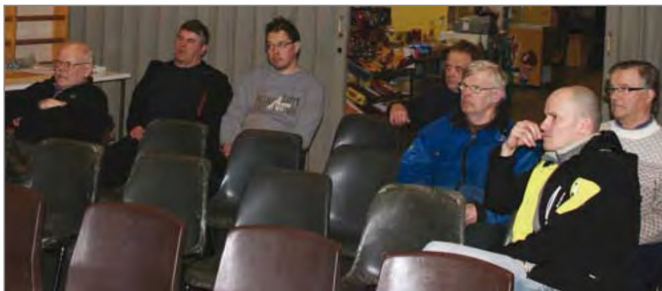
Tilaisuuteen osallistujat ottivat aktiivisesti kantaa illan aiheisiin.

Viime viikon tiistaina 8.3 järjestettiin Livon kylätalolla Metsät tuottamaan -tilaisuus. Kokoonottoon järjestettiin, koska, maa- ja metsätalous sekä pienyritystoiminta ovat pääasiallisia tahoja, joissa sivukylien työpaikat syntyvät tulevai-