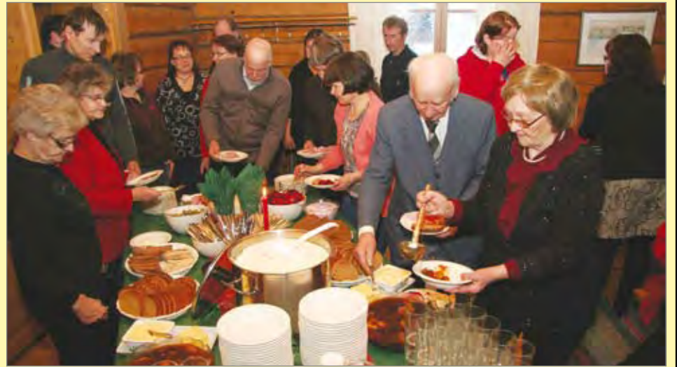
Uutena toimintamuotona järjestettiin joulukuussa jäsenille puurojuhla Liepeen pappilassa. Väkeä tuli tuvan täydeltä.

Toimintakertomuksesta kävi ilmi, että MTK Pudasjärvellä on ollut vilkasta toimintaa. Helmikuussa oli pidetty poropalaveri. Maaliskuussa tempaistiin suomalaisen ruoan -aiheinen tilaisuus Supermarkkettissa. Toukokuussa oli viljelijöille tarkoitettu moottoripyörällä ajokoulutus lentokentäl-