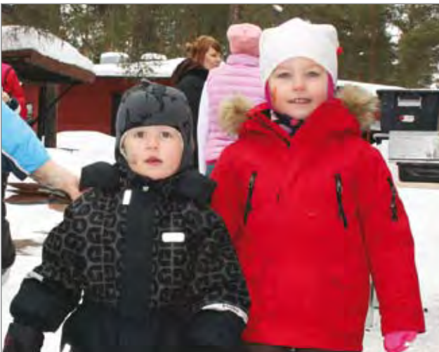
Lapset saivat kasvoilleen hienot maalaukset.