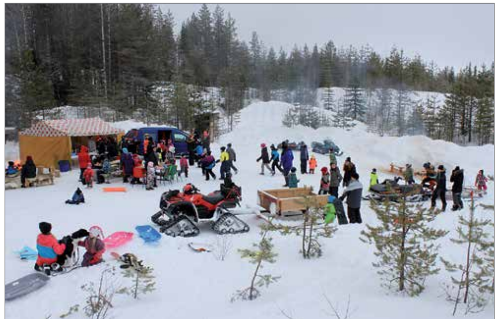
Yleisnäkymää tauko-, lämmittely- ja tankkauspaikalta Pärjänsuon ulkoilutapahtumasta.

Uutta edellisvuoteen oli paikalle rakennettu ulkoilutapahtumapaikka, joka sekini oli Hupitoimikunnan tekosia. Lisäksi alueella on laavu, jonka yhteydessä paloi reilunkokoinen nuotio. Hieman