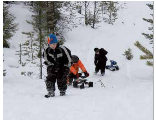
Mäkeä laskettiin koko tapahtuman ajan. Reippain ottein vietiin rinnettä ylös, jotta päästiin taas alas vauhdikkaasti.

Tapahtumaan osallistuneilta tuli paljon positiivista palautetta. Kaikesta näki, että järjestelyihin on käytetty aikaa, ja että Hupitoimi-