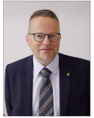
Kaupunginjohtaja Tomi Timonen.

Edellisessä katsauksessa kerroin myös kaupungin alueella meneillään tai suunnitteilla olevista mittavista investoinneista. Kaupungin omien investointien osalta laajimmat saadaan maaliin vuoden 2021 aikana. Niinpä vajaan kolmen miljoonan euron investoimisesta merkittävä osa on sellaisia, joissa saatetaan valmiiksi jo aiemmin päätettyjä kokonaisuuksia, muun muassa keskustajaman liikennejärjestelyihin liittyen. Uusia kohteita investointilistalla on nyt vain vähän tässä talouden tilanteessa.