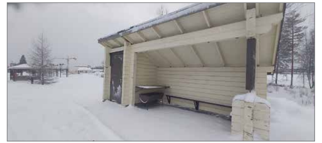
Kuvassa rajamaanrannan "laavu", josta monikaan ei tiedä.

Näin korona-aikaan olisi hyvä tiedottaa muutenkin noista mahdollisuuksista, jotta emme jäsähtäisi itsekkäin kotiseinien sisään ja paperitiedote kaupungilta antaisi kannustusta ulkoil-