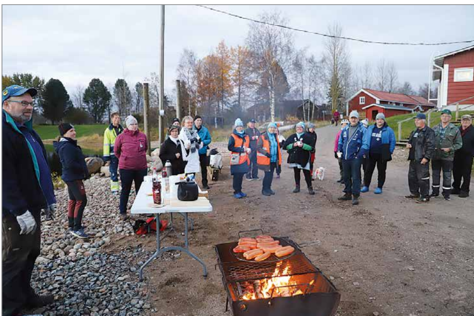
Talviuinnin avaustapahtumaan osallistui reilut 30 henkeä. Grillimakkarat ja nuotiopannukahvi maistuivat.