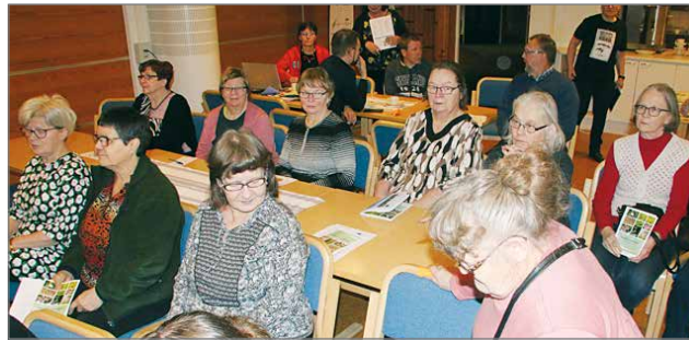
Luonnonhoitoiltaan oli ilmoittautunut noin 70 osallistujaa.