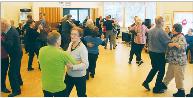
Ikäihmisten iltamien saama suosio yllätti myönteisesti järjestäjät.

Tanssin lisäksi oli monipuolinen ja ilmainen tarjoilu-pöytä, verenpainemittausta sekä Punaisen Ristin toiminnan esittelyä. Pudasjärven osastolla täyttyy marraskuussa 70 vuotta, joten kuuluva vuosi on osaston juhluvuosi. 70-vuotisjuhlaa vietetään ensi marraskuussa. HT