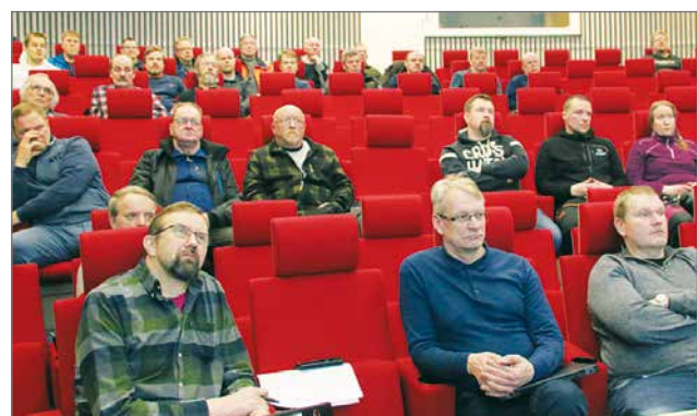
Vuosikokouksen osallistui 35 henkilöä Pohjantähden auditoriossa.