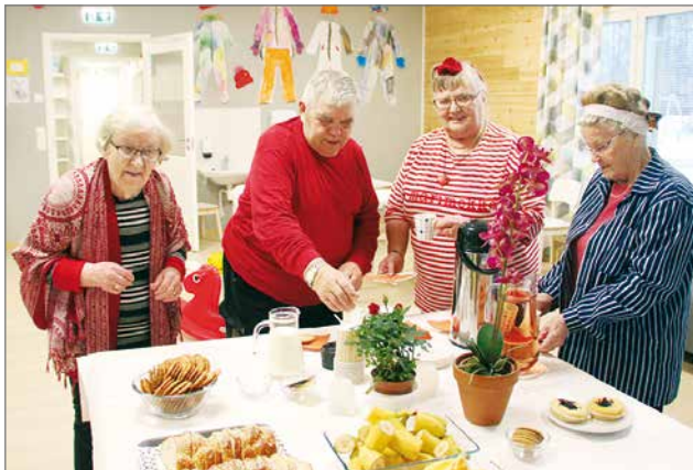
Vierailijoille tarjottiin kahvit, jonka jälkeen he saivat tutustua päiväkodin tiloihin ja osallistua päiväkodin toimintaan.

Kesti kertoi päiväkodin olevan kolmiryhmäinen. Hän kertoi päiväkodissa olevan