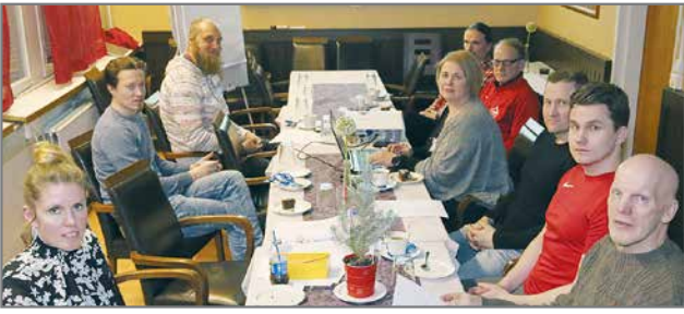
Vuosikokoukseen kokoonnuttiin Ravintola Meritan kabiinettiin.