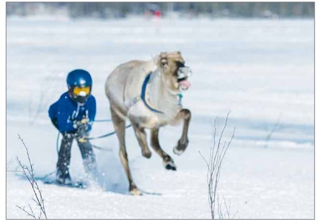
Jere ja Hektor varmistivat Rovaniemellä, että kirkkaimmat palkinnot tulivat Siurualle.

- Näihin nuorten poroajoihin tarvitaan paitsi fyysistä kuntoa, myös kodin ja perheen tukea sekä lasten innostamista.