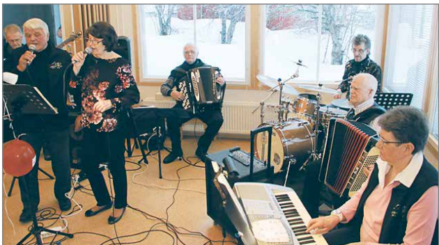
Suopunki-orkesteri vastasi ikäihmisten iltamien musiikista.