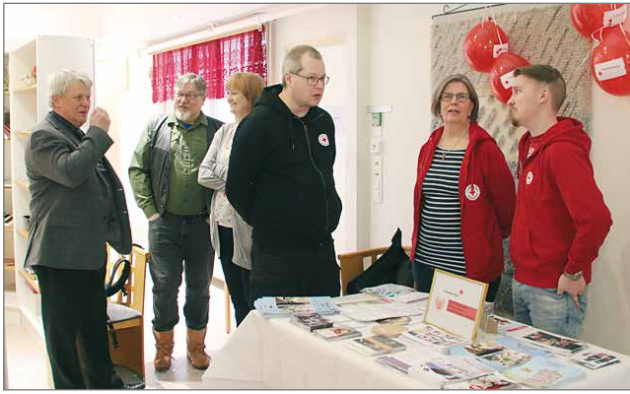
SPR:n väki kertoi osaston toiminnasta ja mukaan sai ottaa myös monipuolisesta toiminnasta kertovaa esitemateriaalia.