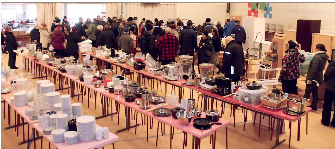
Pöydät notkuivat tilbehööristä, jotka myytiin joko pöydittäin tai koreittain.