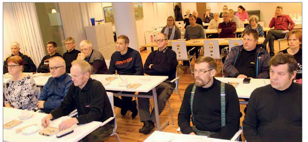
Ajankohtaista metsäveroasiaa kuultiin metsäveroillassa Osuuspankin kokoushuoneessa.

Ensisijaisesti tappio vähennetään muista pääomatuloista. Mikäli muita pääomatuloja ei ole – kuten suurimmalla osalla ihmisistä – syntyy alijäämähyvitys. Alijäämähyvityksen määrä on verovuoden tappiosta pääomavero%-suuruinen eli 30 prosenttia. Alijäämähyvitys huomioidaan automaattisesti verottajan automaattisesti verovelvollisen