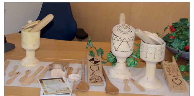
Seminaariväkeä kiinnosti puutyökurssin aikaansaannokset.

Maahanmuuttajien tietoa mielenterveydestä ja mielenhyvinvointiin vaikuttavista eri tekijöistä ja heidän tietouttaan itseavun mah-