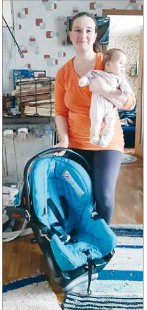
Pudasjärven Topi-torilta löytyi turvaistuin Dasa-vauvalle.

Olkaa niin hyvät ja reippaat, että maksatte jäsenmaksut Kesselin tilille oma-aloitteisesti ja pyytäkää uusia jäseniä mukaan. Tilinumero FI33 5360 0420 0467 01. Henkilöjäsen 10 €/vuosi, perheet 20 €, yritykset 50 €.