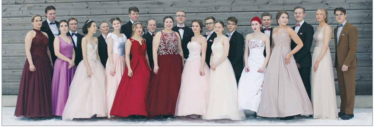
Tanssijat ja juontajat yhteiskuvassa ensimmäisen näytöksen jälkeen.

hin aikoihin alkoi pukujen ja kampaajien etsintä, tosin olipa joillakin ollut asu hankittuna jo edelliseen kesälomaan mennessä. Pukuja löytyi monesta paikasta: uudet kaupasta ja kierrätetyt tuttavilta lainattuina tai Facebook-ryhmien anteliailta lahjoittajilta. Upeat koristeet saatiin koulun myöntämän budjetin ja innokkaiden