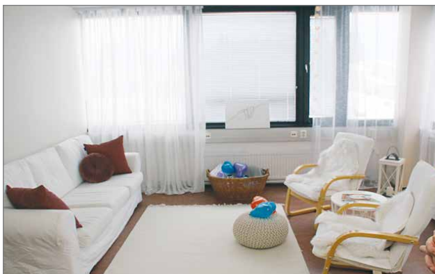
Tarja Hemmilältä voi varata ajan terapiaan joko yksin tai viihtyisässä tilassa voi olla useampikin henkilö yhtä aikaa.

Hemmilä korostaa, että on paljon helpompi tulla jo vähän etukäteen terapiaan, ennen kuin asiat ehtivät isoiksi. Ei ole niin pientä taikka isoa asiaa, jota ei kannattaisi tulla hoitamaan. Maanantait on varattu päiväksi, jolloin terapiaan voi tulla myös ilman ajanvarausta. HT