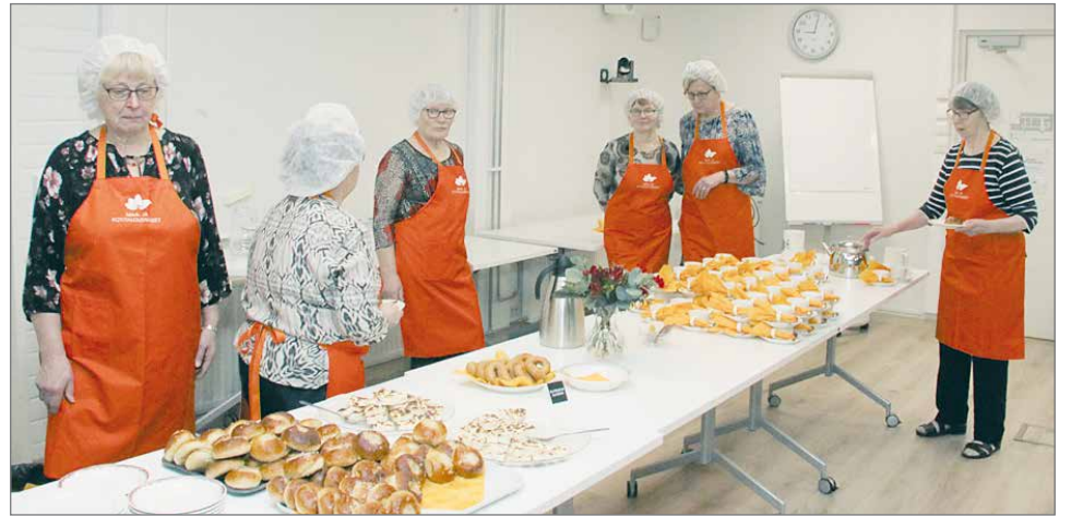
Tilaisuuden kahvitarjoilusta vastasivat Pudasjärven Maa- ja kotitalousnaiset.

Suurin osa kursseista on sellaisia, että niihin voi osallistua melkein kaikenikäiset, kukin edellytyksensä mukaan. Osa kursseista on kohdennettu senioreille senioripuutyöt, seniorijooga, Syötteen seniorijumppa ja