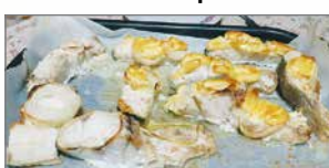
Majapaikassa Pertusilla oli maukasta turskaa päivällisellä.