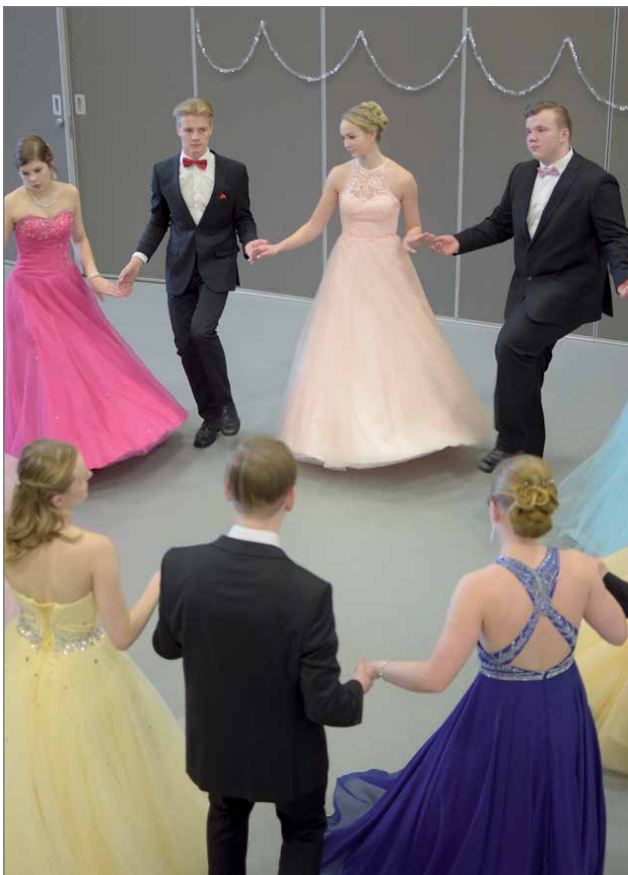
Päivällä tanssittiin kahdesti Hirsikampuksen aulassa ja illalla oli yleisölle avoin tilaisuus Tuomas Sammeltu -salissa, jolloin tanssijoilla oli juhlapuvut.