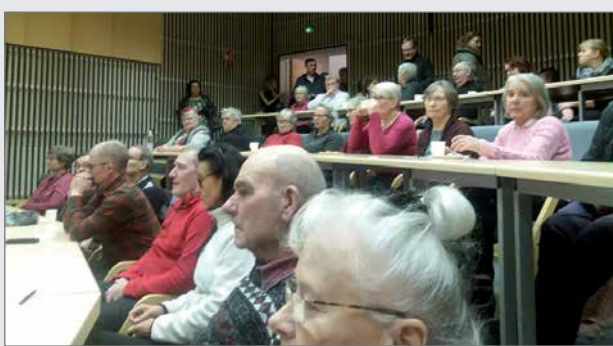
Pohjantähden auditorio täyttyi keskustelutilaisuuden osallistujista.

Maahanmuuttovirasto (Migri) päättää vastaanottokeskusten perustamisesta ja lakkauttamisesta Suomessa. Pudasjärven yksikkö on pieni, 110 paikkaa. Vuonna 2018 siellä majoitui keskimäärin 85 asiakasta. Helmikuussa 2019 siellä on 90 asukasta, joka koostuu 22 perheestä, joissa on yhteensä 27 lasta. Yksintulleita miehiä on 24 henkilöä ja yksin tulleita naisia kaksi. Keskukseen pystyy sijoittamaan liikuntaesteisiä, erityistä tukea tarvitsevia henkilöitä ja perheitä sekä henkilöitä, joilla on asiakkuus OYS:in erikoissairaanhoidon Oulun läheisen si-