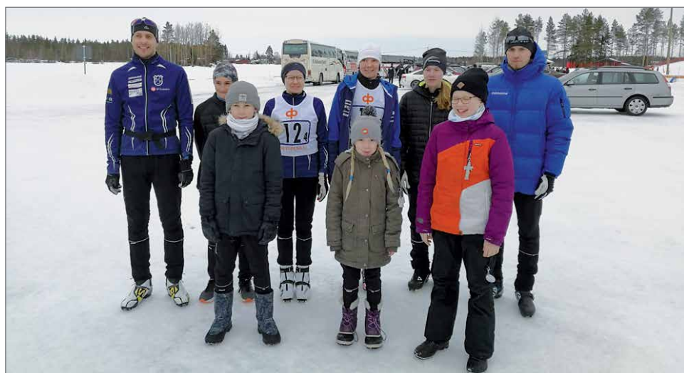
Pudasjärveltä oli maakuntaviestijoukkue usean vuoden tauon jälkeen, sijoitus 13.

Seuraavana päivänä Pyhäjoen maisemissa hiihdettiin vielä piirinmestaruus-