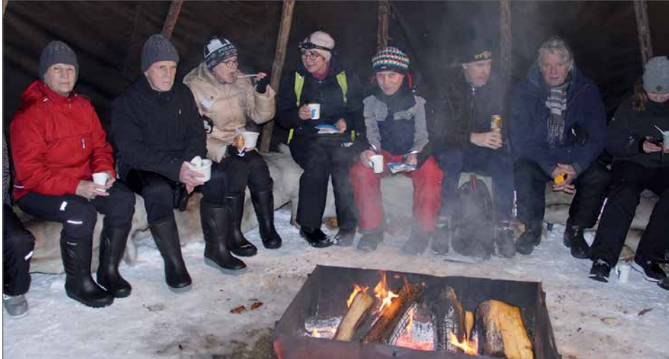
Lauantai-illan juhlatilaisuuden yleisölle maistui hernekeitto nuotion lämmössä.