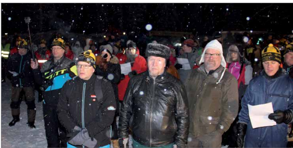
Yleisötalaisuus lauantai-iltana pidettiin lumisateen keskellä.