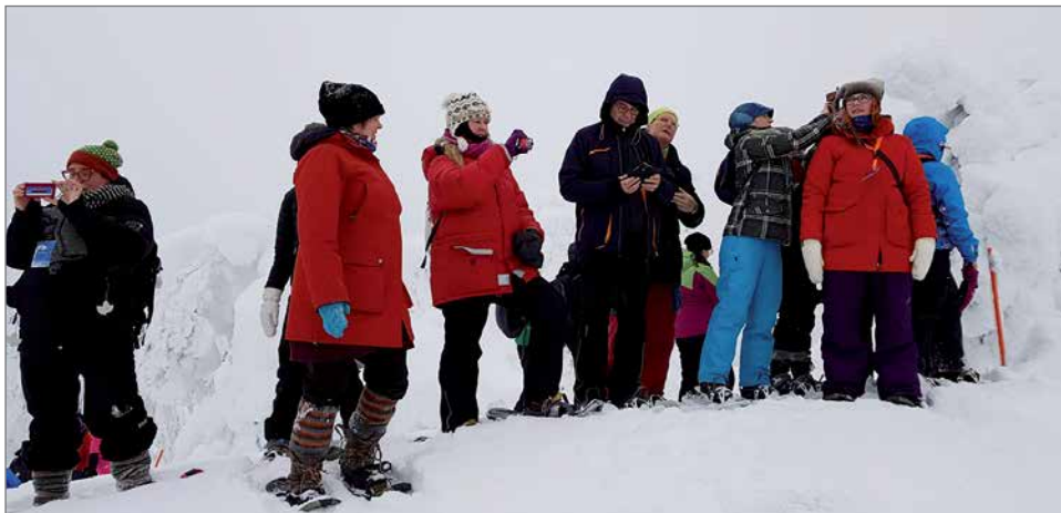
Lumikenkäily Syötteen luonnossa kuului päivien ohjelmaan.

Kuvat ja teksti: Nuoris- ja vapaa-ajankeskus Pikku-Syöte & Suomen nuorisokeskusyhdistyksen