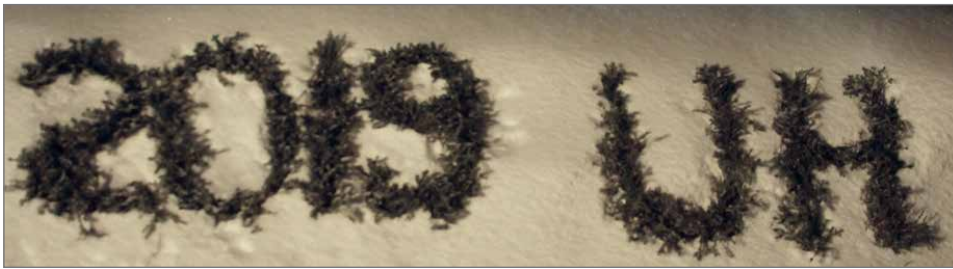
Yleisötalaisuuden lumesta tehtyä esiintymiskoroketta komisti havuista tehty kisateksti.

Heimo Turunen