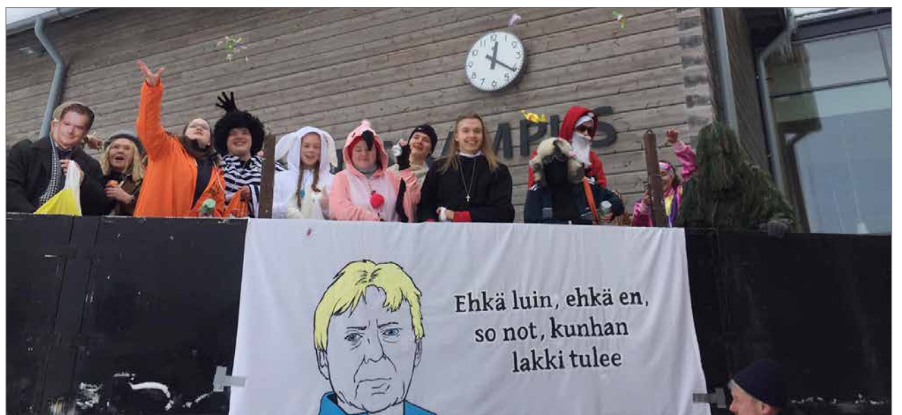
Kuorma-auton reitti, karkkeja heittelevät abit kyydissä, kulki Lakarin koulun kautta kuntakeskukseen.