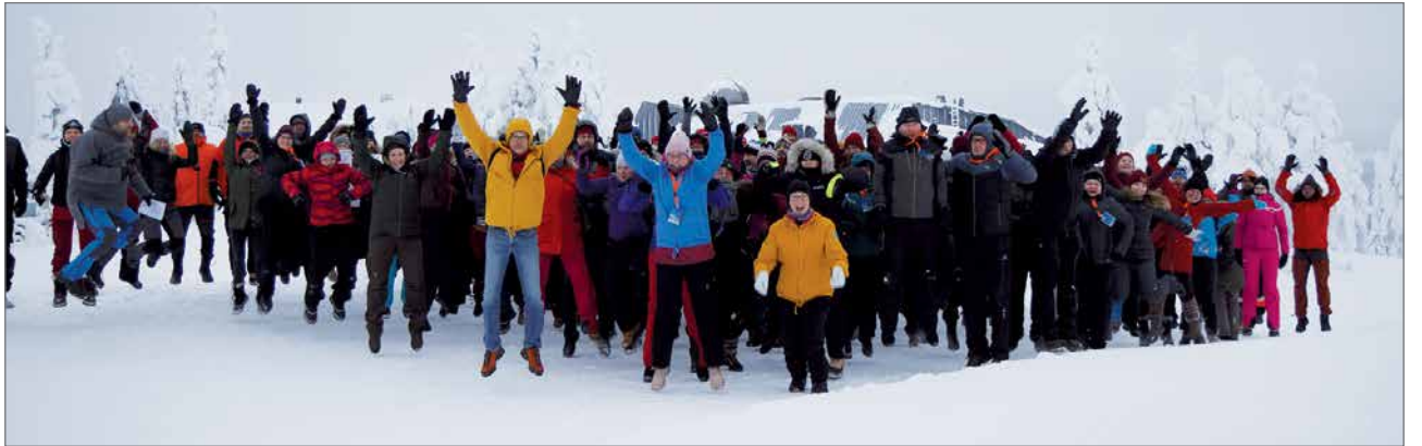
Tapahtuma kokosi yhteen yli 170 kasvatus-, sosiaali-, terveys-, luonto- ja koulutusalojen ammattilaista ja opiskelijaa.

Seikkailukasvatuksen toimijoita yhdistää näkemys vuoro-vaikutuksen, kokemuksen ja elämyksen vaikutuksesta ihmisenä kehittymiseen ja