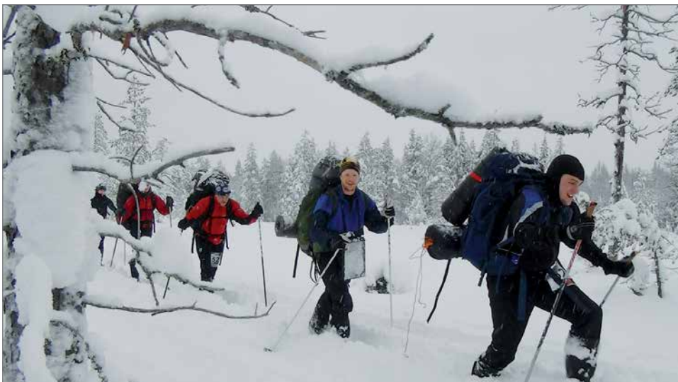
Joukkue 'Sivakkapartio' sunnuntain pikataipaleella.

Viikonloppuna 8.-10.2. Pudasjärven Urheilijat järjesti Syötteen alueella Umpihankiihdon MM-kilpailut 22. kerran. Hiihtäminen oli haasteellista upottavan lumen vuoksi. Lunta oli runsaasti, mutta pohjaan saakka pehmeää ja upottavaa, kertoivat hiihtäjät. Samoin sunnuntaiaamuna loppurutituksen aikana upottava lumi vaikeutti hiihtoa. Lämpötila oli lauhaa, nollan asteen tienoilla ja piti löytää oikeanlaiset voiteet lumen suksien pohjaan tarttumisen estämiseksi.