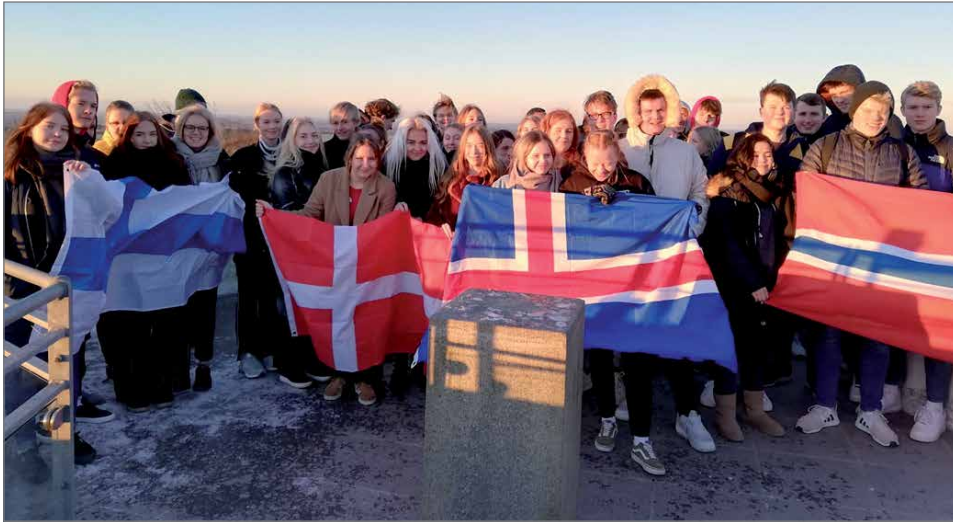
Erasmuslaiset eri maista yhteiskuvassa Tanskan korkeimmalta huipulta, Møllehøj-kukkulalta, jolla on korkeutta 170 metriä.

Tiistaina menimme kouluun kello kahdeksan aamulla ja siellä tarjottiin meille aamupalaa. Lukion opiskelijat pitivät meille siellä esittelykierroksen. Koulu oli todella suuri, ja parhaiten jäi mieleen oppilaiden ruokailusysteemi; koululla oli kolmen värisiä pöytiä, ykkösille, kakkosille ja kolmosille oli kaikille oman värinen pöytä. Ykköset eivät saaneet mennä kakkosten ja kolmosten pöytiin, mutta kakkoset saivat mennä ykkösten pöytiin ja kolmoset saivat mennä kakkosten sekä ykkösten pöytiin. Siellä ei myöskään ole ilmaista kouluruokaa, vaan opiskelijat ostavat itse ruokansa. Tiistaina kävimme myös oppitunneilla. Osa