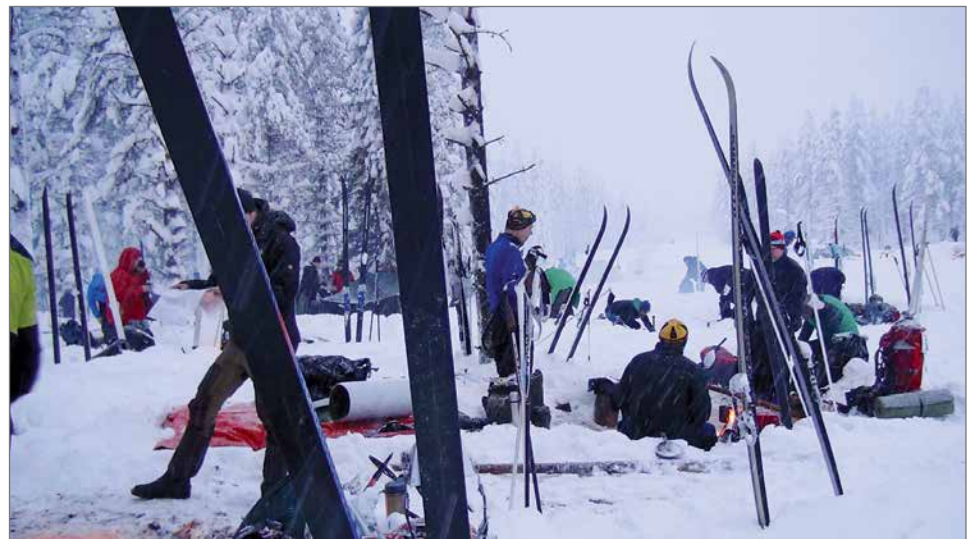
Aamulla yöpymismajoituksen purkamista.

Lauantaina järjestettiin iltajuhla kilpailijoiden yöleirin vieressä Kumpu-Torasvaarassa. Juhlatilaisuuteen osallistujille oli järjestetty linja-autokuljetus Pudasjärveltä ja Syötteen alueelta. Lisäksi huoltajia ja kilpailijoiden