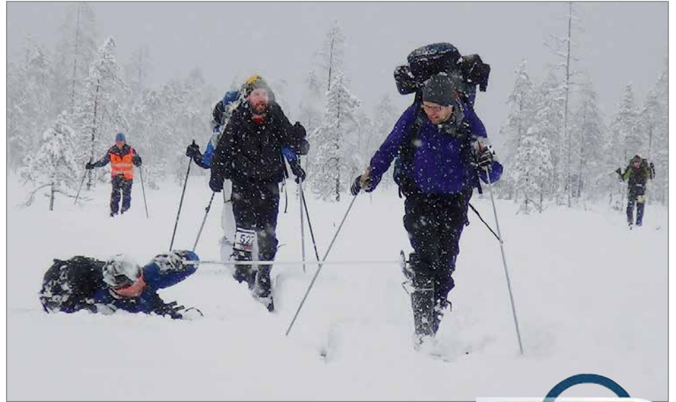
Hupsis! Tasapaino petti juuri ennen maalia.

hiihtäjää, heistä noin 60 oli naisia eli heidän osuus on noussut alkuajoista. Joukkueita oli yhteensä 57, joista maaliin pääsi 52. Yksilökilpailuun osallistui 31 henkeä.