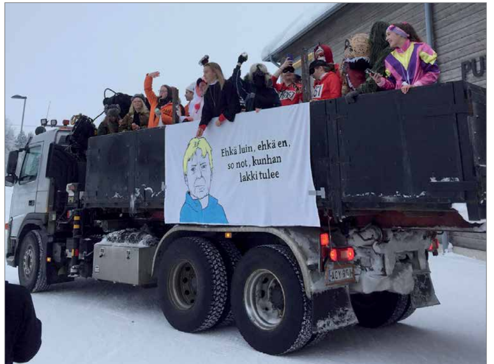
Penkkariajoissa oli keksitty ajankohtaisia ja hauskoja teesejä.