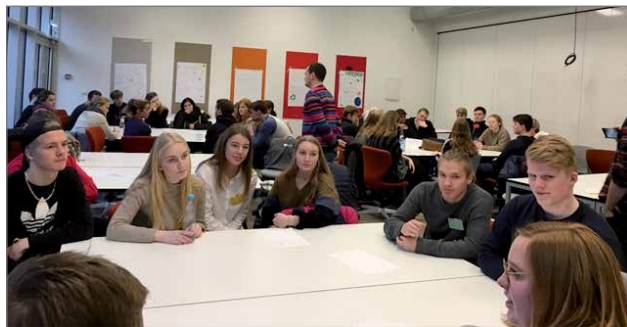
Viikon aikana ehdittiin tutustumaan uusiin ihmisiin ja tehtiin erilaisia ryhmitöitä.

sista aamulla ja tällä kertaa matka ei kestänyt niin kauan. Nukuimme suurimman osan matkasta, koska viikko oli todella raskas vaikka olikin todella mukavaa. Lähtöselvityksen kanssa oli vähän ongelmia, mutta siitäkin selvittiin ja pääsimme onnellisesti turvatarkastukseen ja koneeseen. Olimme kotona Pudasjärvellä myöhään illalla ja uni kyllä maistui, kun kotiin pääsi.