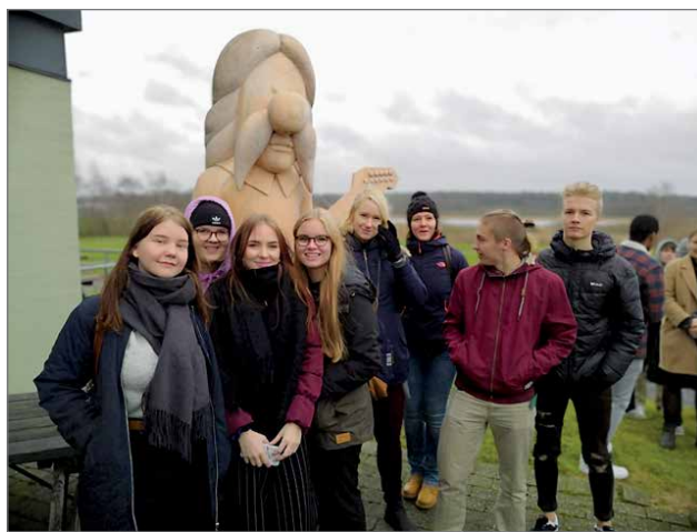
Pudasjärven lukion reippaat reissulaiset.

Sunnuntaina oli aikainen herätys, koska lähdimme matkustamaan takaisin kotiin. Bussi lähti Aarhusista