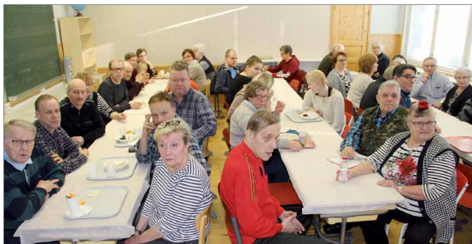
Juhlapeijaisiin osallistui reippaat 100 henkeä.