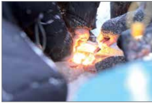
Elävä nuotiotuli kuuluu luontevasti luontoretkien ohjelmaan.

Järjestyksessään jo kolmannetta Seikkailukasvatuspäivät järjestettiin Pikku-Syötteen ainutlaatuisissa lumimaisemissa 14.-15.2. Tapahtuma kokosi yhteen yli 170 kasvatus-, sosiaali-, terveys-, luonto- ja koulutusalojen ammattilaista ja opiskelijaa. Seikkailukasvatusta käytetään työmenetelmänä mm. kouluissa, nuorisotyössä, sosiaalityössä, kuntoutuksessa ja terapiassa.