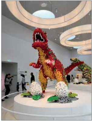
Retkipäivänä vierailimme LegoHousessa.

Tammikuun 14. maanantai-päivänä reipas porukka nuoria Hirsikampuksen luokiosta lähti Tanskan maalle. Reissu, jonka teimme Tanskaan, oli osa Erasmus+-projektia. Matkamme alkoi aikaisin aamulla Oulunsalon lentokentältä. Lensimme ensin Helsinkiin ja sieltä Tanskaan. Lennot olivat hieman myöhässä, mutta ei se meitä haitannut. Kööpenhaminasta lähdimme bussilla kohti Aarhusia. Matkan piti kestää vain muutaman tunnin, mutta matka venähti ruuhkan ja liikenneonnettomuuksien takia. Siinä vaiheessa kaikilla meinasi vähän kiukuttaa, mutta yritimme ajatella positiivisesti. Lopulta saavuimme kohteeseen ja sieltä matkustimme junalla lopulliseen määränpäähämme Skanderborgiin, missä isäntäperheemme odottivat meitä.