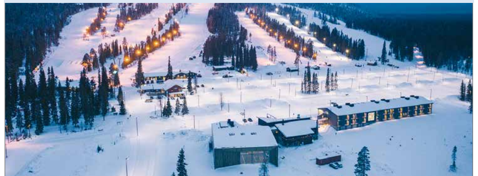
Iso-Syötteen uusi keskusalue. Etualan rakennukset vasemmalta oikealle: LumiAreena, ravintola Tuba Food & Lounge ja KIDE Hotel by Iso-Syöte.

Katso kaikki alueen tapahtumat www.syote.fi/tapahtumakalenteri