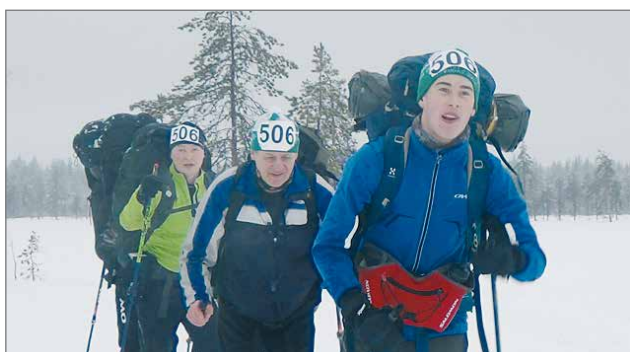
Sunnuntain pikataipaleella Kylmästä kankiat joukkue Oulun ympäristöstä.