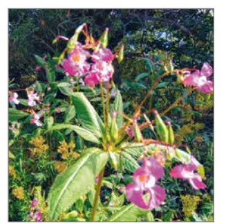
Kuvassa jättipalsami, EU:n haitallisten vieraskasvien listalla oleva laji, jota esiintyy alueellamme. Sen koti-seudulla Himalajalla kasvia käytetään myös ruokana.

Pudasjärvellä vieraskasvien hallintatyötä on tehty jo monin paikoin. Se onkin tärkeää, sillä alueen tiestöt ovat osa lajien leviämisyälyä pohjoiseen. Varsinkin arktisten alueiden luonto ja lajisto on herkkää. Ilmastonmuutoksen ja matkailun myötä haitallisten vieraslajien, tautien ja tuholaisien leviäminen etenee nopeammin. Viime kesänä tehtiin useita lupiinin ja palsamintorjunnan töitä. Siinä akti-