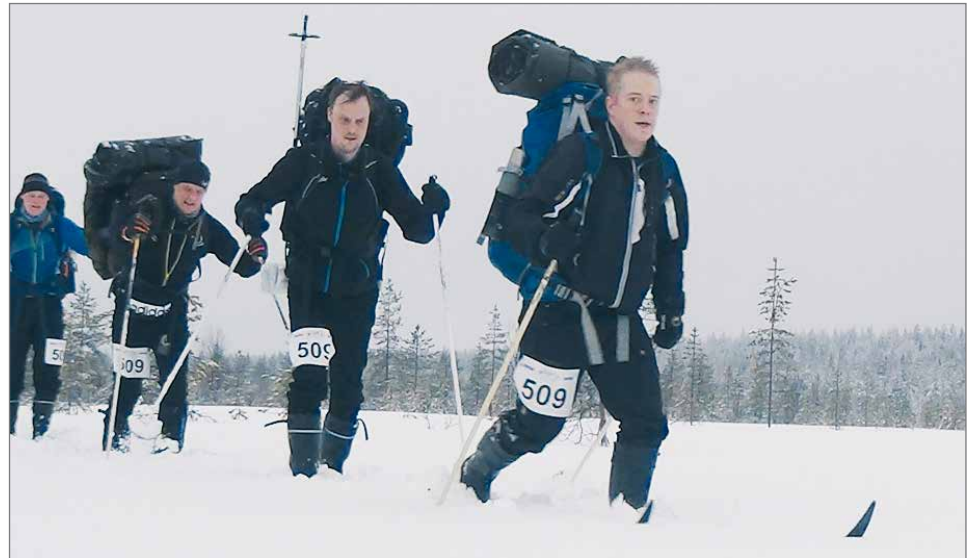
POIJJAT Sipoosta, Kempeleestä, Muhokselta, Helsingistä ja Pudasjärveltä sunnuntain pikataipaleella.