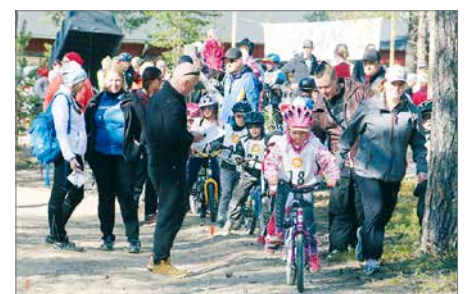
Pudasjärven Osuuspankki järjesti toukokuun lopulla Hippo MTB lasten maastopyörätahtuman Jyrkkäkoskella. Mukana oli noin 60 pyöräilevää lasta. Tapahtuma oli pankin historian ensimmäinen ja todennäköisesti ensimmäinen myös koko OP ryhmässä. Lisäksi OP järjesti paikallisten urheiluseurojen kanssa Hippo Yu-kisan, -hiihtokisan sekä -jalkapallokoulun.