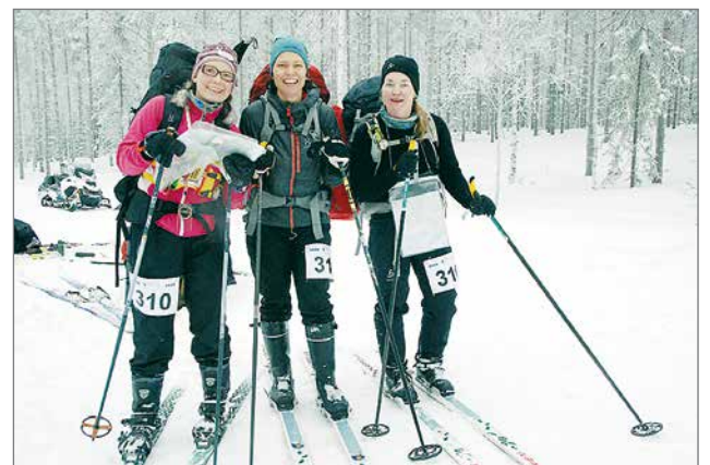
Team Snowflakes tehtävärastin kimpussa.