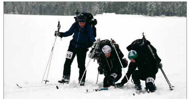
Kaveria ei jätetä, Lihakunnan joukkue kilpailutaipaleella.

Sunnuntain loppurutiinissa hiihtämään lähdettiin Palovaaran kupeesta yöleiristä kohti Rytinkisalmen tien viereen Kuopusjärven pohjoispäähän, jossa oli maali. Sieltä kilpailijoita ja huoltajia kuljetettiin linja-autoilla Pikku-Syötteelle, jossa oli saunominen, ruokailu ja palkintojen jako.