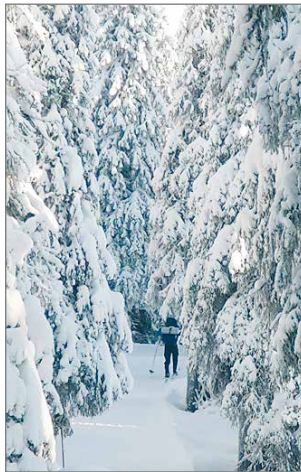
Kilpailija Ahmatuvan maastossa Syötteellä.

Kilpailijoita seurattiin Tracker-gps-paikannuslaitteilla ja heidän sijaintipaik-