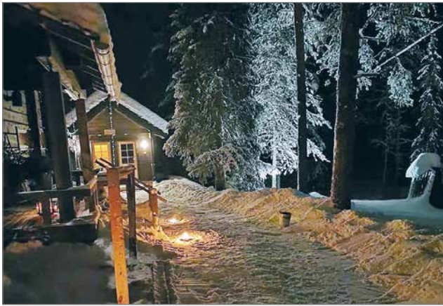
Kahvila sijaitsee Valtatieltä kuljettaessa noin 6 km ennen Syötettä.