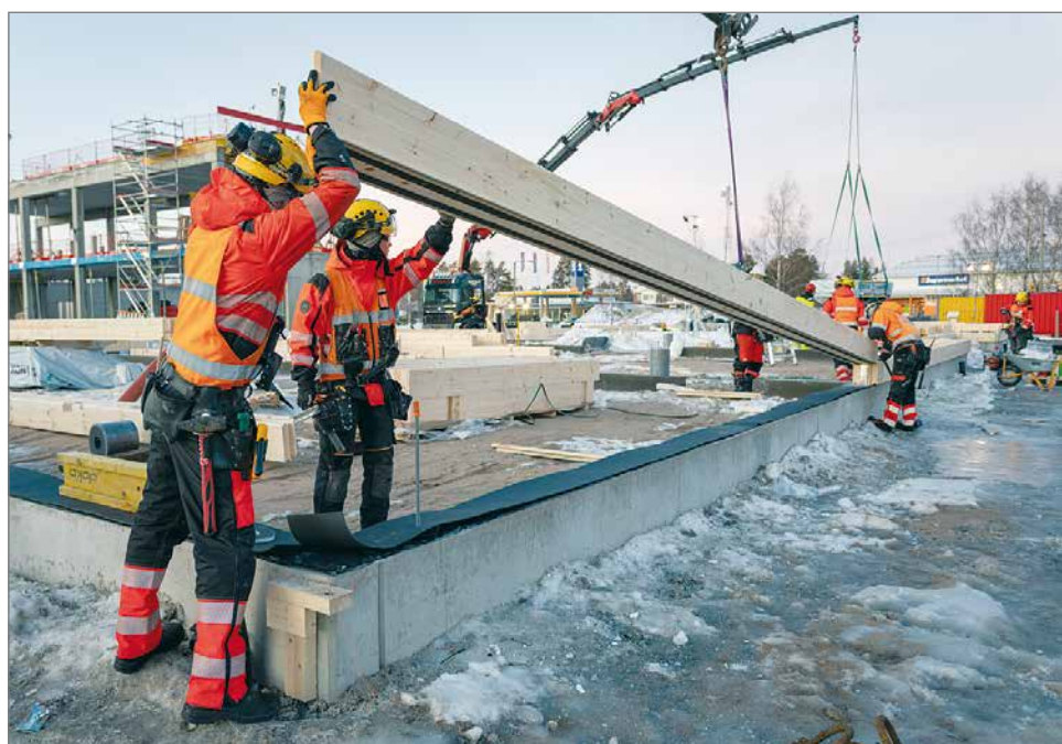
Hyvän Olon Keskusten rakennustyömaalla ovat menossa Kontiotuotteen toimittamien hirsien asentaminen. Kuvassa asennetaan ensimmäistä hirsikertaa tammi-helmikuun vaihteessa.

on käytetty 229 kuutiometriä hirttä, mikä sitoo noin 207 000 kiloa hiilidioksidia. Se vastaa noin 19 suomalaisen vuotuista CO2-päästöä tai peräti noin 1 479 000 kilometrin autoilua. Tuo ajomatka vastaisi pituudeltaan matkaa jopa 37 kertaa maapallon ympäri.