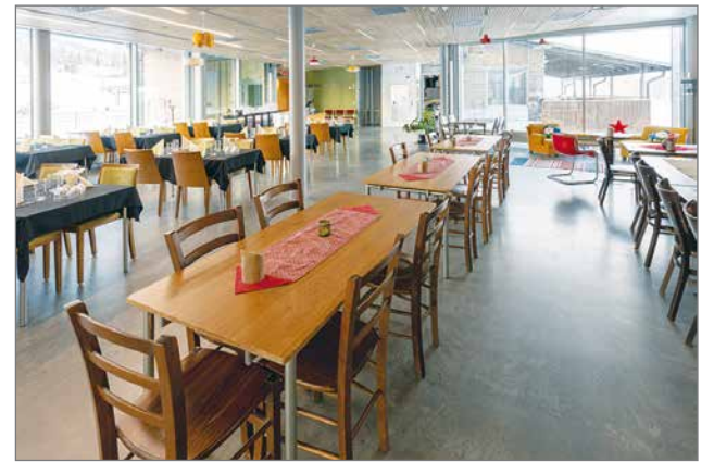
Tuba-Ravintolan huonekalut ja astiat ovat kierrätettyjä, koska näemme kauneutta vanhassa ja kestävässä, uskomme ettei kaiken tarvitse aina olla uutta. Kuva Juha Nyman/Pudasjärven kaupunki.

Syötteen tapahtumatarjonta monipuolistui, kun rinteiden juurelle avautui 6.12. tapahtumakeskus LumiAreena. Siellä matkailijoita viihdyttävät Suomen eturivin artistit ja monet mielenkiintoiset tapahtumat. Avoimien ovien päivänä tammikuussa salin täyteistä yleisö viihdytti muun muassa yli 20 hengen UPO-Uusi puhallinorkesteri. Kuva Juha Nyman/Pudasjärven kaupunki.