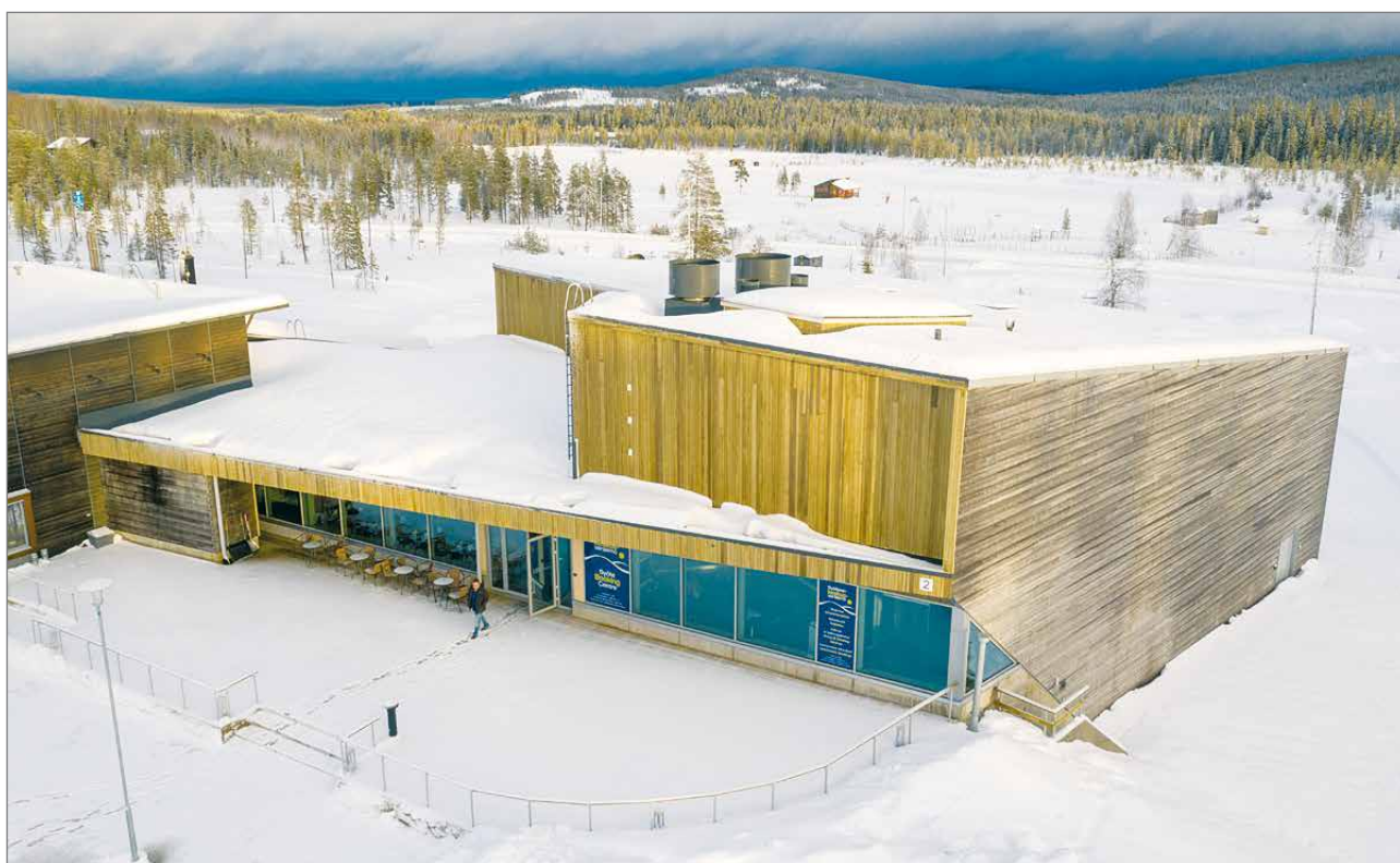
LumiAreenaan on sijoittunut Pudasjärven kaupungin matkailuinfo, Syötteen keskusvaraamo, ekohenkisen ravintola Tuban ravintolasali sekä KIDE Kuntosali.

LumiAreenaan on sijoitettu Pudasjärven kaupungin matkailuinfo, Syötteen keskusvaraamo, ekohenkisen ravintola Tuban ravintolasali sekä KIDE Kuntosali. Tilaa rakennuksessa on yhteensä 1400 neliometriä. LumiAreenasta löytyy 430 neliön kokoinen avara sali