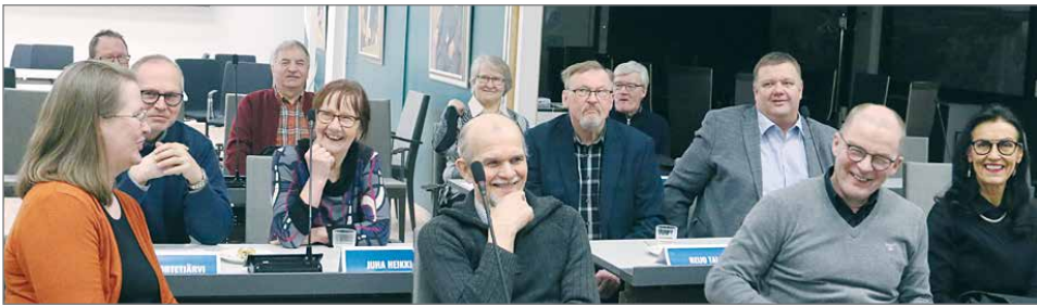
Keskustan valtuustoryhmä piti kokouksen jälkeen oman järjestäytymiskokouksensa.