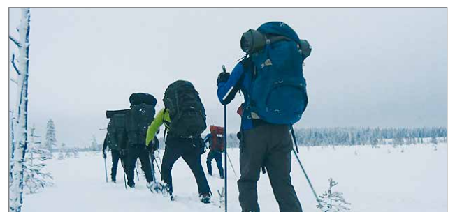
Maailmanmestaruus ratkotaan toisen kilpailupäivän umpihankireitillä, jonka pituus on noin kahdeksan kilometriä.