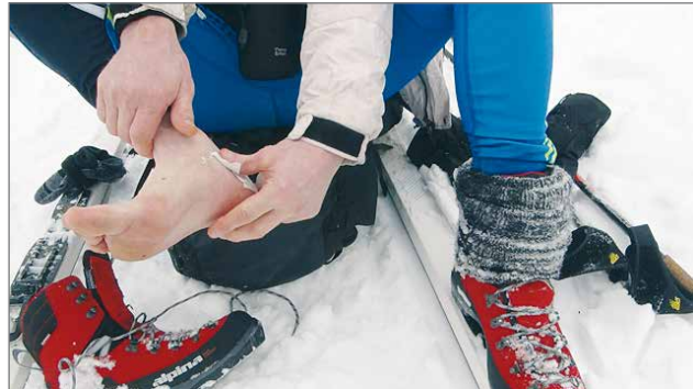
Itsestä huolehtiminen erämaassa on osa kisataitoa.

Kilpailijoilta saadun palautteen perusteella he olivat erittäin tyytyväisiä järjestelyihin ja itse kisaan.