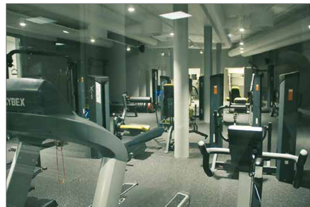
KIDE Kuntosalia käyttävät ahkerasti muun muassa KIDE hotellin asiakkaat.

- Jo alkumetreillä tiloissa järjestettiin esimerkiksi lastentapahtuma, erilaisia konsertteja ja seminaareja sekä myyntitapahtuma. LumiAreenan varaaminen yksityisiä juhlia, yritystapahtumia ja liikuntavuoro-