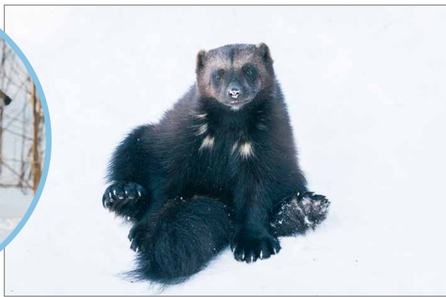
Meillä osataan poseerata.