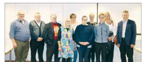
Pankki myönsi Sadasta toiselle rahastostaan toimintavuoden aikana yhteensä noin 7 000 euroa seitsemään eri hankkeeseen. Kuva elokuulla avustusten jakotilaisuudesta. Pankki on ollut mukana myös työllistämässä nuoria Kesäduuni-kampanjassa.