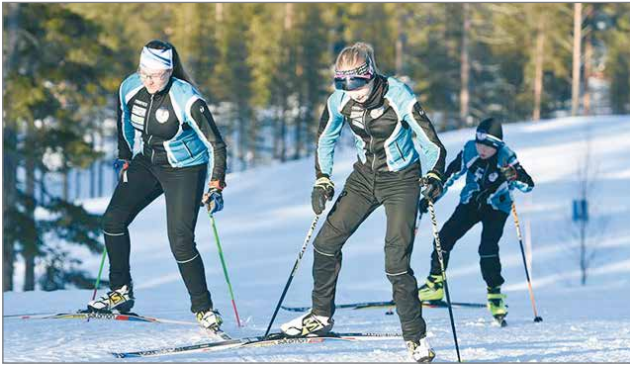
Taivalvaaralla järjestetään talven aikana useita hiihtotapahtumia, joissa pääsee aistimaan aitoa urheilutunnelmaa.

Taivalvaaran talviurheilukeskuksessa on profiililtaan helppoja, myös lapsiperheille soveltuvia rinteitä. Näiden yllättäessä voi poiketa rinnekahvilassa, joka on avoinna rinteiden ollessa auki. Jos omia suksia ei tullut mukaan, niin välinevuokrauksesta saa suksi- ja lautapakettien lisäksi mm. murtomaahiihtosuksia tai vaikka lumikengät, joilla pääsee seikkailemaan latuverkoston ulkopuolelle. Taivalvaaran alueella on 6,5 km valaistu latu sekä profiililtaan helppo, 15 kilometriä pitkä Ampumaradan latu. Pidempää lenkkiä pääsee sivakoimaan 25 kilometrin pituiselle Pahkakurun ladulle. Ampumaradan ladun varrella on Pikku-Tervalammen laavu ja Pahkakurun ladun varrella Pahkakurun laavu tulistelua ja evästäukopaikaksi.