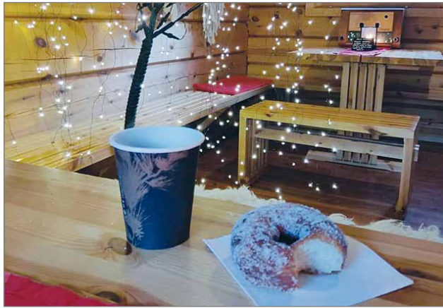
Pytky Cafeen kummatkin huoneet on kunnostettu käyttöön.