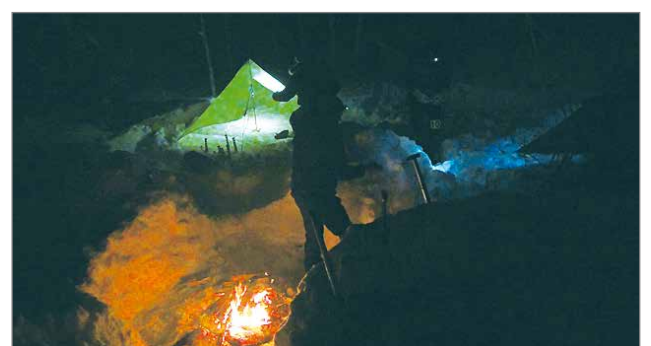
Yön kilpailijat viettivät ulkona tulilla, omassa mukana kulkevassa majoitteessaan.