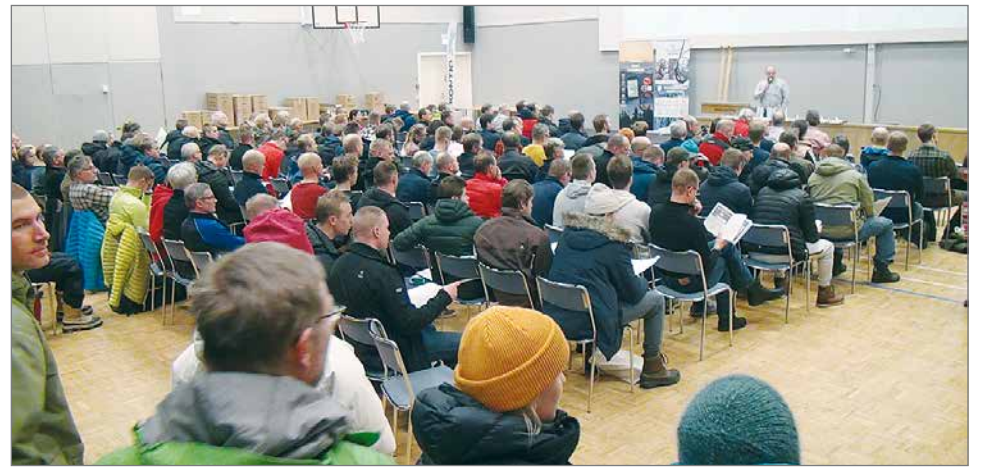
Kisojen tukikohta ja tiedotustilaisuus pidettiin Pikku-Syötteellä.

Heimo Turunen, kuvat Askko Jaakkola, Antti Lehto ja Heimo Turunen