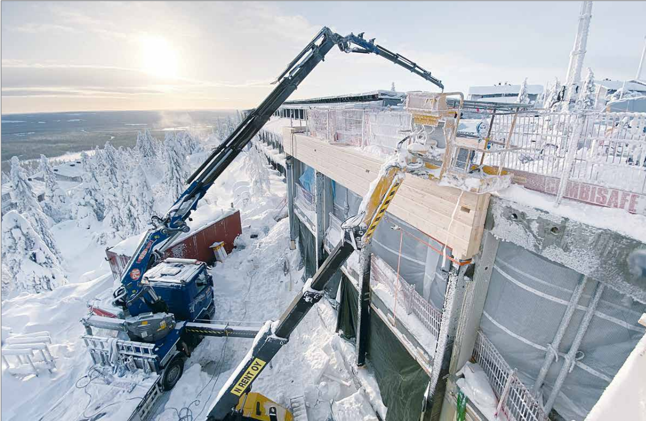
Hotelli Iso-Syötteen hirsirakenteet saadaan paikalleen helmikuun aikana ja maaliskuussa myös kattotyöt on tehty.