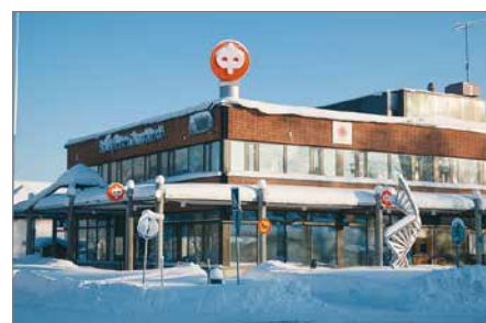
Pudasjärven Osuuspankki on palvellut pudasjärveläisiä jo yli 100 vuotta.