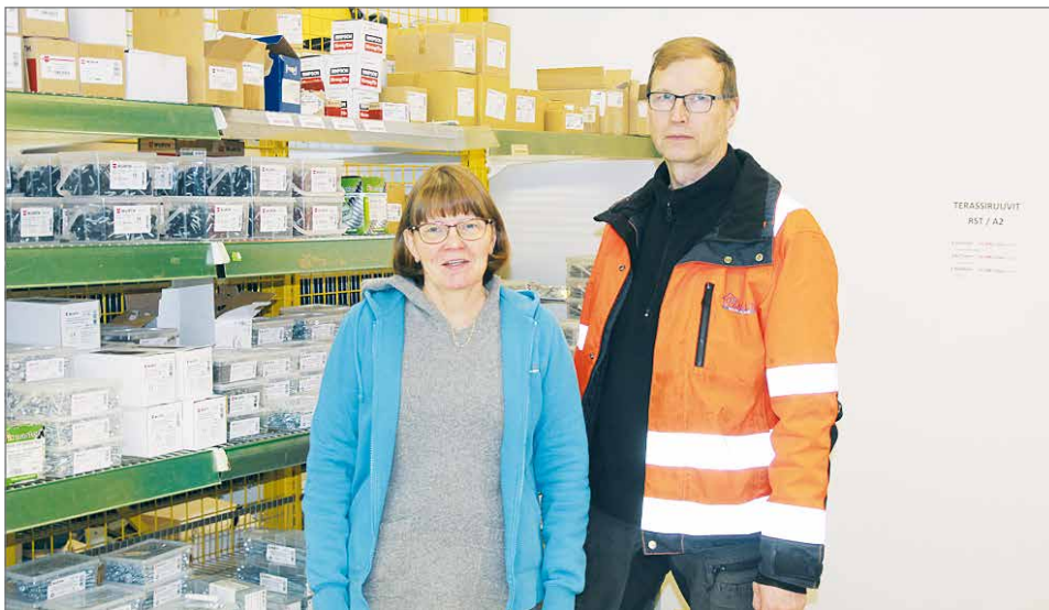
Pesiölä toimipiste on keskeisellä paikalla Taivalkosken keskustassa.

-Toimipisteessämme, eli varikolla myydään rakennustarvikkeita ympäri vuoden. Myyntipiste on auki aina kun joku on paikalla. Mikäli tulet kauempaa kannattaa varmistaa soittamalla, että tiedämme olla paikalla. Toukokuusta syyskuuhun on aina myyntihenkilökun-