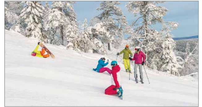
Laskettelijoita Iso-Syötteen rinteillä 27.1.

stand uppia ja esiintymään ovat tulossa muun muassa Raappana, Jarkko Martikainen ja Jesse Kaikuranta. LumiAreenalla on päivisin mahdollista harrastaa erilaisia palloilulajeja, lisäksi sen yhteydessä toimii iso ja laadukas KIDE Kuntosali, jonka 250 neliömetrin tila on jaettu laitesaliin ja voimailupuoleen.