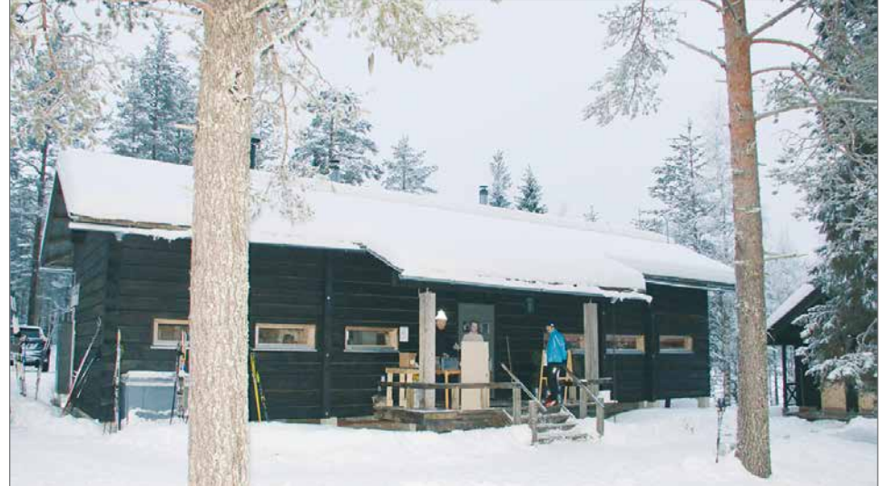
Pytky Cafe on ollut avoinna itsenäisyyspäivästä lähtien. Hiihtolomien alkaessa on avattu myös tilausravintola, jossa tarjotaan lähiruokaa.

Monipuolinen latuverkosto mahdollistaa hiihtämään lähden Syötteen alueen joka puolelta ja hiihtäjä voi kätevästi tutustua saman hiihtolenkin aikana sekä Iso-Syötteen että