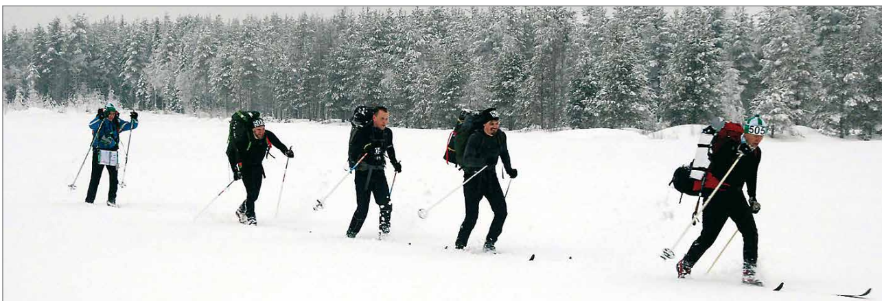
Kiinteistöneliön joukkue tulossa maaliin.