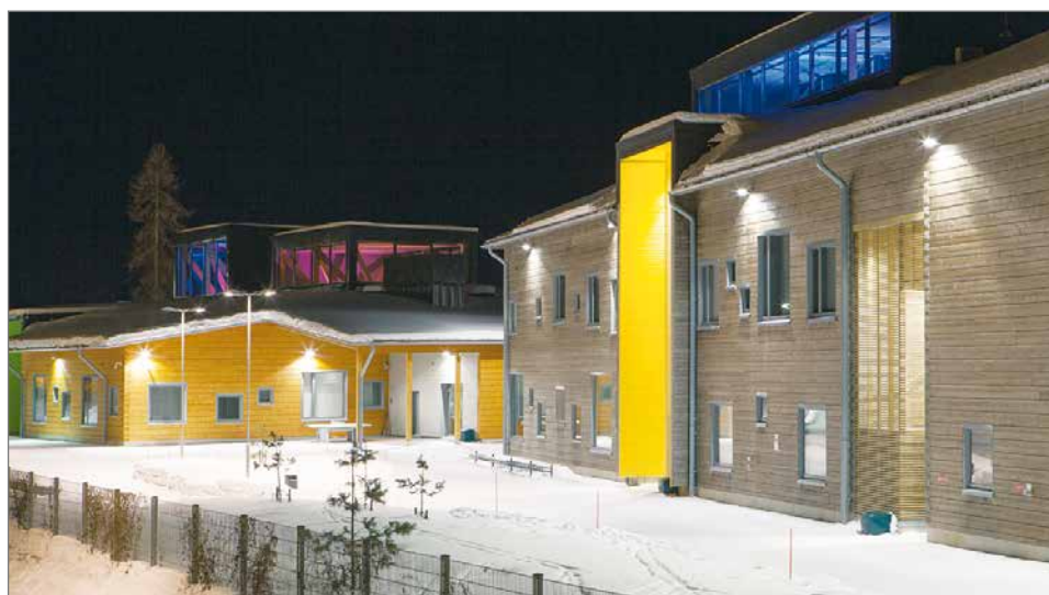
Pudasjärven tunnetuin hirsikohde on ollut maailman suurin hirsirakenteinen koulu, Hirsikampus, joka sai vuonna 2016 Puupalkinnon ja valittiin Pohjois-Suomen rakennusteoksi.