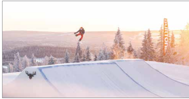
Lumilautailijat ottivat toisistaan mittaa QKLS Tourilla tammi-kuussa.

Ravintola Tuba hyödyntää paikallisesti tuotettuja raaka-aineita ja panostaa ekologisuuteen muun muassa hävikiin minimoimisella. Tuban listalta löytyy aina myös kasvissyöjille ja vegaaneille sopivaa syötävää. Tubassa ja LumiAreenalla järjestetään kauden aikana laaja kattaus erilaisia tapahtumia ja keikkoja. Hiihtolomaviikoilla 8-10 ohjelmassa on burleskia,