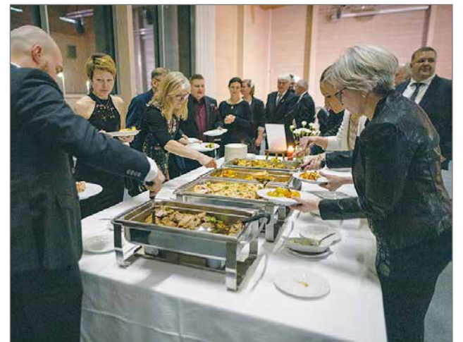
Tubassa tarjotaan maistuvaa, käsityönä tehtyä ruokaa laadukkaista raaka-aineista.

Ravintolassa hyödynnetään mahdollisimman paljon lähialueella tuotettuja raaka-aineita ja Tuban lähiruokakumppaneina on useita Pudasjärven ja lähikuntien tuottajia. MTR