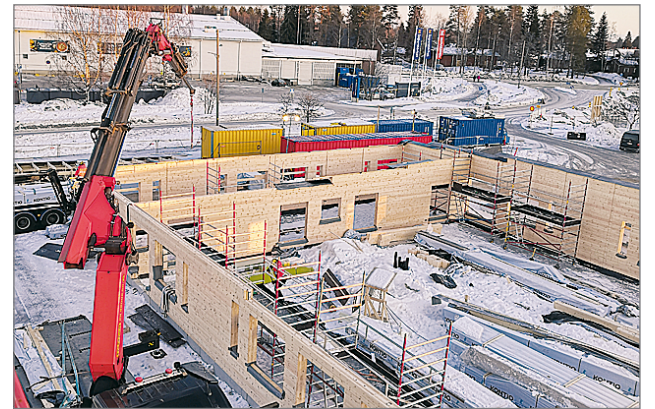
Elokuussa 2019 aloitettu Hyvän olon keskuksen rakentaminen etenee suunnitelmien mukaan ja A- sekä B-lohkojen hirret on asennettu paikalleen.

Hyvän Olon Keskuksesta pilotoidaan ympäristöministeriön uutta rakennusten hiilijalanjäljen arviointimenetelmää. Hiilijalanjäljen arviointimenetelmää. Hiilijalanjäljen arviointimenetelmää. Hiilijalanjäljen arviointimenetelmää. Hiilijalanjäljen arviointimenetelmää.