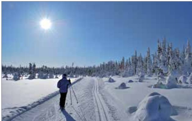
Ahmankierroksella saa nauttia niin avarista suomalaisemista kuin lumisista tykkykuusista.

Luontokeskukseseen on vapaa pääsy, tervetuloa tutustumaan!