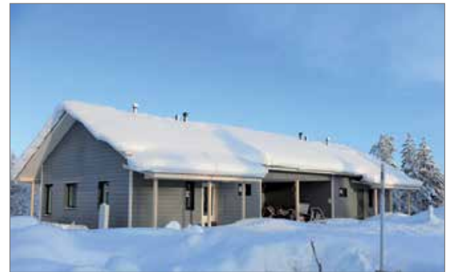
Iso-Syötteen tunturin juurella Ollukan kaava-alueelle on valmistumassa parihuvila.

Taivalkoski- Pudasjärvi alueella toimiva Tolosen rakennusyritys työllistää keskimäärin kuudesta kahdeksaan työntekijää, sekä lisäksi alihankkijat. Tolosen itsensä vastuulla on rakennustöiden organisointitehtävät sekä työkohteiden suunnittelu ja toteutus.