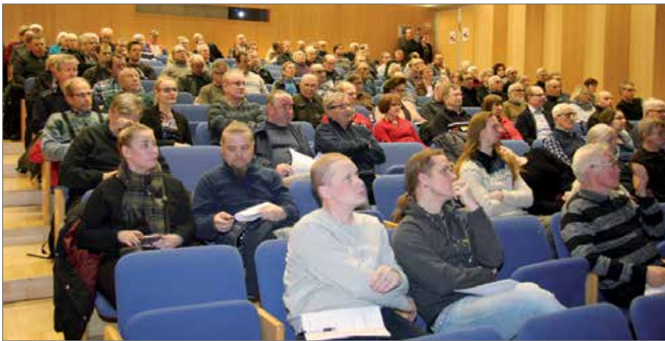
Oulun pääkirjastolla 8.2. järjestetystä tilaisuudesta oli väkeä tuvan täydeltä.

Kuntalaisten kyselytunnin osallistui toistakymmentä henkilöä, joista useimmat olivat nuoria. AK