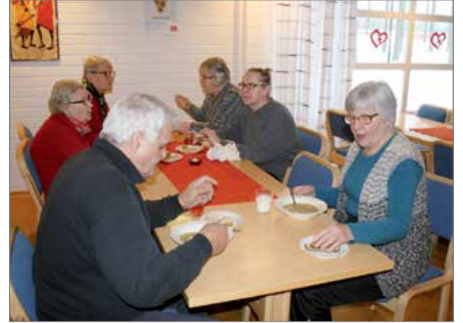
Yhteisvastuu lounaalla riitti ruokailijoita pitkin päivää.