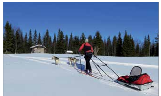
Rytivaaran varaustuvalla kulkee talvireitti Toraslammien autiotuvan kautta.