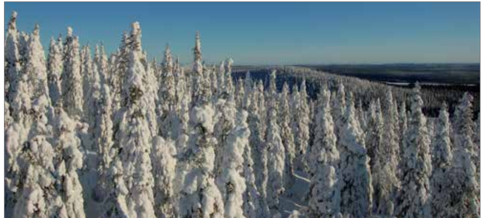
Nousu Ahmavaaraan tarjoaa upeat tykkymaisemat Syötteen kansallispuistoon.

Kansallispuiston talvireiteillä voi liikkua läskipyörällä, hiihtäen tai vaikka lumikengin. Reitit kulkevat samoille tuville kuin hiihtoladutkin, mutta hieman eri kautta. Kartan talvireiteille voi lunastaa luontokeskuksesta. Reittejä ylläpidetään moottorikelkalla, ja niiden huolto perustuu kansallispuiston ylläpidon tarpeisiin, mikä tapahtuu pääasiassa arkiviikolla. Ahmakallion näkötorni sekä Rytivaaran kruununmetsätorppa ovat saavutettavissa talvireiteillä myöten. Rytivaarassa retkeilyjä palvelee saunallinen varaustupa.