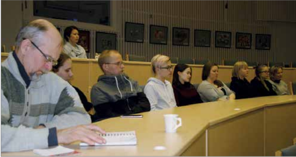
Kuntalaisten kyselytunti kiinnosti nuoria.