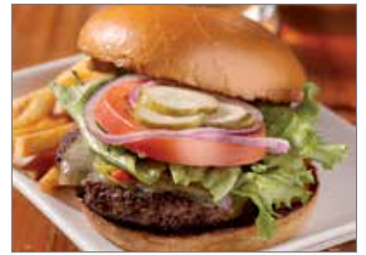
Tunturi Pubista Pizzaa ja burgereita – lähiruokaa oman porotilan antimista.