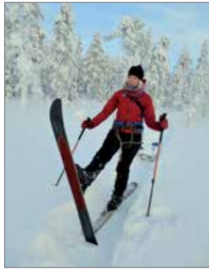
Karvapohjaisilla liukulumi-kengillä kulku sujuu helposti maastossa kuin maastossa.

Vattukurun sekä Kellarilammen parkkipaikat aura-taan tänä talvena retkeilyjä varten. Vattukurussa on rei-