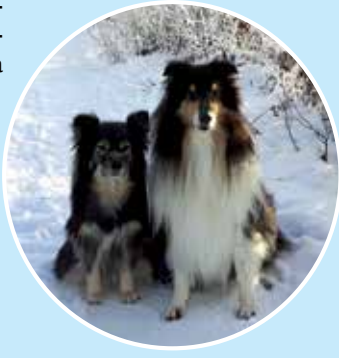
Kirjoitteli lapinkoiratyttö Niehka, tarinassa mukana Zorro ja Lahja

Muistakaa ihmiset, että ystävänäpäivä on joka päivä, ei vain kerran vuodessa. Pitäkää hyvää huolta ystävistänne ja muistakaa heitä!