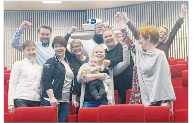
Sotenoste-verkosto kokosi yrittäjät yhdessä kehittämään liiketoimintaansa ja alueen monipuolisia palveluita.