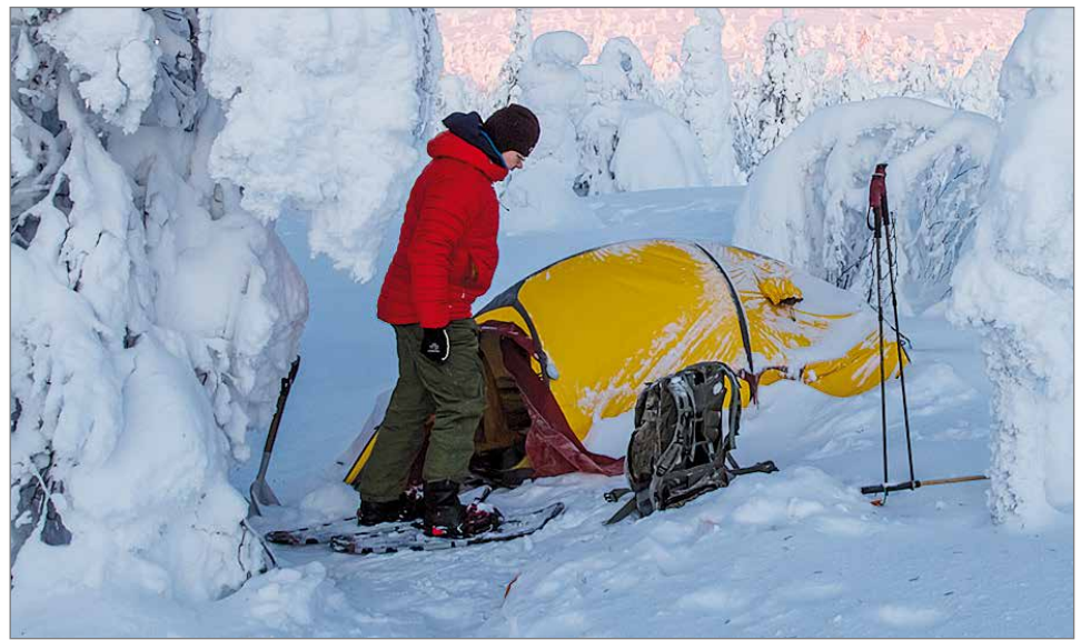
Muutama vuosi sitten kävin talviretkellä tammikuun alussa Muoniossa Pallaksen tunturi-alueella.