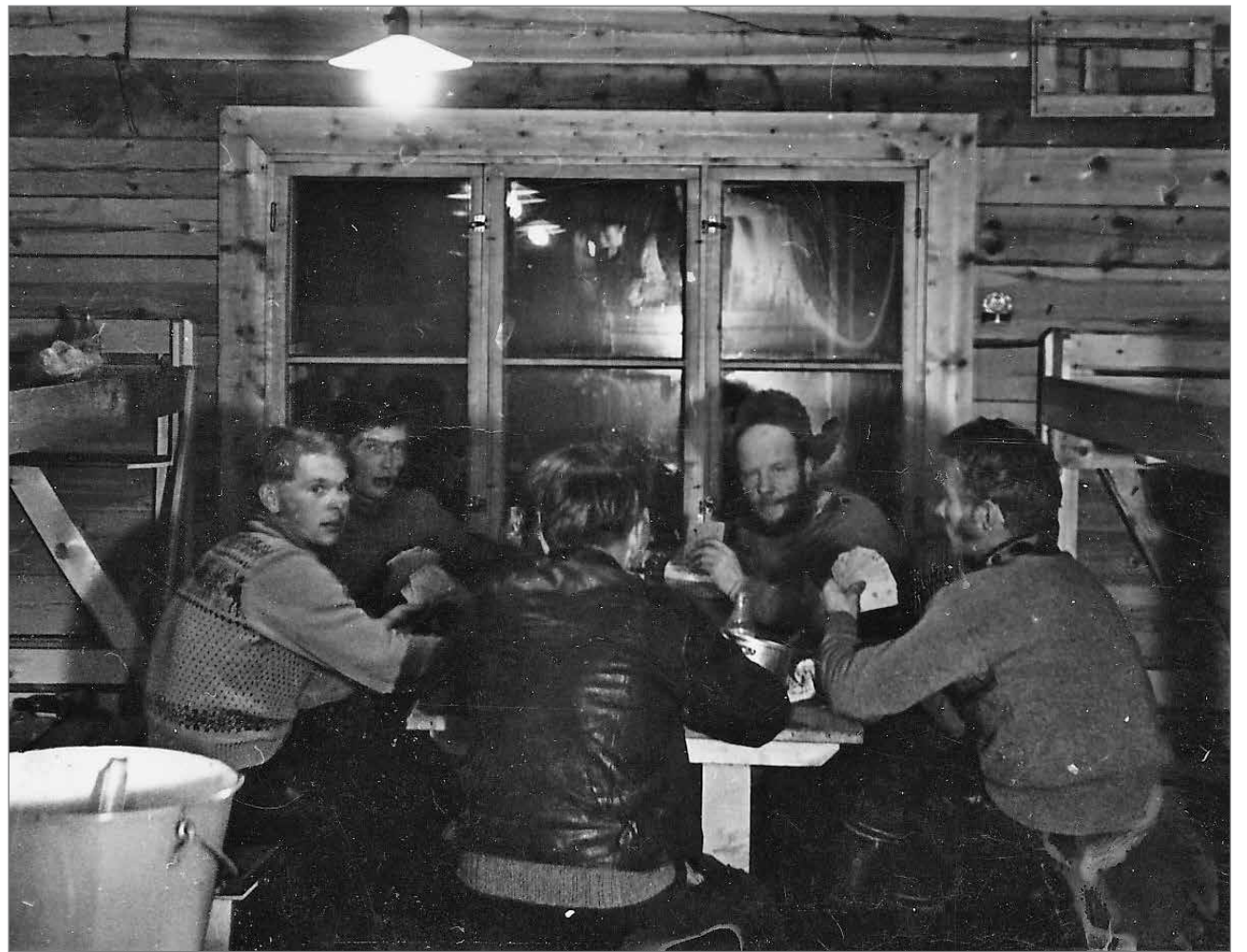
Kämpillä iltoja käytettiin kortinpelaamiseen ja myös erilaisien voimankäytön kilpailuihin.