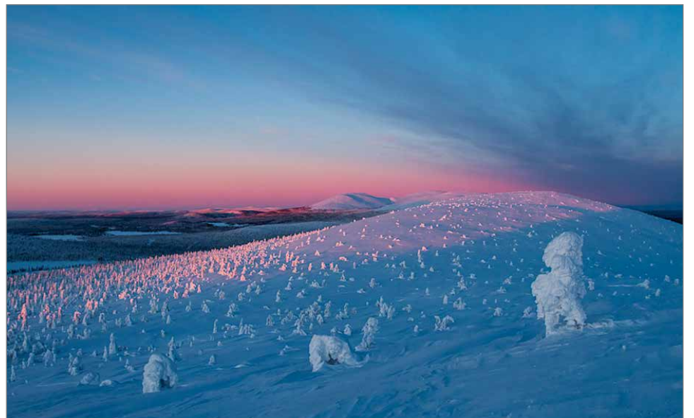
Tuo keskipäivän hetki kesti vain noin 20 minuuttia, mutta onnekseni olin oikeassa paikassa oikeaan aikaan ja sain taltioitua ainutlaatuisista valoa ja sävyjä sisältävän hetken.

talviretkellä tammikuun alussa Muoniossa Pallaksen tunturi-alueella.