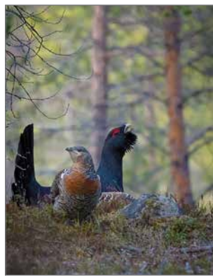
Metsokukko ja paikalle saapunut koppeloneito olivat hippasilla kuvauspiiloni ympärillä.

Toinen mieleen painunut hetki sattui ollessani kuvamassa metson soidinta. Hy-