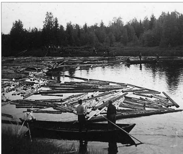
Uitto oli tapahtuma, joka oli aina keväinen tarinapäätös.

Savottaa voidaan verrata siis isohkoon yritykseen, joka toimi erillään yhteiskunnasta ja pärjäsi omillaan. PUI