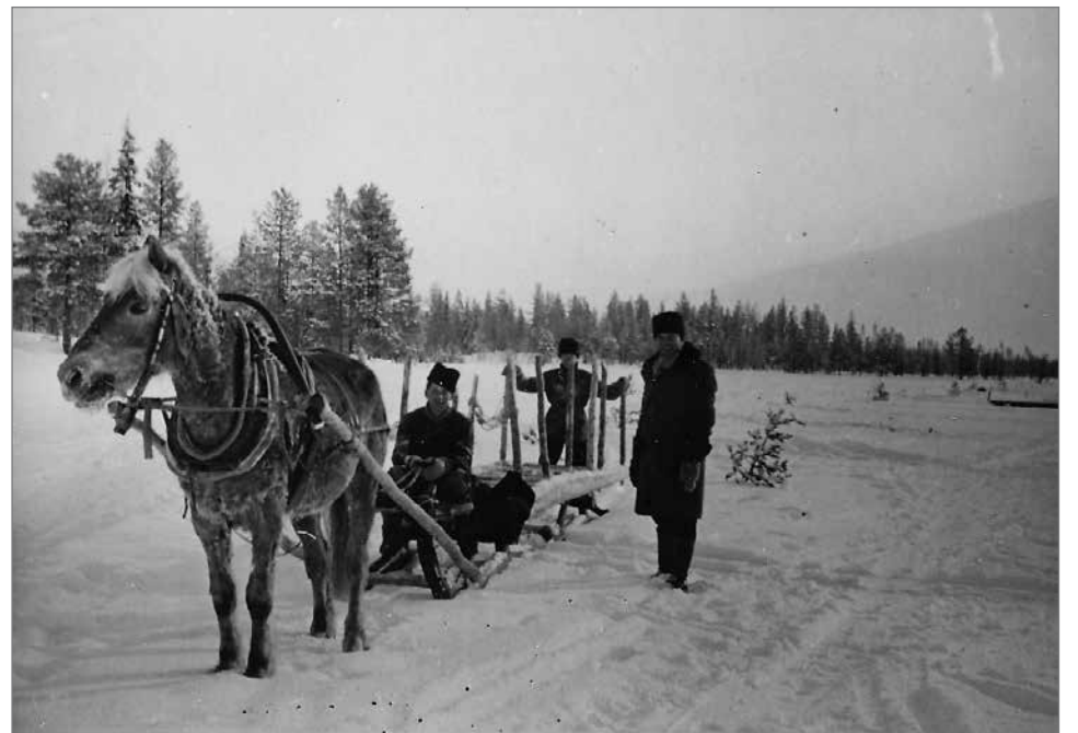
Hevonen oli savotoitten kuljetusväline. Kuljetusreitit jäädytettiin ja niinpä voitiin kuljettaa jopa 50 tukin kuormia.