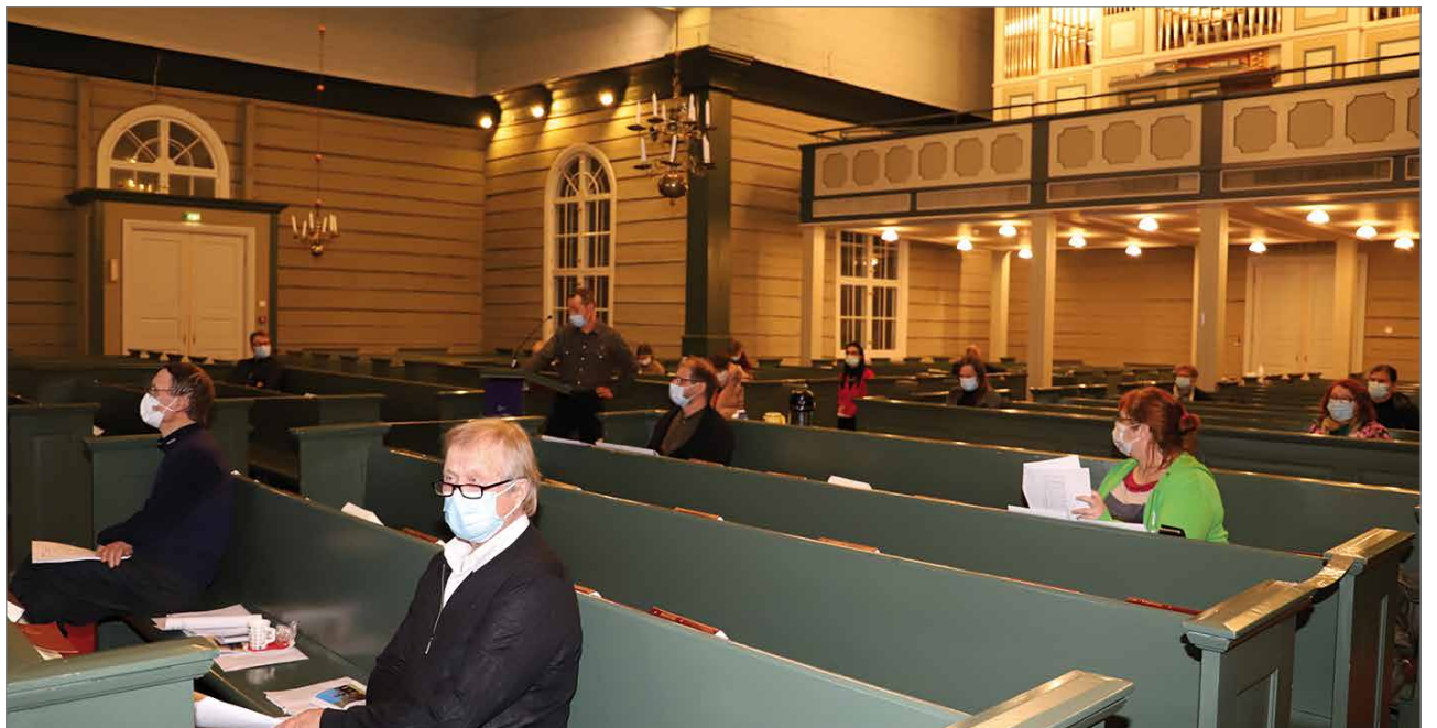
Kirkkovaltuuston kokous pidettiin kirkossa, joka mahdollisti hyvät turvavälit.