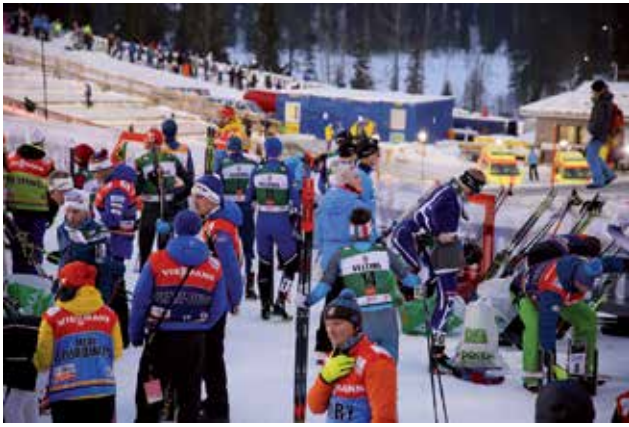
Yhdistetyn hiihdon lähtijät valmistumassa lähtöön.

Rukalla järjestettiin marras-kuussa pohjoismaisten lajien eli maastohiihdon, mäkihypyn ja yhdistetyt maailmancupin osakilpailu. Siihen osallistui noin 400 urheilijaa 30 maasta huoltajineen. Katsojia oli yli 20 000 ja median edustajia 400. Tätä porukkaa palveli 700 talkoolaisen hyvin organisoitu joukko, johon kuului myös Oulun seudun ammattiopiston (OSAO) Pudasjärven yksikön matkailualan opiskelijoita opettajineen yhteensä 17 henkilöä. Opiskelijat antavat kisakokemuksesta täyden kympin. Heidän tavoitteena oli saada käytännön kokemusta asiakaspalvelusta kansainvälisessä työympäristössä sekä itsenäisestä työskentelystä vastuineen.