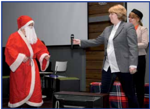
Lukion esiintyjät kuvailivat myös hieman lähitulevaisuutta ja arvelivat joulupukin saavan presidentinvaaleissa äänivyöryn, koska tämä täyttää lahjatoiveita eikä leikkaa mitään.