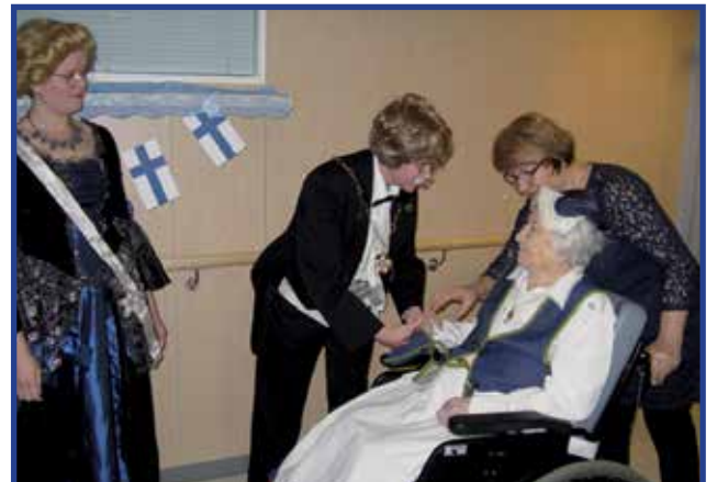
Eeva kansallispuvussa omaisensa kanssa tervehtimässä Kurenkartanon presidenttiparia.