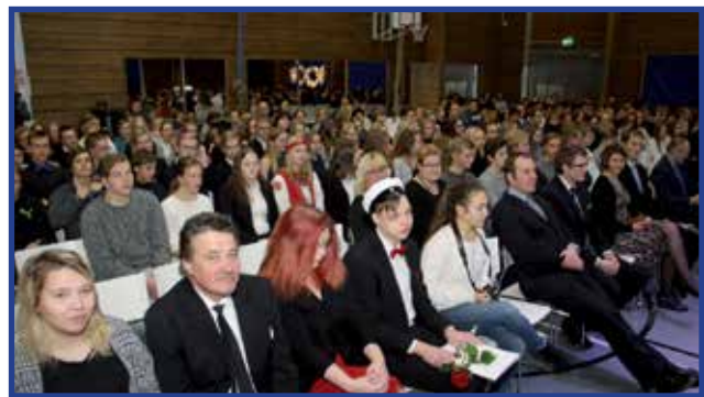
Koulujen kolmas itsenäisyysjuhla 5.12. alkoi ylioppilasjuhlaosuudella.