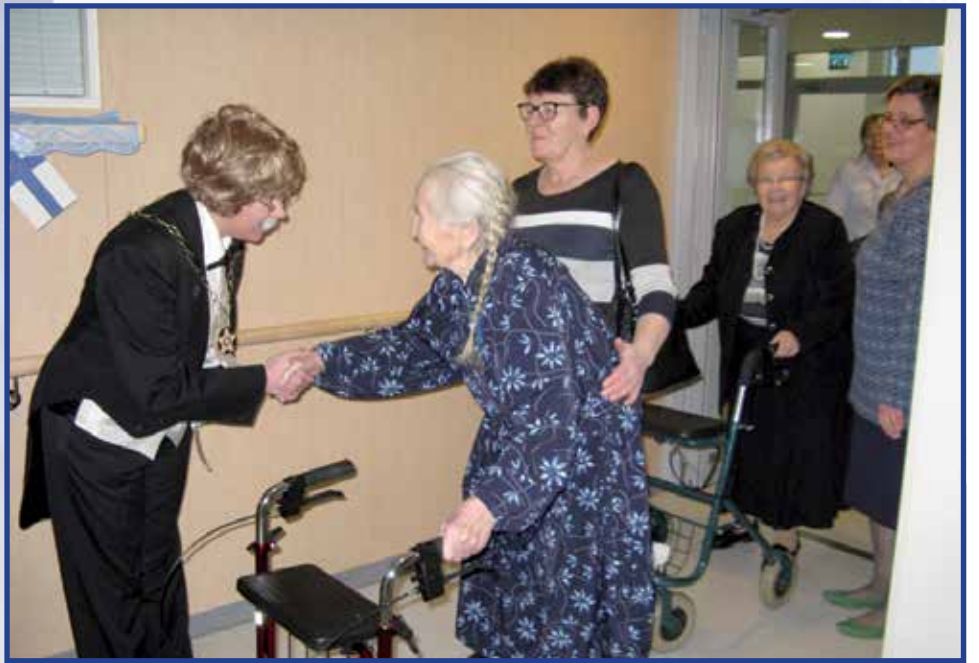
Hilma-veteraani omaisensa kanssa tervehtimässä juhlan isäntää.