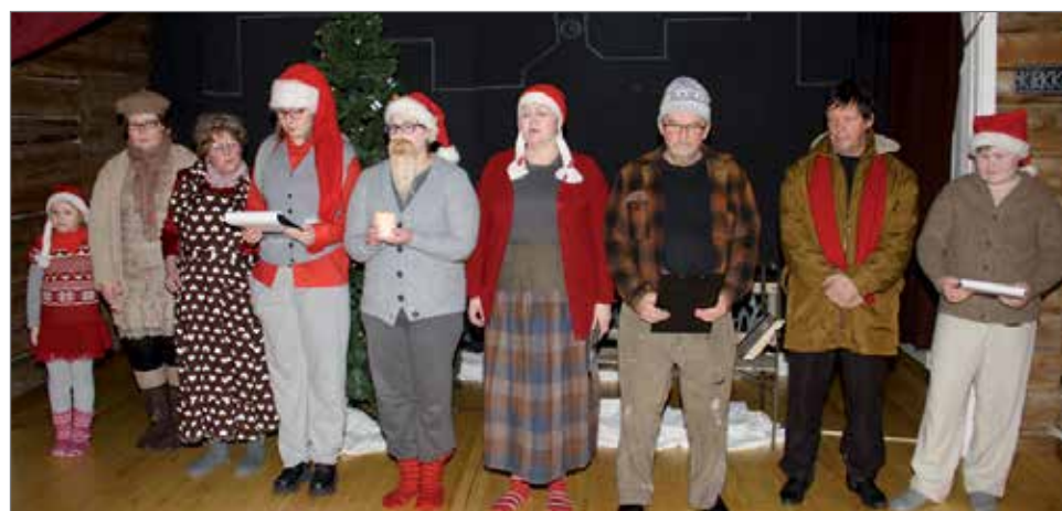
Lauluja esitettiin erikseen ja yhdessä.

Näytelmä poikkesi aiemista myös roolitusten osalta. Lähes kaikilla näyttelijöillä oli monta roolia, mikä asetti omat haasteensa esityksiin muun muassa nopeat vaatteiden vaihdot. HT