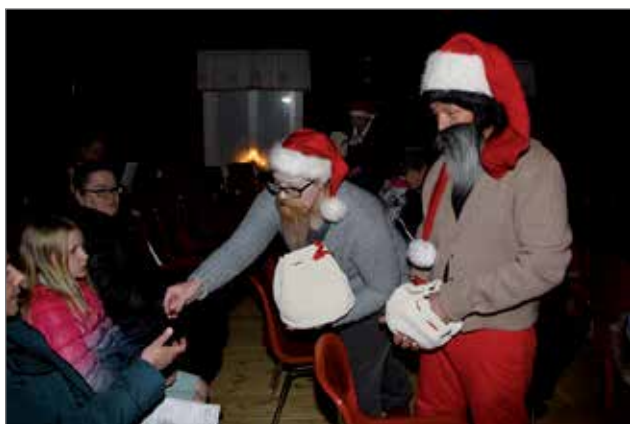
Yleisölle jaettiin välillä makeisia.

ki pohti eri joululahjoja sekä joulun merkitystä ja sen viettoa. Hän totesi, että joululahjana voisivat olla pienet asiat ja parasta on yhdessä olemisen. Hän toivotti kaikille hyvää mieltä - terve sielu terveessä ruumiissa.