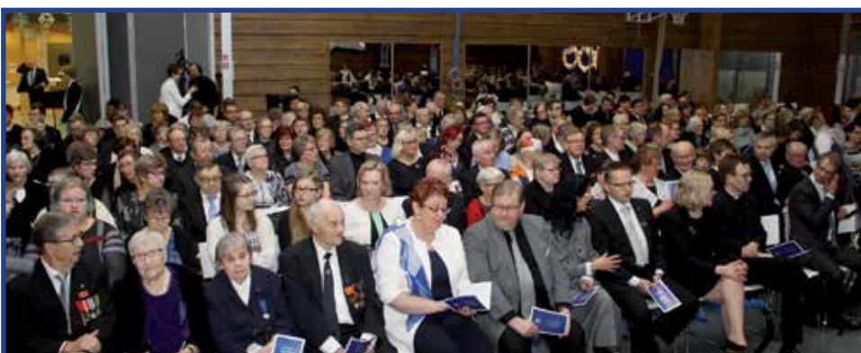
Itsenäisyysjuhlaan Hirsikampuksen juhlasalissa osallistui noin 300 henkeä.

Pudasjärven kaupungin ja seurakunnan järjestämää Suomi 100 -itsenäisyysjuhlaa vietettiin itsenäisyyspäivänä keskiviikkona 6.12. Juhlallisuudet alkoivat juhlahuoneeseen Pudasjärven kirkossa, jonka lopuksi laskettiin kaupungin ja seurakunnan seppeleet sankarimuistomerkille. Sankarihaudoilla oli 40 vapaaehtoista miestä kunniavartiosta. Sieltä siirryttiin Hirsikampukselle juhlahuoneeseen ja pääjuhlaan. Siihen kuului puheita, korkeatasoisia ja monipuolista musiikkiohjelmia sekä lukion teatterikurssin musiikkikuvaelmaa Suomen itsenäisyyden eri vuosikymmeniltä. Lisäksi luovutettiin kulttuuristipendit ja juhlan lopuksi paljastettiin sankarivainajien muistolaatta Hirsikampuksen aulassa.