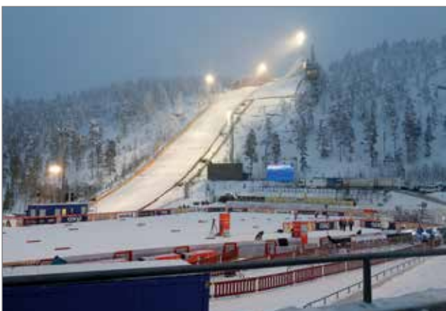
Jannen työpaikka mäessä hyppyrin vieressä.