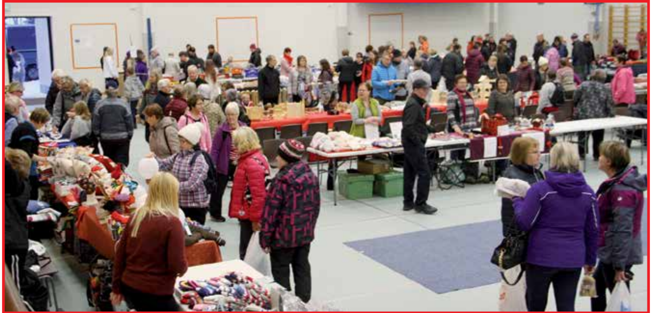
Joulumyyjäisten aikaan Sammelvuon -sali täyttyi myyjistä ja ostajista.