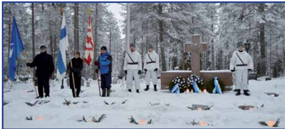
Jumalanpalveluksessa. Sen jälkeen juhlaväki siirtyi seppelten laskuun sankarihaudoille.

ehostettu havuasetelmin ja jokaisen muistolaatan kohdalla paloi kynttilä. Kunnivartiossa olivat samaa ikäpolvea olevat nuoret miehet kuin isänmaan puolesta hen-