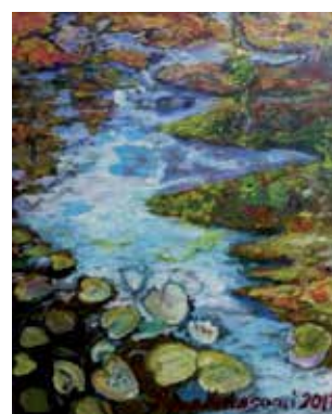
Iloitseva suokumpareisto, 2017

Olen maalannut lähes 40 vuotta. Aloitin maalaamisen öljyväreille, nykyisin työskentelen pääasiassa akryyli- väreillä. Työelämän aikoihin maalaaminen oli vähäistä.