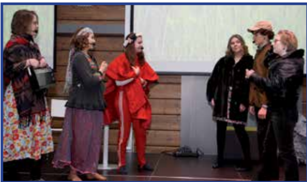
Lukiolaisten musiikkikuvaelmassa on päästy -60 luvulle, jossa hippinuorten asuissa olevilla nuorilla oli periaatteen rakentaa maata rakkaudella ja rauhaa rakastaen. Tosikot oikealla olivat tosin eri linjoilla.