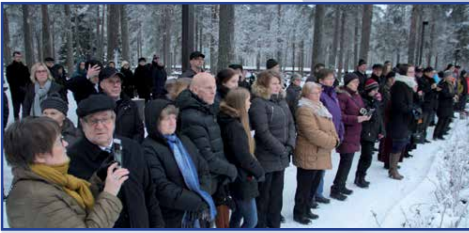
Kirkosta siirryttiin osallistumaan seppeleiden laskemiseen sankarihautausmaan muistomerkille.