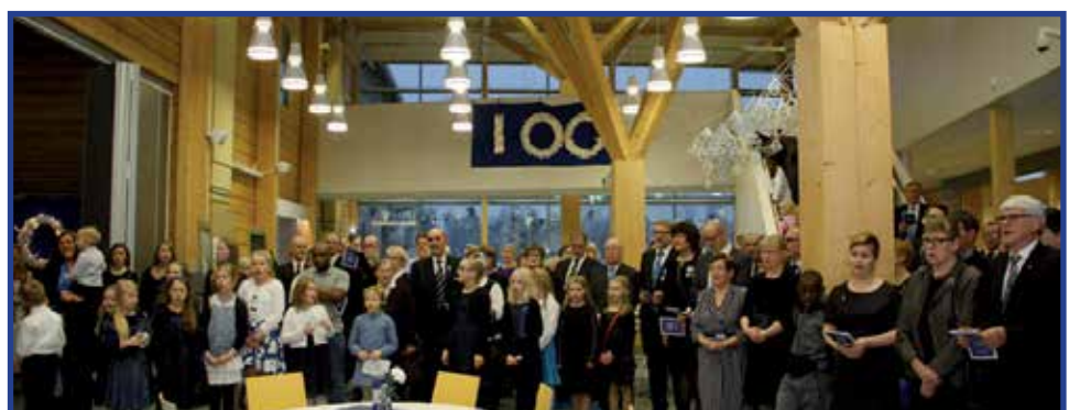
Juhlayleisö siirtyi juhlasalista Hirsikampuksen aulaan seuraamaan sankarivainajien muistolaatan paljastusta.