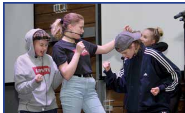
Lukion teatteriryhmäläiset esittivät 7-veljeksen vaiheita Suomen itsenäisyyden eri vuosikymmenillä. Kuvassa juhlietaan MM95-jääkiekkoa, jossa Suomi kaatoi loppuottelussa Ruotsin ja sai MM-kultamitalit.