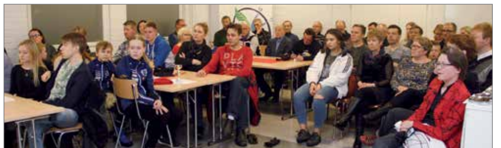
Pudasjärven Urheilijoiden syyskokoukseen osallistui väkeä tuvan täydeltä Puikkarin tiloissa.