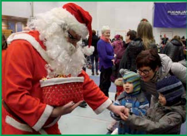
Joulupukki, joka kertoi iäkseen 900 vuotta, kierteli ahkeraan jututtamassa myyjäisyleisöä ja jakamassa karkkeja lapsille ja kaiken ikäisille.