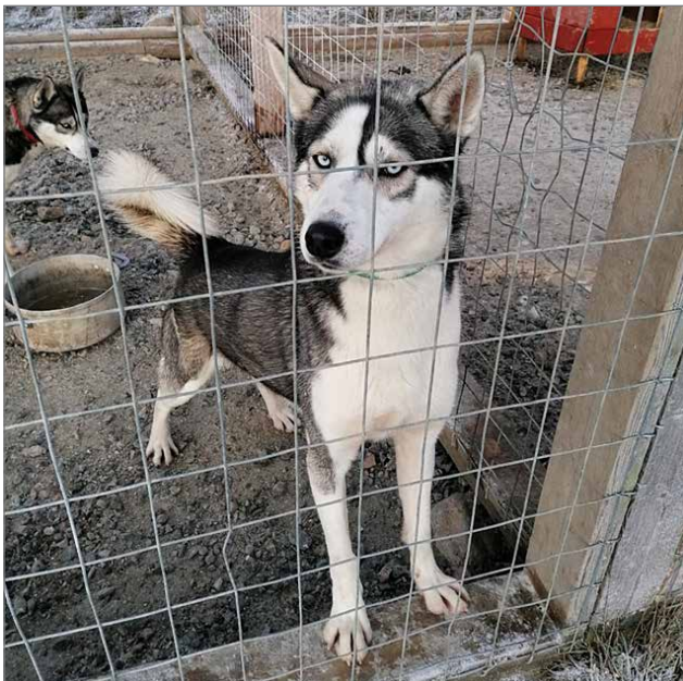
Syötteen koiratarhan huskyt lähettivät omat tervetulo- ja joulunavaukseen.