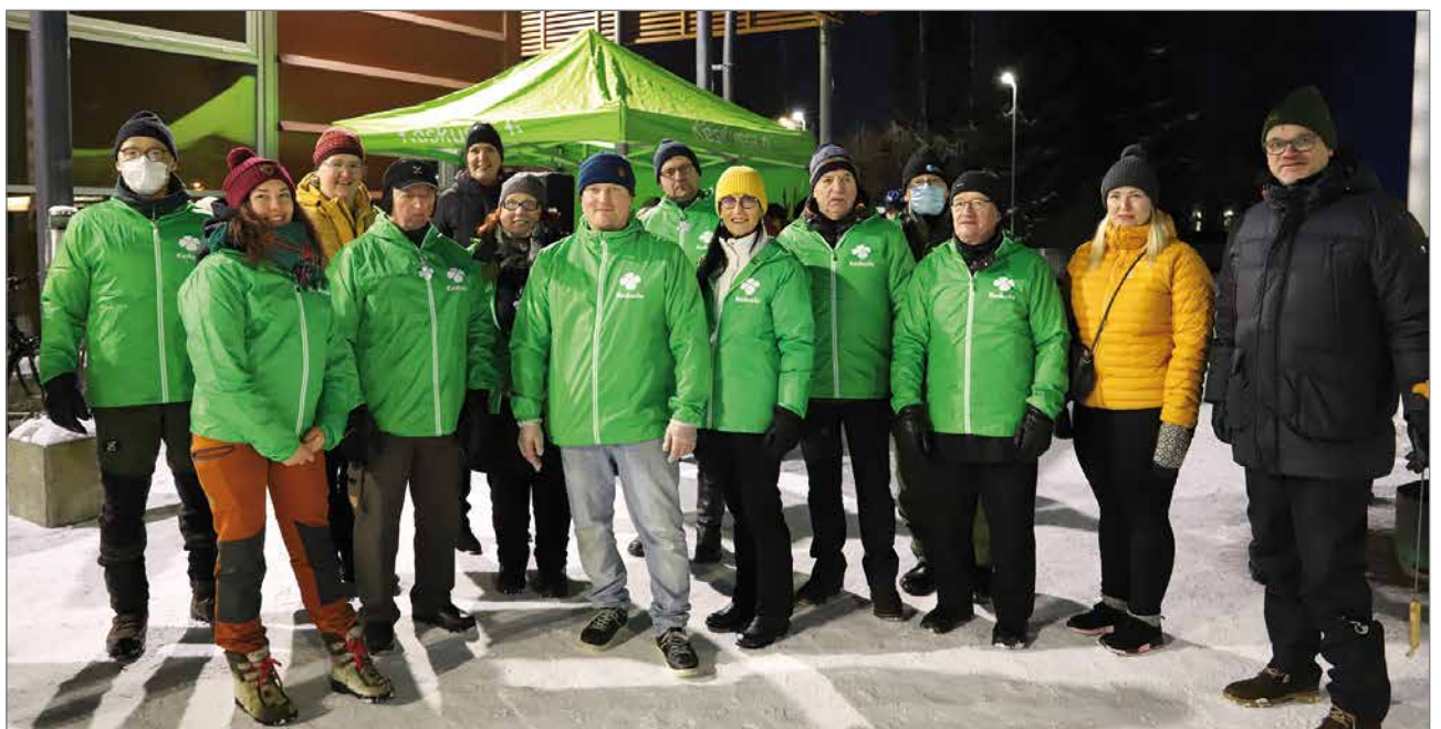
Keskusta Pudasjärven kuntavaaliehdokkaat ja järjestöaktiivit olivat paikalla upouusissa Keskustan takeissa.

Kansanedustaja Juha Sipilä huoletti valtion velan kasvaminen, vaikkakin näki perusteltuna kuntien ja yritysten tukemista lisää velkaottamalla. Työpaikkojen säilymisestä myös Sipilä kantoi