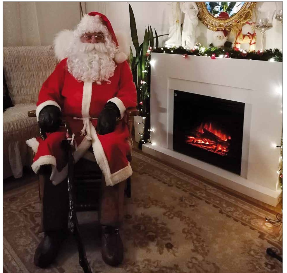
Joulupukki lupasi kaikille lapsille ja lapsenmielisille, että kyllä hän vierailee myös tänä jouluna ja jättää lahjat oven taakse.