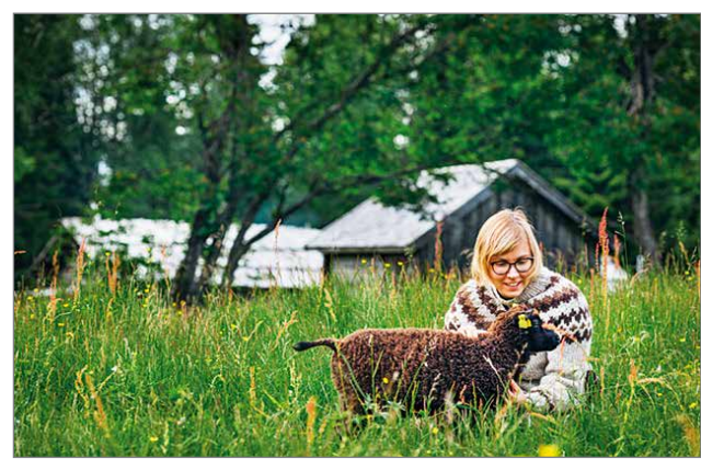
Lammaspaimenviikoista on saatu hyviä kokemuksia Rytivaarassa.

Sotkajärvellä suunnitel-laan perinnebiotooppina arvokkaiden tulvaniityjen