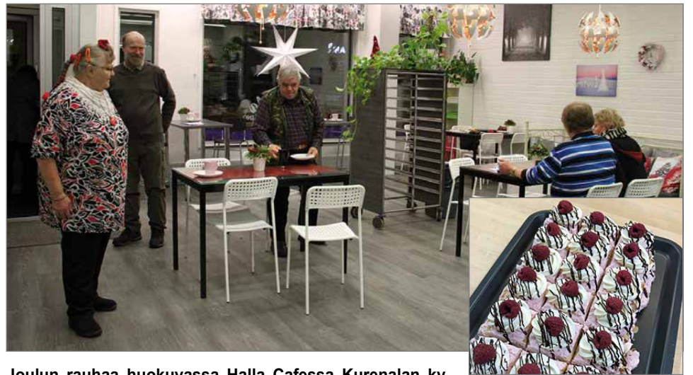
Joulun rauhaa huokuvassa Halla Cafessa Kurenalan kyläyhdistys kokoontui Syyskokouksen merkeissä, turvavälikokouksien.