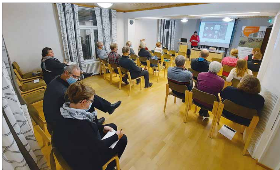
Maisemanhoitoilta kiinnosti, sillä paikallaolijain lisäksi etäyhteydet tavoittivat väkeä kauempaakin pitäjältä.