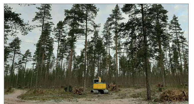
Suvisuurojen järjestäjät ovat aloittaneet metsänkäsitteilyn jälkeen kantojen irrottamisen konetyönä ja kokoamisesta kaupungin osoittamaan läjityspaikkaan.

-Kentän piennaralueiden laajeneminen ja vesakoiden niitto parantavat myös lentoturvallisuutta. Oikaraisen mukaan puuston harventaminen mahdollistaa turvallisen liikkumisen hevosharrastajilla, lenkkeilijöille, hiihtäjille ja muille luonnossa liikkujille. Oikarainen kiittää kaupunkia ja muita yhteistyökumppaneita hyvästä yhteistyöstä. Hän arvioi, että Pudasjärven lentokentän keskeisestä sijainnista ja määrätietoisesta kehittämisestä johtuen Jyrkänkösken alueesta rakentuu Pohjois-Suomen merkittävä monimuotoinen urheilu-,