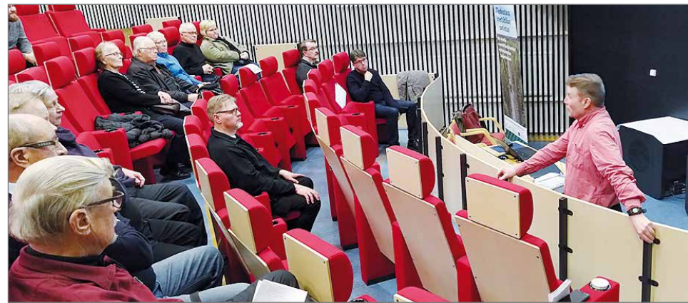
Tilaisuudessa oli paikalla 23 asiasta kiinnostunutta metsänomistajaa.