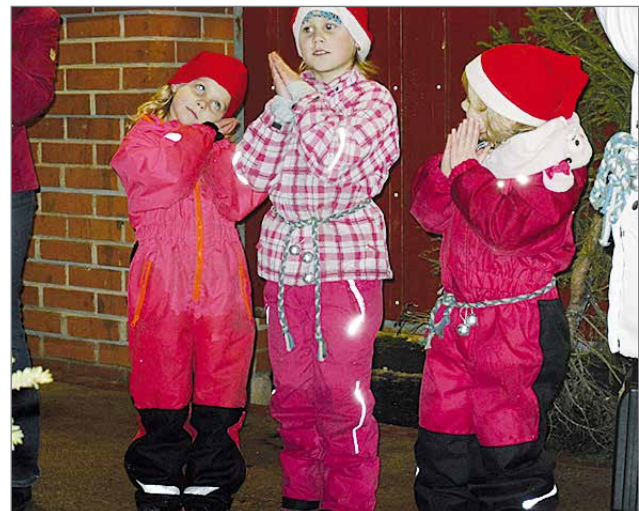
4 H-yhdistyksen pikkutontut leikkivät toriyleisöä.