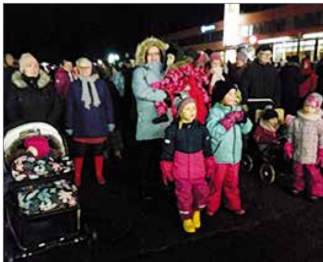
Joulunavajaisissa torilla oli mukavaa ja jännittävää koettavaa.

Perjantai-iltapäivällä 23.11. oli torilla mukavaa liikehdintää ja puheensorinaa Joulutorin myyntipöytien ympärillä. Ahkerat ja taitavat ihmiset olivat leiponeet ja valmistaneet maukkaita tuotteita piristämään monen asiakkaan joulu-kahvi- ja ruokapöytää. Persoonallisia joululahjoja ja kauniita joulukoristeita oli tarjolla vaativammankin ostajan tarpeeseen ja maakuun. Mieltä hyrisyttävää