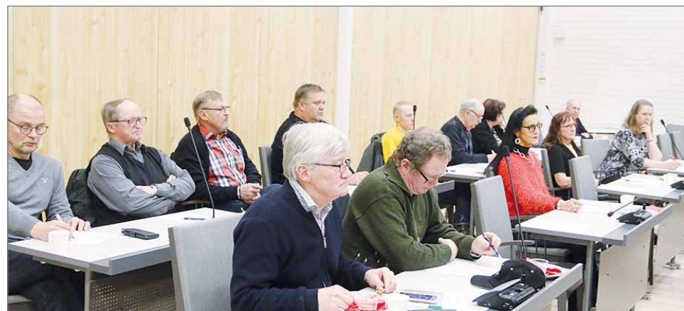
Keskustan Pudasjärven kunnallisjärjestön syyskokouksessa henkilövalintojen lisäksi pa- neuduttiin muun muassa kaupungin taloustilanteeseen.

Näiden alijäämien kuromiseksi täytyy tehdä siis kaikki voitava sekä Pudasjärven kaupungilla, Oulunkaarella että OSAOlla, että talouden tasapaino saavutetaan. Tavoitteena on, että vuoden 2020 talousarvio pitää ja sen lisäksi ensi vuoden aikana valmistuva talousohjelma tuottaa vuodelle 2021 lisää vakautta ja varoja myös poistuvien rakennusten alaskirjauksiin ja purkuihin. HT