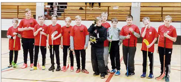
Poikien voittaja Lakan kakkosjoukkue 6AB lk.

Pudasjärven koulujen sähköturnaus pidettiin 13.11. Sääntelysalilla. Poikien puolella voittajaksi selviytyi Lakan kakkosjoukkue. 2. Lakan ykkönen, 3. Hirsikampus 6 lk, 4. Hirvasara-Kipinä, 5. Hirsikampus 5 lk.