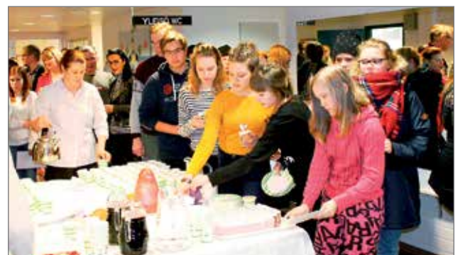
Opiskelijoille oli tarjolla myös kakkukahvit.

määrän, 0,40 hoitotyöntekijää asiakasta kohti. Nämä mitoituksethan ovat vähimmäismäärä mitoituksia ja katsomme, että tuo nykyinenkään mitoitus ei ole riittävä kaikissa hoivayksiköissä, kirjeessä tiedusteltiin. JK