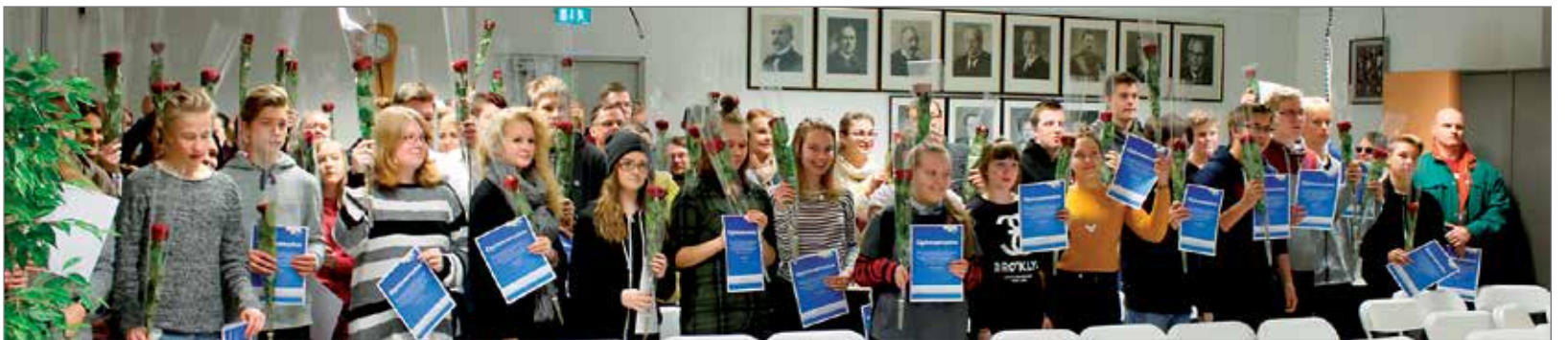
Kaupunki jakoi kaikille toisen asteen koulutuksen aloittaville opiskelijoille ruusut ja stipendit.

tit vuodelle 2016 säilyivät ennallaan tähän vuoteen verrattuna, paitsi rakentamattoman rakennuspaikan prosentti nousi kahdesta kolmeen. Ennallaan säilyvät kiinteistöveroluemat: Yleinen kiinteistöveroprocentti 0,80, vakituinen asuinrakennus 0,40, muu asuinrakennus 0,87, voimalaitosrakennukset 2,50 ja yleishyödylliset yhteisöt 0,40 prosenttia.