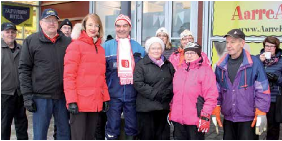
Kansanedustaja Tytti Tuppurainen vieraili Pudasjärvellä kertomassa Eduskunnan viimeaikaisia kuulumisia, otti vastaan äänestäjien toiveita ja terveisiä sekä vastaili ajankohtaisien asioiden kysymyksiin.

Kansanedustaja Tytti Tuppurainen (SDP) vieraili Pudasjärvellä lauantain 14.11. S-marketin edustalla. Hän oli kutsunut ihmisiä paikalle puhumaan politiikkaa. Paikalliset puolueen aktiivit olivat järjestäneet telttakokoksen ja tarjosivat kahvia ja kahvileipääkin oli tarjolla. Tuppurainen kertoi olevansa järkyttynyt edellisena iltana tapahtuneesta ja yöllä uutisoidusta terroristien tekemistä hirmuteoista Pariisissa.