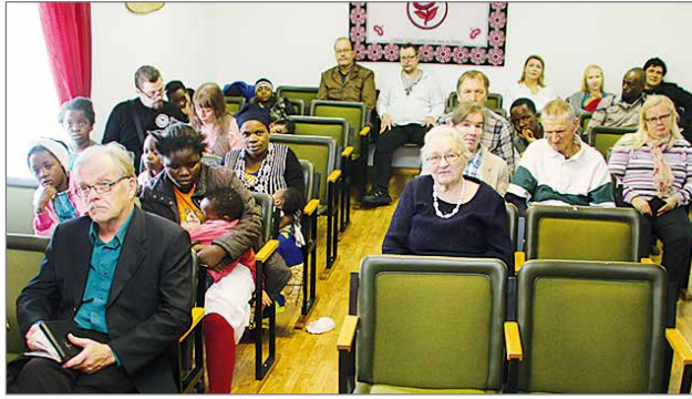
Jumalanpalvelukset ovat säännöllisesti joka sunnuntai kello 13.