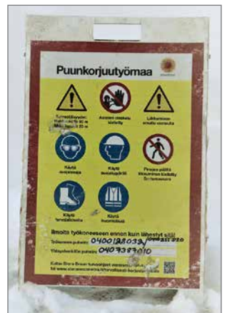
Opastetaulu on jokaisen Stora Enson hakkuutyömaan välittömässä läheisyydessä.

Stora Enson tavoitteena on olla työturvallisuuden