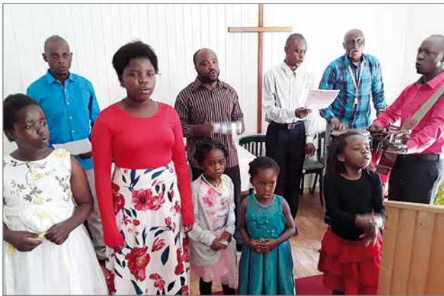
Maahanmuuttajilla on oma laulukuoronsa ja jotkut heistä pitävät todistuspuheenvuorojakin tilaisuuksissa.