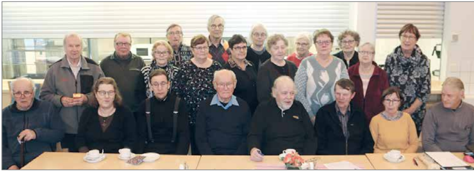
Pudasjärven Eläkeläisten syyskokousväkeä Palvelukeskuksessa.

Pikkujoulu järjestetään perjantaina 13.12. palvelukeskuksessa. Ensi vuonna tehdään vierailuja oman kaupungin alueella, tehdään teatteriretkiä sekä jatketaan säännöllistä kerhoa ja virkistystoimintaa.