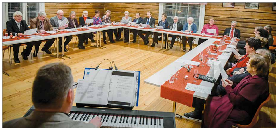
Senioriopettajien 10-vuotisjuhla järjestettiin Koskenhovin historiallisessa pirtissä, jossa on myös lattia uusittuna, kuten kuvasta näkyy.