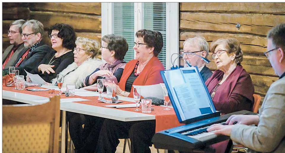
Koululauluja. Oli ilahduttavaa kuulla, miten vanhat ja tutut koululaulut soivat heleästi opettajaveteraanien esittämänä. Sanoja paperille printattuina ei tarvittu, nuoteista nyt puhumattakaan.