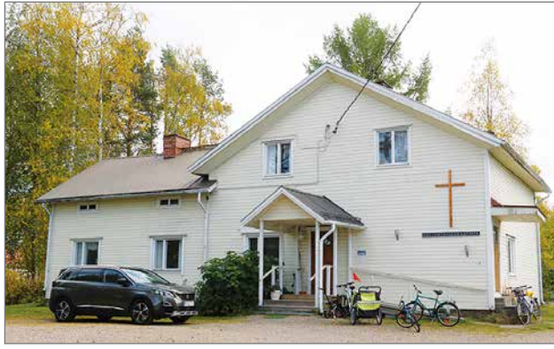
Toiminnan keskipisteenä on oma rukoushuone osoitteessa Kauppatie 34.

Ennen omaa rukoushuonetta, helluntaikokouksia pidettiin ihmisten kodeissa eri puolilla Pudasjärveä. Nyt toiminta on keskittynyt rukoushuoneelle, mutta tilaisuuksia voidaan pitää tar-