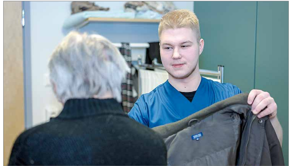
Koulutuskuntayhtymä OSAO kouluttaa sosiaali- ja terveysalan ammattilaisia.