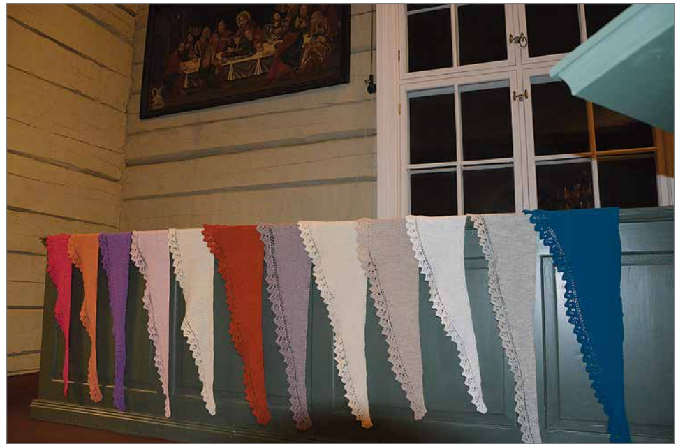
Pudasjärven seurakunta sai 12 Lohtuhuivia lahjoituksena. Idea on lähtöisin Tampereen seurakunnasta.

Kiedo se harteillesi ja surun kyynelten läpi anna rak-