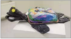
Vieraslajeja tulevaisuudesta edustaa "Lusikkasuu"-teos.