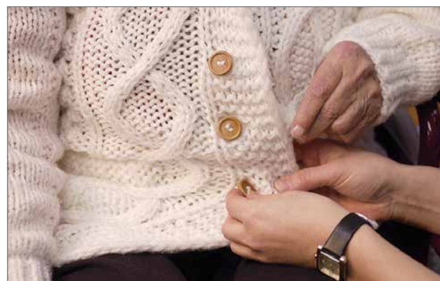
Kotihoidossa tehdään työtä sydämellä asiakkaan omassa kodissa.

Kotihoito on jaettu viiteen eri tiimiin, joista yksi toimii Yläkartanossa ja neljä Palvelukeskuksessa. Jokaisessa tiimissä on oma sairaanhoitaja. Työntekijöittemme hyviä ominaisuuksia ovat reipas, työhön tarttuva ote sekä itsenäistä työtä pelkäämätön. Hoidolliset toimenpiteet ovat lisääntyneet, joten myös kädentaitoja arvostetaan. Koska töitä tehdään ikäihmisten kotona, on kunnioitettava sitä työympäristöä missä kulloinkin