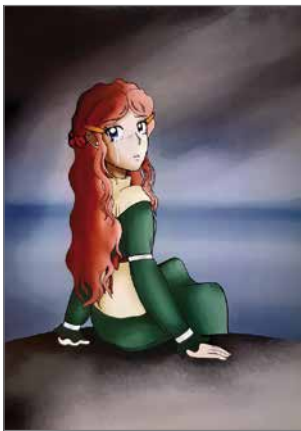
Aino teoksen taidemaalari pyrki tuomaan surumielisyyttä, pakokauhua, ahdistusta, negatiivisia tunnetiloja, joista Aino haluaa paeta.

Kun maailma lakkaa kertomasta jotain tarinaa, tarinan sankarit vetäytyvät sinne mistä tulivatkin, mutta imeytyvät kuitenkin maa-