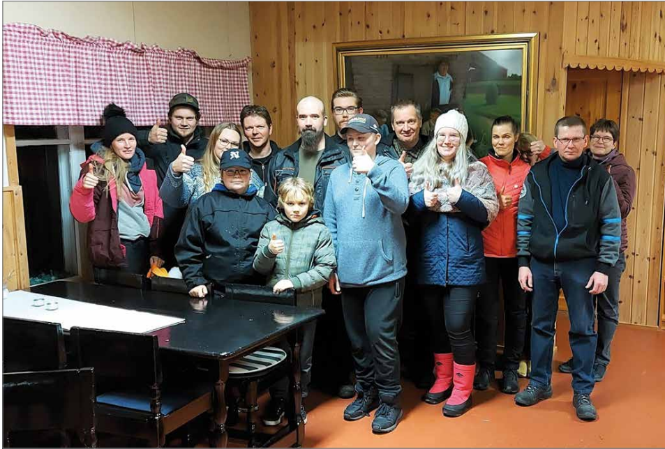
Yleisessä vuosikokouksessa oli positiivista tunnelmaa!

Edelleenkin kaipaamme lisää sekä osallistujia, että toimijoita uudistamaan seu-