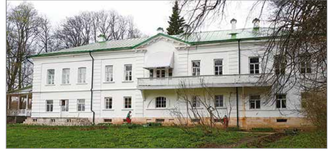
Kartanon päärakennus puutarhan puolelta.