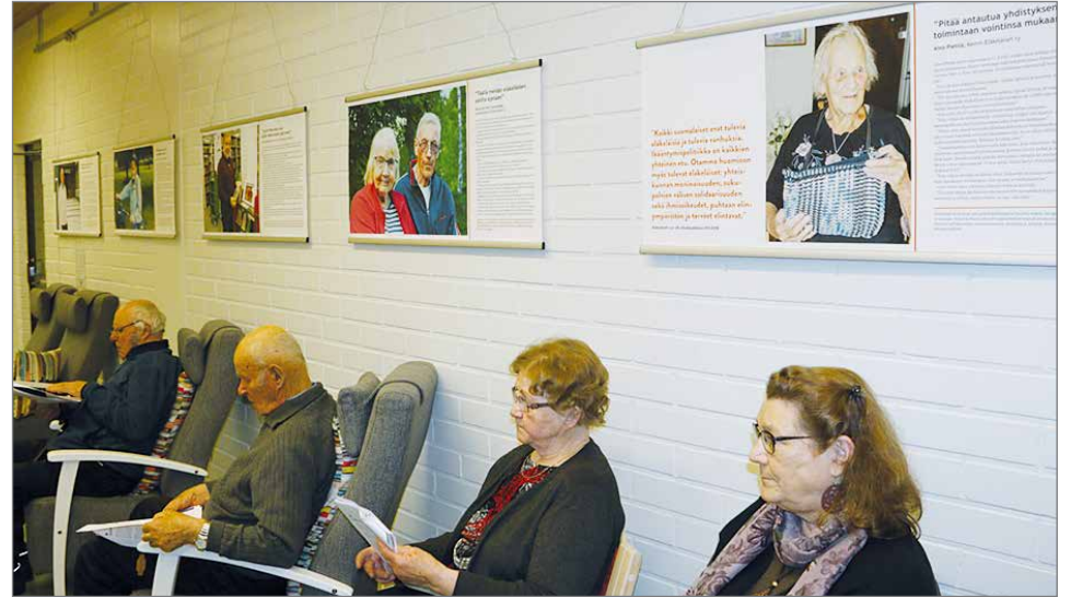
Pudasjärven kirjastossa on esillä kahdeksan eri Eläkeläiset ry:n toiminnasta kertovaa taulua.