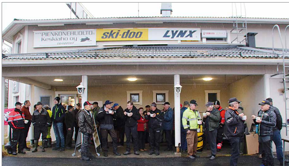
Tihkusateella sisäänkäynnin yhteydessä oleva katos täyttyi hernekeittoa nauttivista asiakkaista.

myydään alta pois ja uudet mallit ovat tulleet syksyllä myyntiin. Pienkoneita menee tasaisesti ympäri vuoden. Mönkijät kasvattavat suosiotaan talviajokkina lumilevyjen ja linkojen sekä telastojen ansiosta, jotka monipuolistavat sen käyttömahdollisuuksia ympärivuotiseksi niin työ- kuin huvikäytössä, Keskiholla toteaa. HT