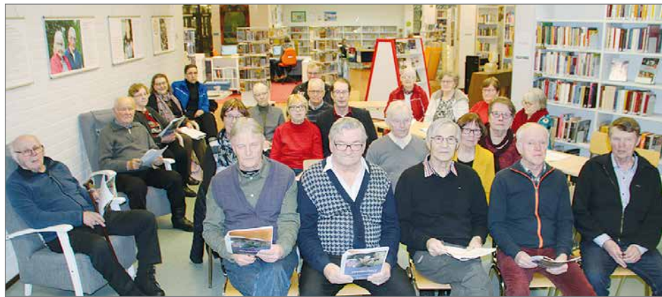
Eläkeläisten toiminnasta kertovan näyttelyn avajaiset olivat samalla Pudasjärven Eläkeläiset ry:n 40-vuotisjuhla.

Monilla paikkakunnilla kiertänyt näyttely tuli Pudasjärvelle Muhokselta. Juhlavuosi 2019 huipentuu 4.12. Kulttuuritalolla Helsingissä järjestettävään koko päivän kestävään juhlapahtumaan, jonne myös kirjastossa esillä olevat taulut toimitetaan. HT