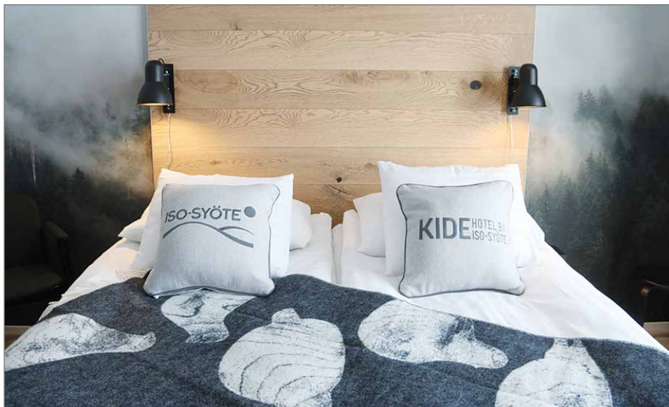
Hotelli Kide sisältää 60 hyvin varusteltua hotellihuonetta, joihin enimmillään lisävuoteita käyttämällä mahtuu 180 hotellivierasta.