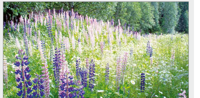
Lupiinin torjunta pohjoisissa taajamissa on tärkeää, sillä arktisille alueille vievät tiot ovat haitallisten vieraskasvien leviämisreitit.

Esimerkiksi lupiin torjunta juuri pohjoisissa taajamissa on tärkeää, sillä arktisille alueille vievät tiot ovat haitallisten vieras-