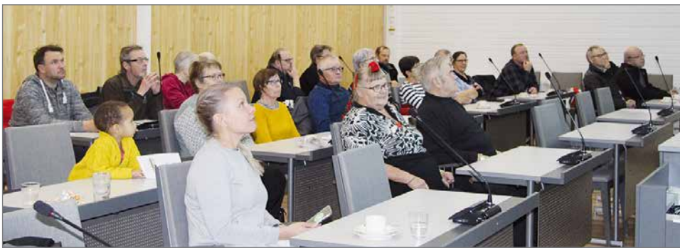
Rahoitusinfoilta on katsottavissa Pudasjärven kaupungin YouTube -kanavan kautta