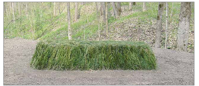
Leo Tolstoin hauta vihreän taikasauvan paikassa. Tolstoi ei halunnut haudalleen mitään muistomerkkiä.

kupukujakin. Ne tarvittiin tärkeämpään, sillä perhe vaihtoi niillä ruokaa sisällissodan ja nälänhädän runtelemassa Neuvostoliitossa.