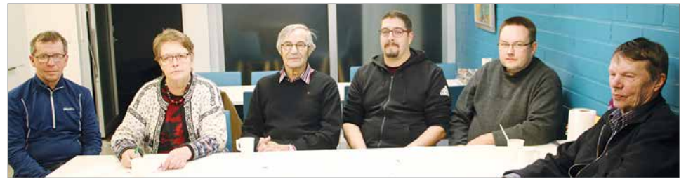
Vasemmistoliiton Pudasjärven osaston syyskokouksen väkeä yhteiskuvassa.

Kokouksen keskustelu oli totutun vilkasta. Keskustelua herätti kuntamme huonolta näyttävä taloudellinen tilanne, sekä valtakunnan poliitikanteossa käytetyt tunteet, kuten viha ja pelko. Nämä tunteet ovat ihmiselle hyvin alkukantaisia ja luonnollisia, siksi niihin vedoten on tehty niin voimakasta ja vetoavaa politiikkaa. Kuitenkin on niin, että vihalla ja pelolla saadaan ihmiset kokoon tumaan, mutta mitään hyviä asioita niiden pohjalta ei voi