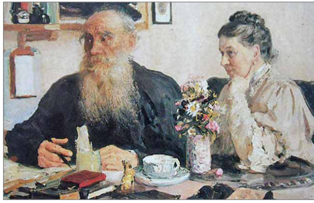
Leo ja Sonja Tolstoi Jasnaja Poljanassa 1907. Ilja Repinin maalauksena.

Radikaaleissa kirjoituksissaan Tolstoi hyökkäsi valtiota ja kirkkoa vastaan. Hänet erotettiin kirkosta, mutta tsaarin mahtikäskystä valanpitäjät jättivät kuuluisan kirjailijan rauhaan. Hän sai runsaasti seuraajia, joista osa oli aidosti kiinnostuneita mutta monet onnenonkijoita, jotka matkivat Tolstoin talonpoikaista elämäntapaa.