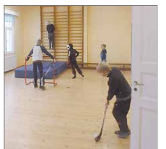
Syyslomalla lapset pelaamassa sählyä Paukkerinharjun kylätalolla.