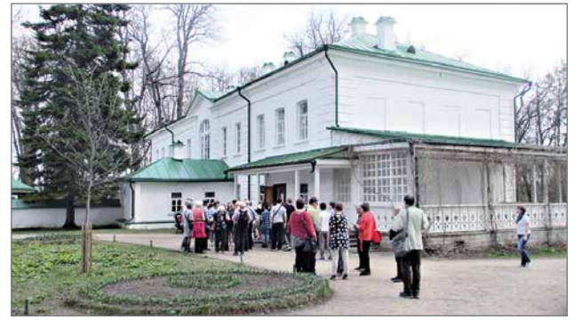
Leo Tolstoin Jasnaja Poljana on suosittu turistikohde.

Kreivitär Sonja Tolstoi kuoli sata vuotta sitten marraskuussa 1919. Hänet haudattiin läheiseen kirkkotarhaan nukkavierussa aamutakissa, vaikka hänellä olisi ollut silk-