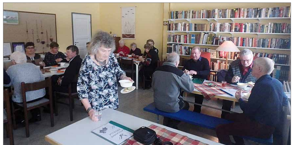
Varttuneempaa väkeä oman ohjelmansa ohessa ruokailemassa.