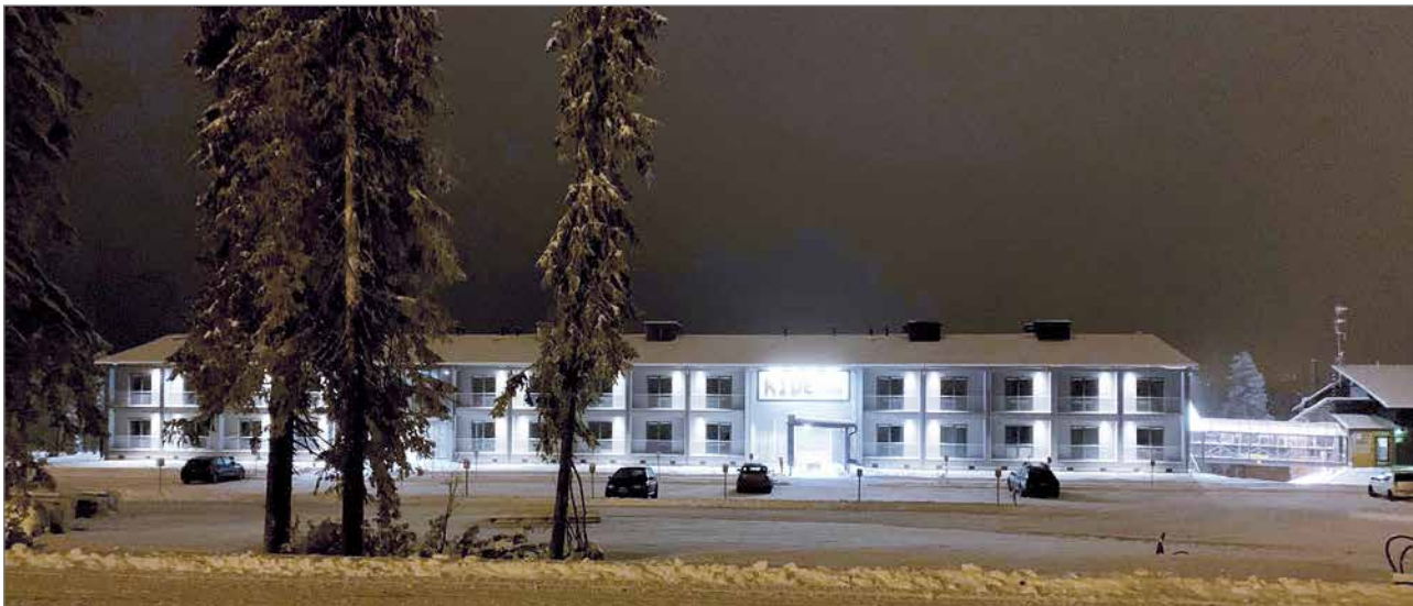
Kide hotelli avauspäivänä iltavalaisuksessa. Oikealla näkyy lasinen käytävä Safaritalossa toimivaan yhteiseen ryhmätila Loungeen ja ravintola Tubaan.

Iso-Syötteen eturinteiden juurelle avattiin perjantaina 1.11. KIDE Hotelli ja ravintola Tuba, joissa avajaisviikonloppuna olikin mukavasti jo kuhinaa. Hotelli ja ravintola vastaanottivat ensimmäiset asiakkaansa talvisessa säässä.