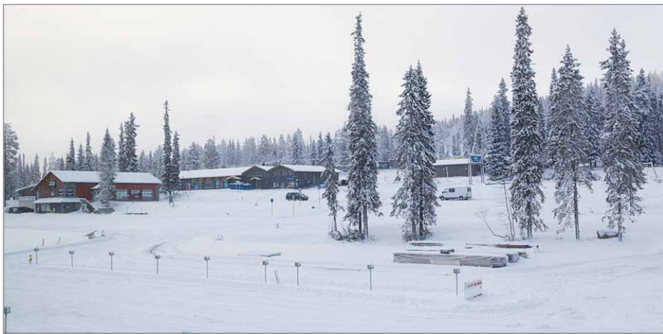
Hotellihuoneiden ikkunoista avautuu kaunis näkymä joko laskettelurinteille päin tai Syötteen kauniiseen metsäiseen luontoon Luppoveden suuntaan. Etualalla näkyy pysäköintialuetta, jossa jokaiselle huoneelle on varattu oma lämmityksellä varustettu autopaikka.