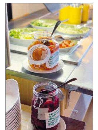
Tubassa hyödynnetään paikallisia raaka-aineita.