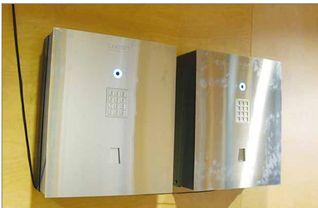
Kännykän käytön mahdollisten ongelmien varalta hotellissa on jatkuvasti auki olevassa lämpimässä tilassa vara-järjestelmä, jossa on mahdollisuus saada yhteys hotellin päivystävään henkilöhön ja muutama turvallisuuskysymykseen vastattuaan on mahdollisuus saada kuvassa näkyvästä järjestelmästä perinteinen avainkortti. Huoneessa voi ladata myös kännykän akkuja.