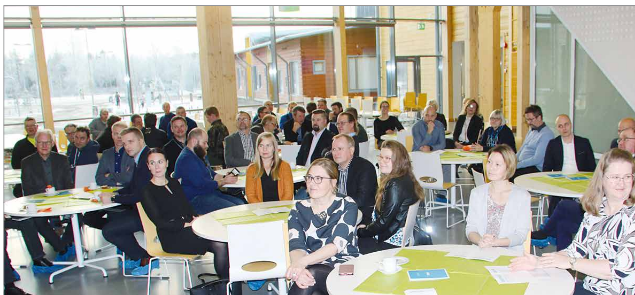
Hirsikampuksella peruskiven muurausjuhlaan osallistui viitisenkymmentä henkeä.