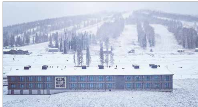
Tänä vuonna uusi hotelli on kokenut jo alkutalven lumipyryn.