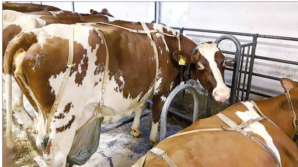
Alli-lehmä on sielukas ja saanee 100-tonnaritittelin ja Kellolammen viljelijät palkinnon ja kunniakirjan.