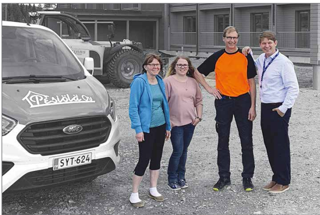
Taivalkoskelainen perheyrittäjä Pesiölä Oy aloittaa 1.11. uuden KIDE hotellin yhteistyökumppanina kiinteistöhuollossa ja siivouksessa.