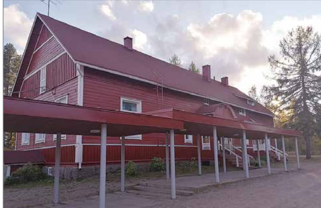
Sarakylän koulu on edelleen toiminnassa ja kylän yhteinen toiminta- ja kokoontumispaikka.

Yhteenvetona voitaneen todeta, että kylillä on aktiivista porukkaa. Tekemisen meininki ja yhteisöllisyys välittyivät kaikista kylistä, niin asukkaiden kuin mök-