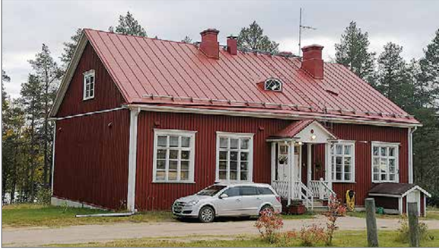
Korpisen kylätalolla on monipuolista toimintaa ja kyläseura on myös kunnostanut ja kehittänyt jatkuvasti taloaan.