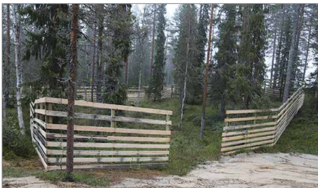
Pytky Cafeen kiinteistön edustalle on rakennettu uusi poroaitaus, johon kootaan turistien nähtäväksi poroja marraskuussa.