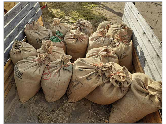
Kauran jyviä kertyi 17 isoa säkkillistä, jotka käytetään riistan ruokintaan.