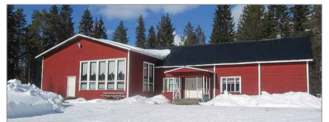
Hetepirtti on tarjonnut ja on valmiina tarjoamaan edelleen monia mahdollisuuksia järjestää tapahtumia kaiken ikäisille.

Jollei kokouksessa löydetä uusia jatkajia nuorisoseuraan, esittää hallitus seuran toiminnan purkamista. Tämä olisi luonnollisesti harmin paikka, sillä samalla kylän ainoa "kyläläisten talo" -Hetepirtti, sulkee ovensa ja kaukalovalonsa. Toiveenamme tietysti olisi, että hetekyläläiset eivät olisi valmiita