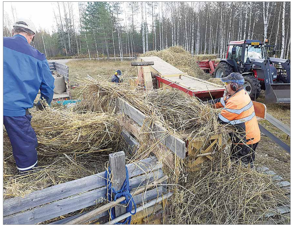
Tämän vuoden pienimuotoinen puintitapahtuma on tarkoitus uusina ensi syksynä koko kylän yhteisenä perinnetapahtumana.