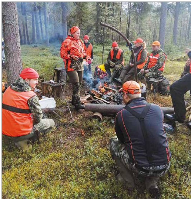
Koivukankaan hirviseura halusi auttaa Syötteen Eräpalvelujen huskyja toimittamalla kaatamistaan hirvistä koirille sopivaa ruokaa.

Koivukankaan hirviseuran väki oli tänä syksynä ensimmäisenä liikkeellä tuomalla hirvistä jäänyttä ylijäämäroipetta huskyille