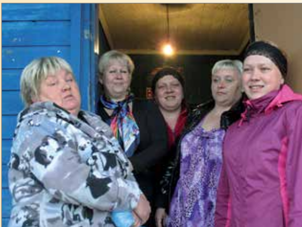
Uuden Jyskyjärven Kesselinaiset ovat innolla mukana mm. leiripäivätoiminnassa.

Sain kuulla majapaikassani, että Jyskyjärven kulttuuritalon