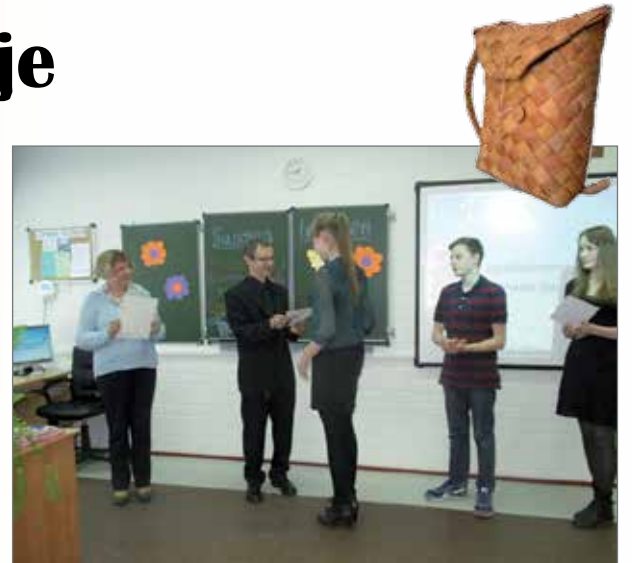
Stipendien jakoa Kostamuksen koulussa.

Lähtöpäivänä maksoimme yhdyshenkilömme kanssa päiväker-