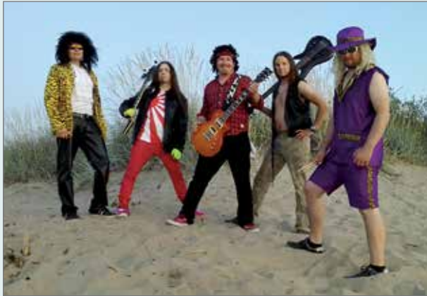
Woyzeck esiintyy Kurenkoskessa lauantaina. Kuva viime kesän keikalta Kalajoella.

Bändi on sovittanut keikkakatahdin hetkeen sopivaksi, perheet ja leipätyöt antavat toiminnalle raamit. Vaikka keikkoja ei pystytä joka viikonloppu tekemään, on pikkujouluaikaan sopivasti tohinnaa. Kymmenkunta keikkaa loppuvuoden aikana urakoi-va bändi esiintyy joulukuussa jopa kahdessa eri paikassa