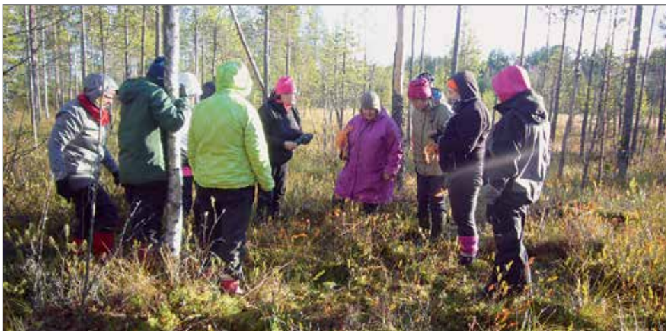
Muutosta metsässä voi kuvata vetämällä linjoja, kuten tässä suolta kankaalle. Linjan varrelta merkitään tutkimusruutuja, joista kerätään lajitietoa ja niiden runsautta. Kuva Jyrkkäkösken leirintäalueen laidalta 5.10.