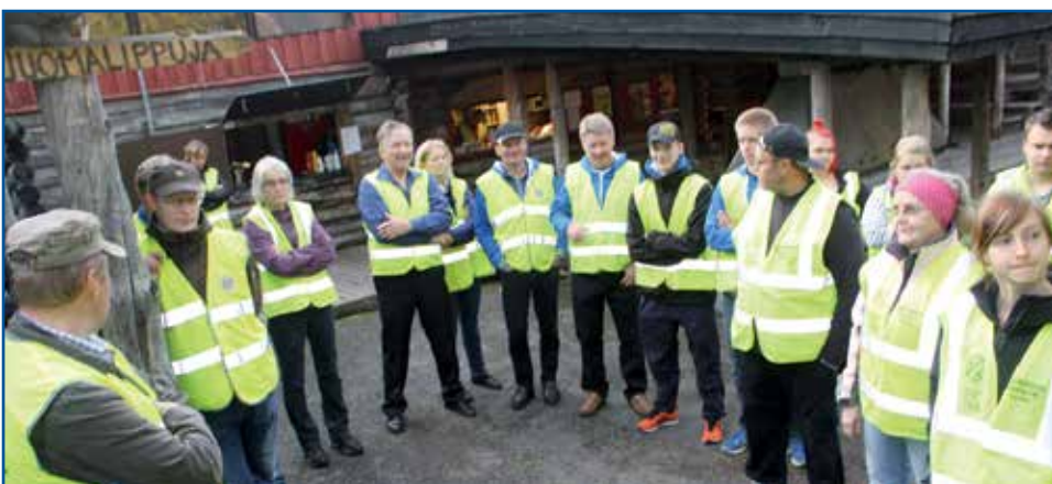
Tapahtumia järjestetään runsaasti ja niihin kuten Jyrkänkin huvien järjestelyihin on talkoolaisia riittänyt. Kuvassa Venetsialaisten talkooporukkaa Jyrkkäkioskella.