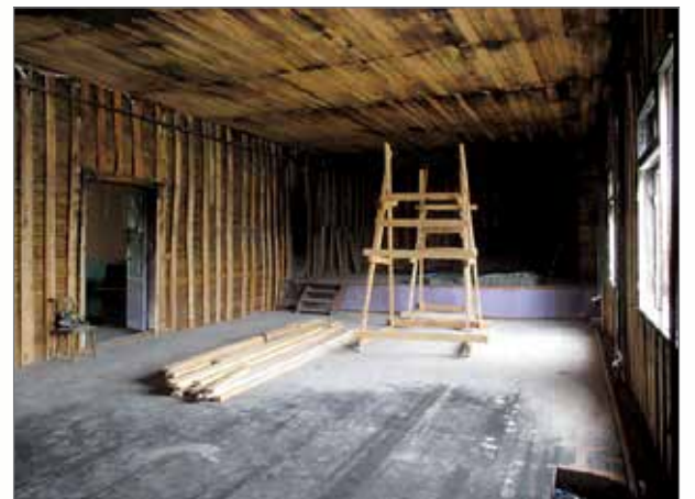
Jyskyjärven kulttuuritalo yritettiin tuhopolttaa, mutta Perttusen pariskunta huomasi palon heti alkuvaiheessa, joten todella suurta vahinkoa ei onneksi tullut.