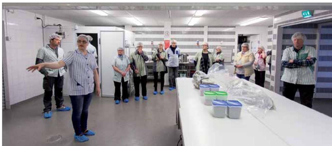
Köökin tiloihin tutustuttiin hygieniasyistä suojavarusteisiin pukeutuneena.

tilaa tuotekehittäjien käytösä. Isoköökissä ja Keskiköökissä pääsee kehittämään ja valmistamaan esimerkiksi lihajalosteita, juures- ja kasvistuotteita, pitopalvelu- ja leipomotuotteita, luonnontuotteita tai luonnonselvityksiä. Isokööki on suuren kokoluokan ja Keskikööki keskikokoluokan yleiskeittiötila. Niistä löytyy myös lihanjalostus- ja pakkauslaitteita. Pikkukööki on pienen kokoluokan yleiskeittiötila, josta löytyy myös hyötykasvikuivuri ja vihannesleikkuri. Tilassa voi kehittää ja valmistaa esimerkiksi juu-