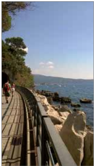
Rantakatua tunnelin läpi eteenpäin, niin saavuttiin vierassatamaan. Kadun varrella oli pieniä kauppiaita, kahviloita ja baareja.