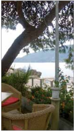
Hotellin rantakahvilasta oli mukava näkymä lahdelle. Adrianmeri aukeaa kauempana vasemmalla.

Pudasjärveltä matkusti syyslokakuun vaihteessa 20 henkilön matkaryhmä Montenegroon, joka on valtio