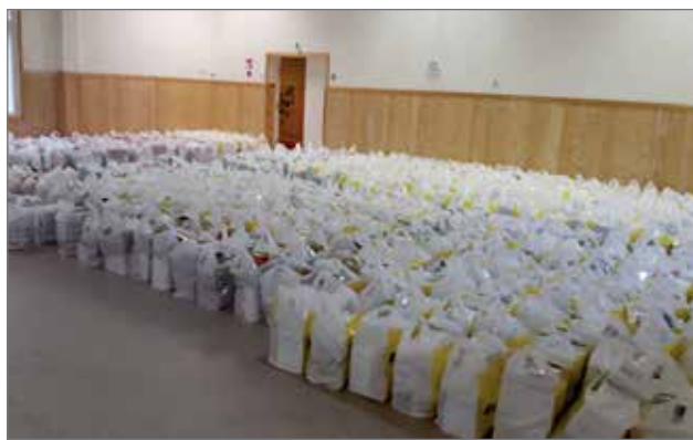
Suojalinnalle oli pakattu noin 600 EU-ruokapakettia, joille kaikille löytyi hakija puoleen päivään mennessä.