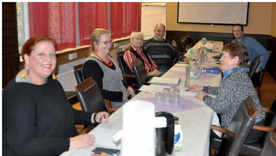
Pudasjärven demareita vilkkaassa keskustelussa. Kuvan ottaja kokouksen sihteeri puuttuu kuvasta.