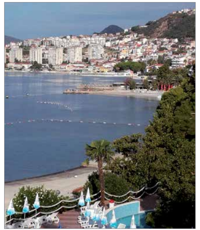
Kaupunkimaisemaa hotellin parvekkeelta.