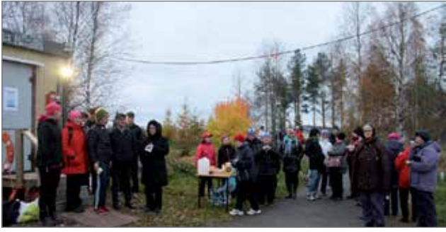
Talviuintikauden avauksessa kävi viitisenkymmentä henkeä. Uimaan rohkeni kymmenkunta henkeä.