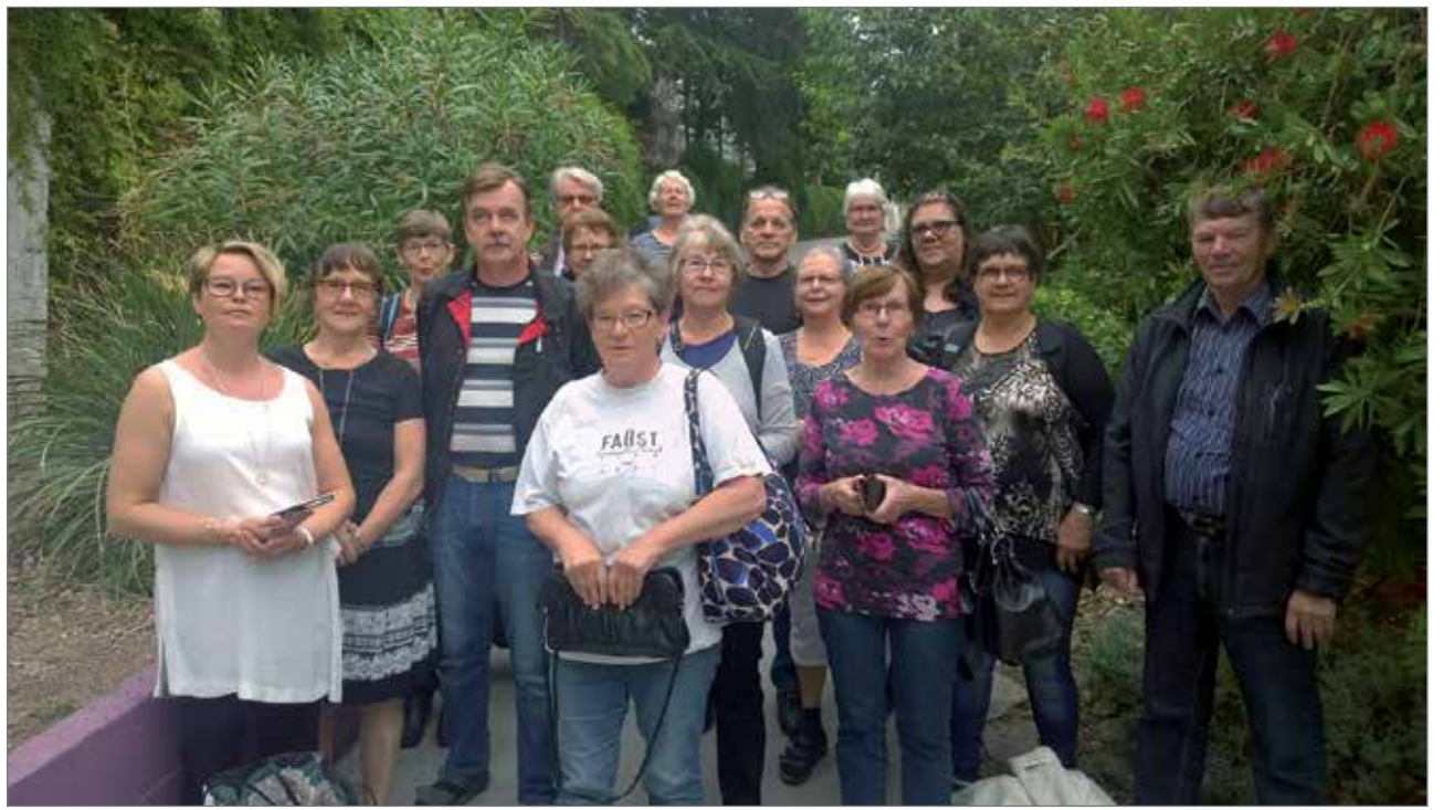
Lähtöpäivän aamuna pudasjärveläisten ryhmäläisiä yhteiskuvassa.