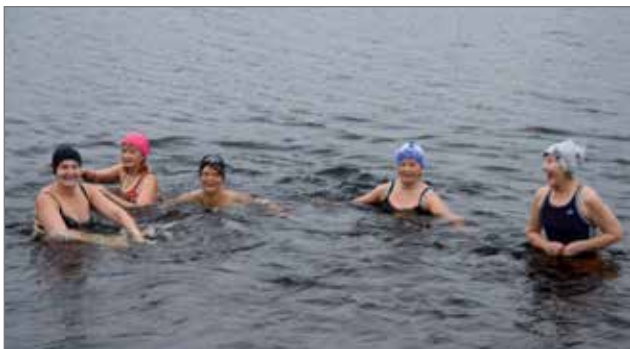
Iloisia uimareita nähtiin talviuintikauden avauksessa Rajamaan rannassa.