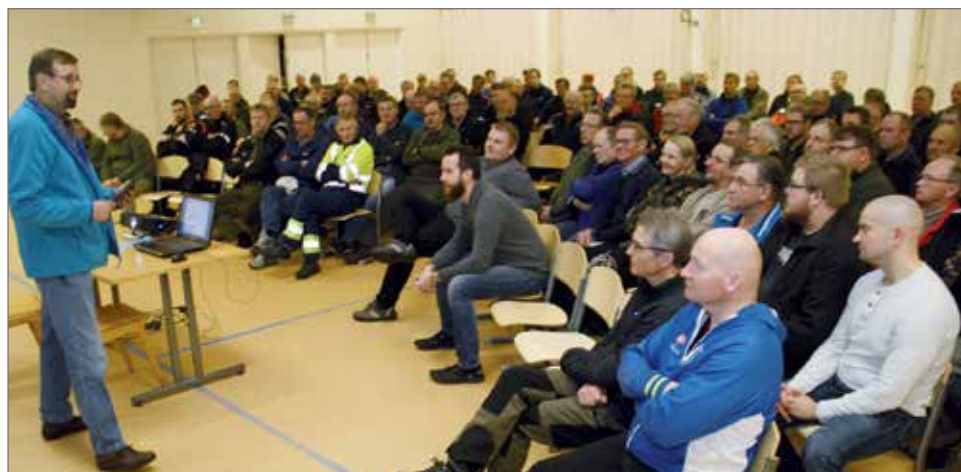
Hirvipalaveriin Rimmin koulun juhlasaliin osallistui noin 100 henkeä.