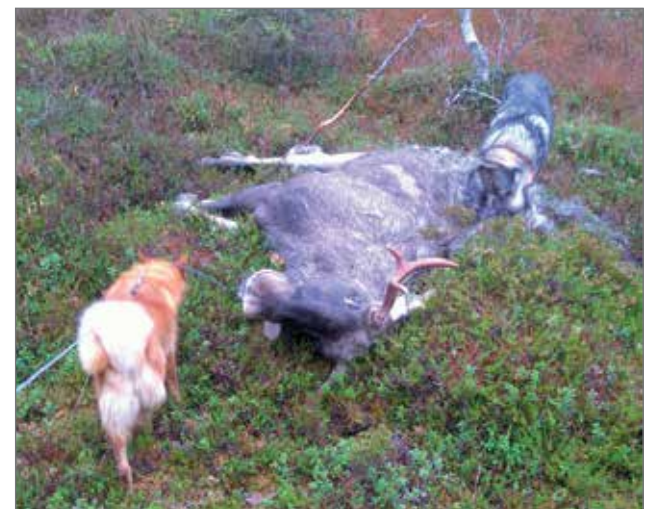
Tästä se oman porukan osalta alkoi!

Kangas käsitteli vielä muun muassa metsästysaseen kuljettamiseen tulleita helpoituksia. Laki onkin tuolta osin järjestyneenä. Kuitenkin on pidettävä mielessä, että vaikka