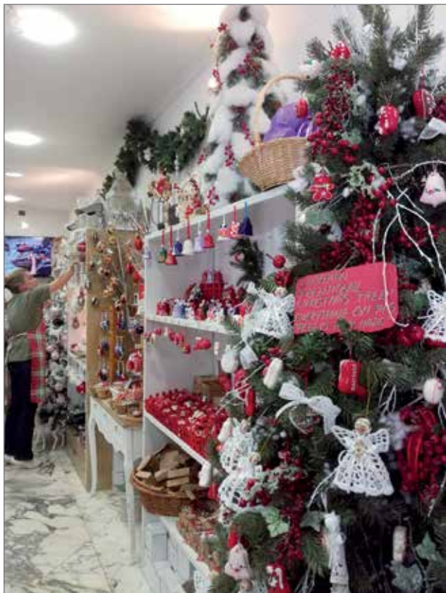
Joulukauppa Dubrovnikin vanhassa kaupungissa.

Balkanilla, Etelä-Euroopassa. Maa rajoittuu osittain Adrianmereen. Maa julistautui itsenäiseksi kesäkuussa vuonna 2006. Montenegro oli aiemmin itsenäinen ruhtinas- ja kuningaskunta vuodesta 1878 aina ensimmäisen maailmansodan loppuun.