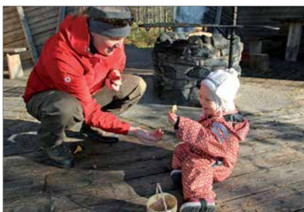
Lapsi ja sienisatoa Syötteen Kellarilammella.

Tänä vuonna luontoviikolla on maksuttomia elokuvanäytöksiä sunnuntaina 22.10., jolloin valkokankaal-