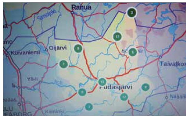
Toiminnanohjaajan yleisnäkymä Oma Riista -järjestelmästä hirvisaaliin osalta.