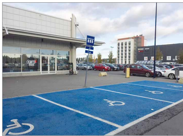
Siniseksi maalatut esteettömän pysäköinnin paikat ovat selkeästi näkyvissä myös talvella. Tähän toivotaan kuntien ja kiinteistöjen omistajien panostusta.

Jotta esteettömiä autopaikkoja riittäisi, niiden löytäminen ja käyttäminen onnistuisi, tarvitaan halua yhteistyöhön sekä toimia niin kunnilta, yrityksiltä kuin myös kaikilta autoilijoilta. Kunta voi varmistaa