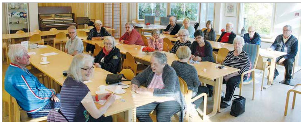
Syyskokousväki saapui Palvelukeskuksen ruokalaan keskustelemaan ensi vuoden toiminnasta ja valitsemaan tulevan toimikauden hallituksen edustajat.

Kerhossa tiedotettiin myös tulevasta Oulu-Kai-