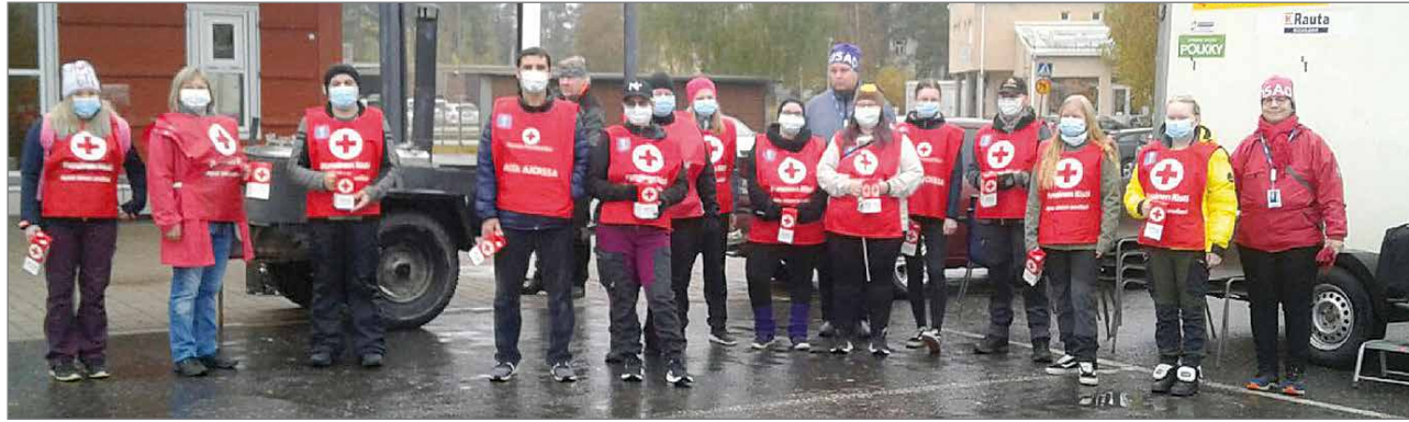
Lähihoitajaopiskelijoita kokoontuneena S-marketin edustalle, josta sitten hajaantuivat suorittamaan keräystä eri puolille Kurenalan keskustajamaa.

Punaisen Ristin Nälkäpäiväkeräys järjestettiin Pudasjärvellä 24.-25.9. Torstaina oli 49 ja perjantaina 40 kerääjää. Kerääjinä oli Punaisen ristin aktiivien lisäksi OSAO:n lähihoitajaopiskelijoita ja Hirsikampuksen oppilaita.