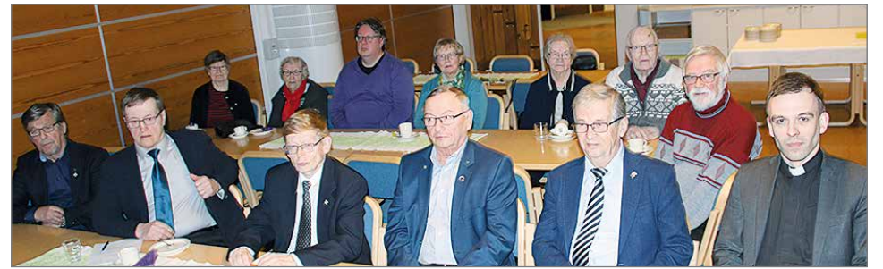
Pudasjärven Sotaveteraanit ry:n väkeä kokoontuneena viime vuoden kevätkokoukseen.

Senioritoiminnassa on myös 63 vuotta täyttäneitä Pudasjärven Yrittäjät ey:n jäseniä, jotka ovat edelleen aktiivisesti yritystoiminnassa mukana.