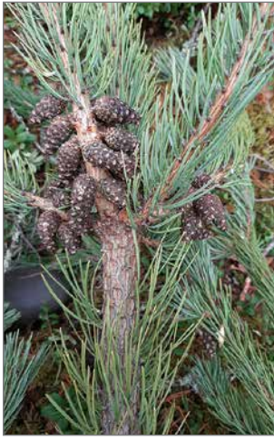
Kerättävät kävyt tulee olla vähintään kolme senttimetrisiä, terveitä, aukeamattomia käpyjä. Ne ovat tasavärisiä ja kiinni viimeisen vuosikasvaimen tyvessä.

Mhy:n varastolla käpyjen vastaanotossa on ollut maanantaisin aamupäivällä jonottamiseen saakka käpyjen tuojia.