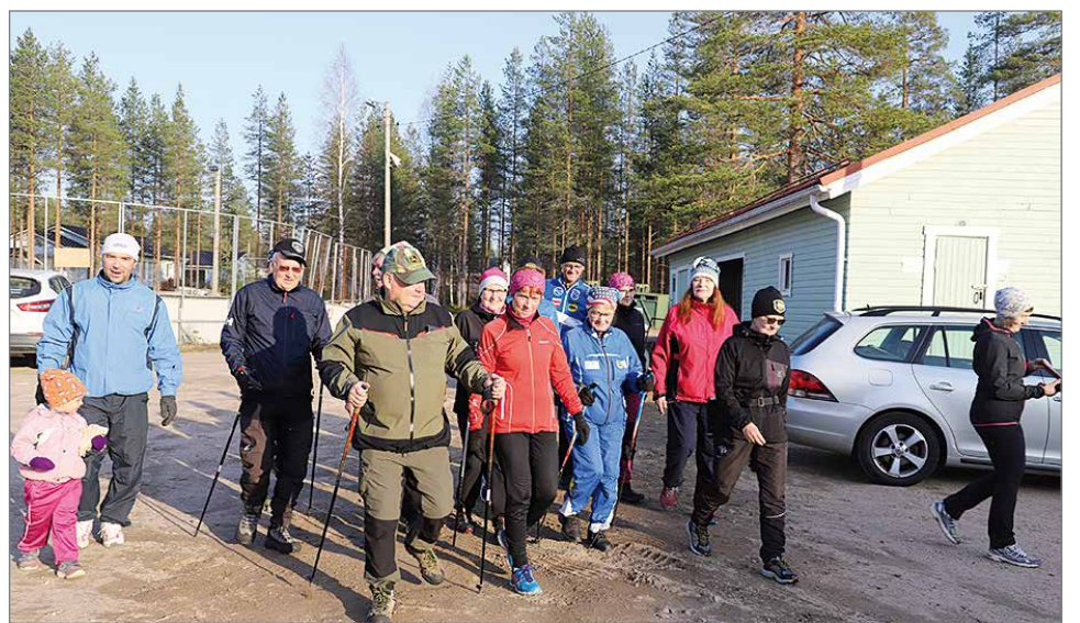
Viime lauantaina 3.10. Ruskatontin kävelyyhin osallistui vuorokauden aikana 60 kävelijää, joille yhteistä matkaa kertyi 758 kilometriä.