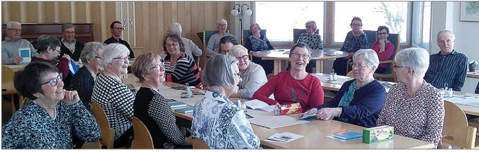
Eläkeliiton Pudasjärven yhdistyksen kerhotapaamisissa on aina iloisia ilmeitä.