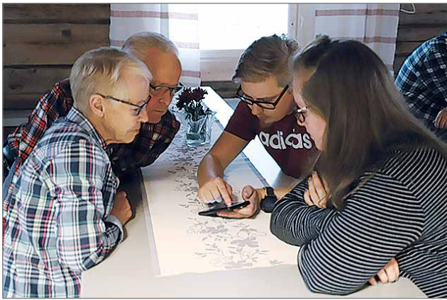
Nykyajan kännyköistä löytyy monenlaista ja mielenkiintoista tietoa.

Marikaisjärven toimitalolla vietettiin avoimien ovien juhlapäivää kesällä tehdyn taloremontin merkeissä. Marikaisjärven rannalla olevan hirsitalon ja siihen kuuluvan tontin omistaa kolme kylällä toimivaa yhdistystä; Marikaisjärven Metsäystyseura, Paavolanjärven Kalaveden osakaskunta ja Kongasjärven Kisapojat, jonka nimissä taloremontti tehtiin. Monet taloa kunnostaneet talkoolaiset kuuluvat kaikkiin kolmeen yhdistykseen. Remontin oman rahan osuutta kartutettiin muun muassa kaksien viime markkinoiden kahvilateltan tuotoilla.