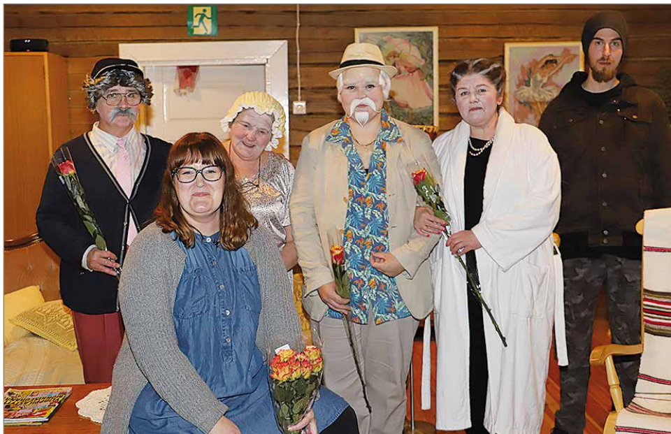
Näyttelijät, ohjaaja sekä musiikin ja tekniikan hoitaja kukitettiin lopussa ja ovat yhteisessä kuvassa.