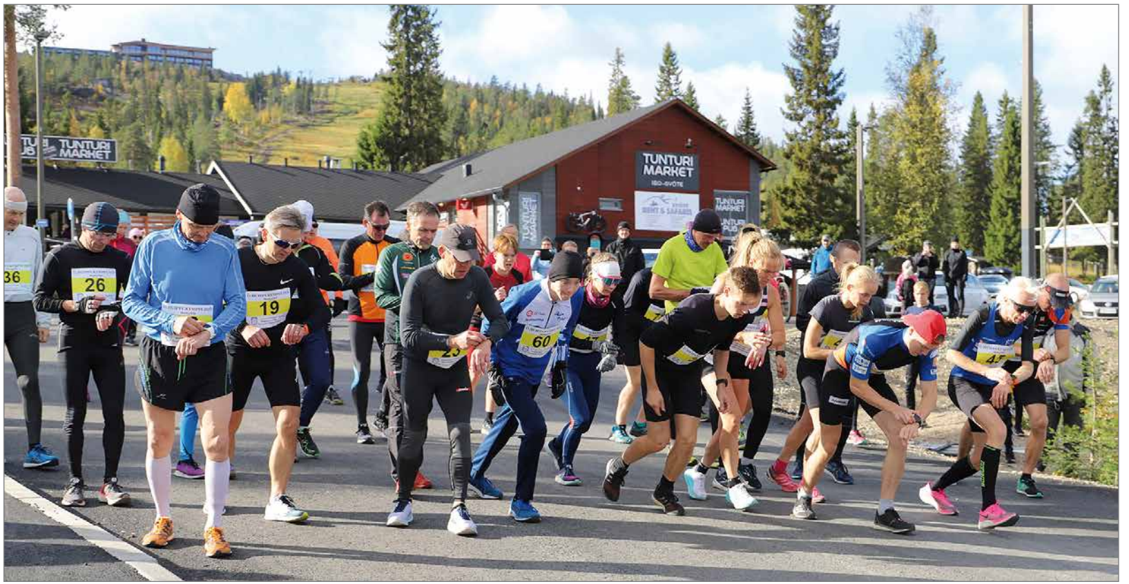
Huippukympin lähtölaukaus on pamahtanut, edessä haastava 10 km matka.