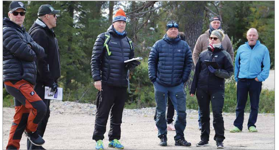
Rinnenousun puolivälissä katsojia ja kannustajia.

Juoksussa on joka kerta mitattu juoksijoiden kuntoa toden teolla. Matkat olivat kahdesta kilometristä kym-