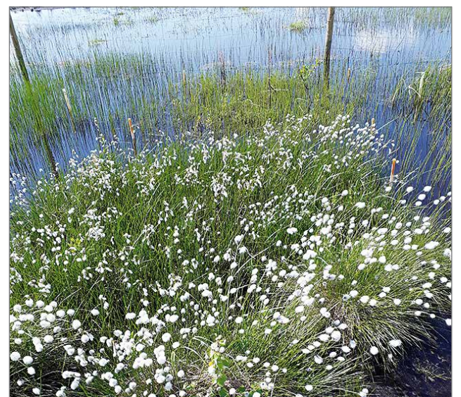
Etualalla siirtoistutettua tupasvillaa tämän vuoden kesäkuussa. Lisäksi taustalla näkyy luhtavillaa ja järvikortetta, jotka molemmat ovat Latvasuolla luontaisesti esiintyviä poron ravintokasveja.