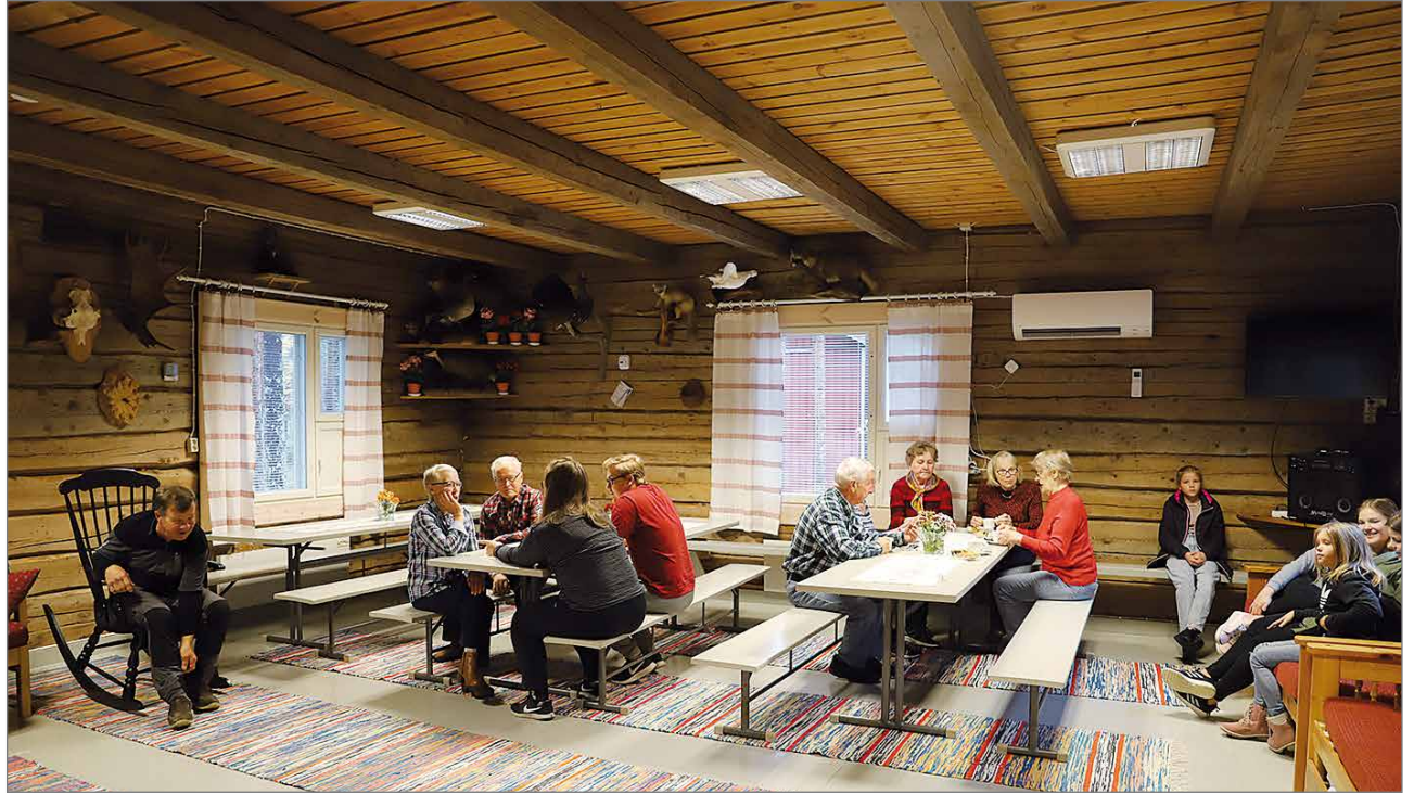
Marikaisjärven hirsistä toimitaloa on pidetty hyvässä ja toimivassa kunnossa erillisen talotoimikunnan toimesta ja ohjauksessa. Ikkunat on muun muassa uusittu pari vuotta sitten Kurenalan koulun ikkunoiden uusiokäytöllä.

Uuden eteisen viereen ulkoterrassin rakentaminen, maalaus ja pihatyöt