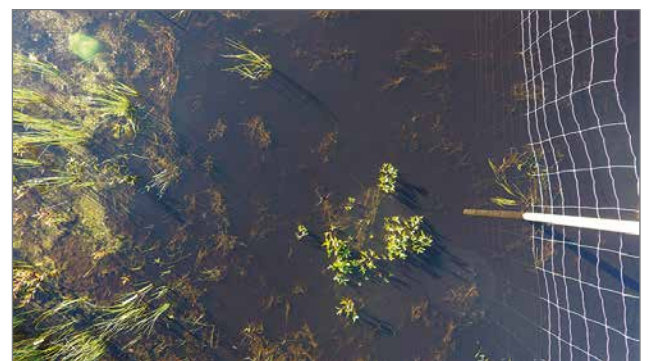
Ilmakuva raatteen kasvustosta Latvasuolla kaksi vuotta istutuksen jälkeen.

Hän myös totesi, että aika hoitaa. Porot tulevat alueille, vaikka niille tehtäisi mitään. Pahinta on alueiden pusikoituminen pajukoiksi, joka estää aluskasvillisuuden kasvamisen.