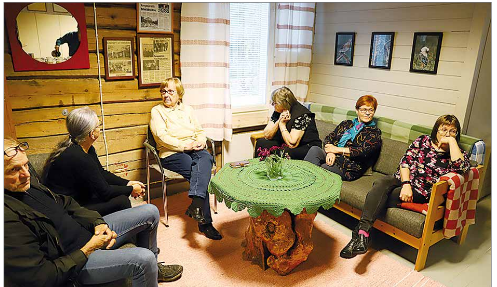
Keittiöalueen yhteydessä oleva nurkkaus on kalustettu viihtyisäksi oleskelutilaksi.

Uudistuneella toimitalolla on vilkasta käyttöä. Sitä vuokrataan omistajayhdistyksen oman käytön lisäksi kyläläisten juhlien ja tilaisuuksien pitämiseen sekä netin kautta myös ulkopuolelle. Astiasto löytyy noin 70 hengelle. Järven rannalla olevaa saunaa vuokrataan myös erikseen.