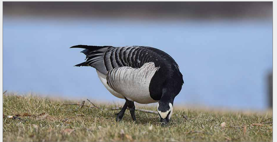
Valkoposkihanhella porskuttaa hyvin. Lähes koko Suomen rannikko on valloitettu ja varsin lyhyessä ajassa.

Kannan kasvaessa laji on joutunut tinkimään hie-man pesäpaikkojen suhteen. Suomessa valkoposkihanki pesii täysin erilaisessa ympäristössä kuin Venäjän tundralla, missä linnut viihtyvät korkeilla rantakallioilla ja törmillä. Kuten kanadanhanhi, myös valkoposkihanki valloitti ennen Suomea Ruotsin rannikon. Ruotsissa kannan kasvu alkoi jo 1970-luvun alussa ja Suomessa noin kymmenen vuotta myöhemmin. Leviäminen alkoi etupäässä Helsingistä käsin ja yksi ensimmäisistä pesimäalueista oli Helsingin Kruunuvuorenlampi. Kanadanhanhi