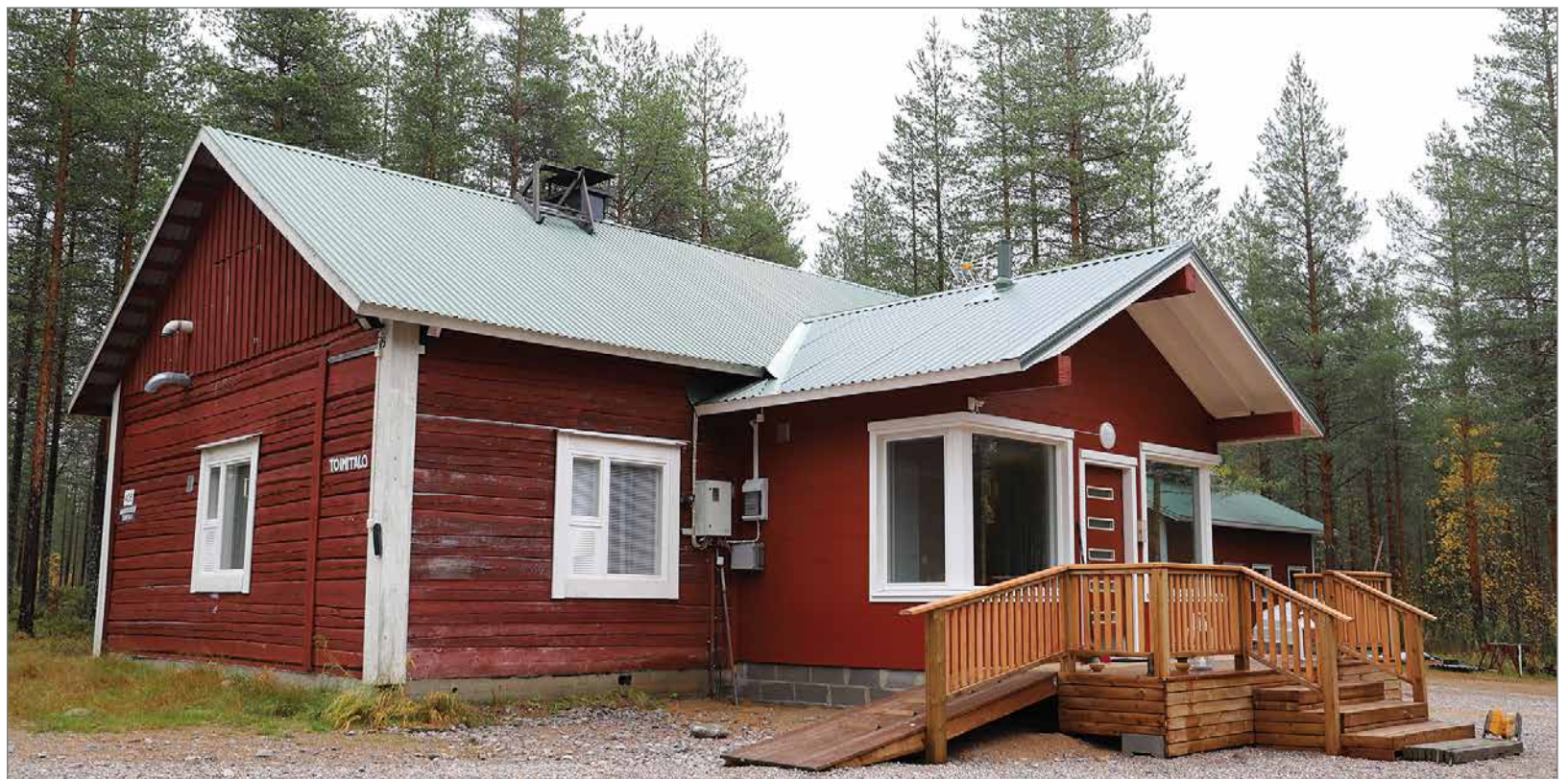
Useita kymmeniä vuosia käytössä ollut hirsitalo sai uuden hirsistä rakennetun eteisen, johon tuli myös sisävässä ja invaluisikan sisältävät rappuset. Myös pihatöitä tehtiin konetyönä.

la on noin 100 vakituista asukasta ja kesäasukkaat siihen päälle. HT